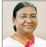
-द्रौपदी मुर्मू, राष्ट्रपति

जनजातियों के समग्र विकास और सरकार की योजनाएँ उन तक सुचारु रूप से पहुंचाने के लिए अधिकारियों को उनके पास जाकर उनकी समस्याओं को समझना होगा, अधिकारी गांव-गांव जाकर आदिवासियों से मिलें और उनके साथ घुल-मिलकर उनकी समस्याओं को समझें, तभी वे वास्तविकताओं से अवगत हो सकेंगे, इसके बाद ही आदिवासियों के समग्र विकास की योजनाएँ शासन स्तर पर बनाई जा सकेंगी, आदिवासी खुलकर अपनी दिक्कतों और समस्याओं लोगों से बताते नहीं हैं, उनके साथ घुल-मिलकर ही उनकी दुश्वारियों समझी जा सकती हैं आदिवासी बहुत आत्मसम्मान से जीते हैं, उनके पास धन नहीं होगा, उनके पास खाने को कुछ नहीं होगा, लेकिन वे आत्मसम्मान से समझौता नहीं करेंगे।