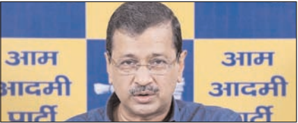
देश में कभी सोना नहीं बेचा गया : केजरीवाल पेज 2

नई दिल्ली, मुजफ्फरनगर, देहरादून, हल्द्वानी, मुगदाबाद, बरेली, मेरठ व लखनऊ से प्रकाशित