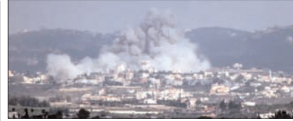
ईरान के केशम द्वीप पर अमेरिकी हमला, ईरान ने भी किया पलटवार पेज 12