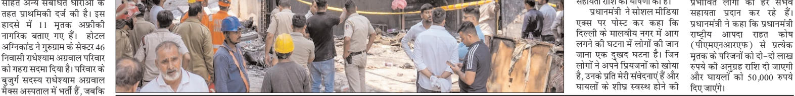
दिल्ली में इलाज के लिए आया था, जो हादसे का शिकार हो गया। जांच में होटल फ्लोरिडा स्टे बी एंड बी में सुरक्षा मानकों के गंभीर उल्लंघन सामने आए हैं। अधिकारियों के अनुसार आग होटल के बेसमेंट में संचालित रेस्तरां 'लेमन ग्रीन' में लगी थी। सूत्रों के मुताबिक होटल में प्रवेश और निकास के लिए केवल एक ही रास्ता था, जिससे आपत स्थिति में लोगों को बाहर निकलने में भारी

नई दिल्ली। प्रधानमंत्री नरेन्द्र मोदी ने राजधानी दिल्ली के मालवीय नगर में बुधवार सुबह एक होटल में आग लगने की घटना पर गहरा दुख व्यक्त किया है और इस हादसे में मारे गए लोगों के परिजन एवं घायलों के लिए सहायता राशि की घोषणा की है। प्रधानमंत्री ने सोशल मीडिया एक्स पर पोस्ट कर कहा कि दिल्ली के मालवीय नगर में आग लगने की घटना में लोगों की जान जाना एक दुःख घटना है। जिन लोगों ने अपने प्रियजनों को खोया है, उनके प्रति मेरी संवेदनाएं हैं और घायलों के शीघ्र स्वस्थ होने की कठिनाई हुई। जांच में यह भी सामने आया है कि होटल को केवल छह कमरों के संचालन की अनुमति थी, जबकि वहां करीब 25 कमरे संचालित किए जा रहे थे और लगभग -शेष पृष्ठ दो पर