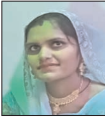
पिता की तहरीर पर पति समेत पांच के खिलाफ मुकदमा दर्ज