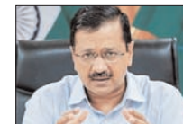
मोदी सरकार में देश के आर्थिक हालात बदतर हो चुके

आम आदमी पार्टी (आप) ने कहा है कि मोदी सरकार में देश के आर्थिक हालात इतने बदतर हो चुके हैं कि सरकार को अब देश का सोना बेचना पड़ रहा है। आप के राष्ट्रीय संयोजक अरविंद केजरीवाल समेत पार्टी के कई वरिष्ठ नेताओं ने देश का सोना बेचने पर न सिर्फ मोदी सरकार पर तीखा हमला बोला है, बल्कि प्रधानमंत्री नरेंद्र मोदी से देश के आर्थिक हालात भी जनता के सामने रखने की मांग की है। ब्यूम्बर्ग की रिपोर्ट को साझा करते हुए केजरीवाल ने कहा कि पिछले 76 साल में कई ऐसे मौके आए जब देश कठिन स्थिति में था लेकिन देश का सोना तो कभी नहीं बेचा गया। इसका मतलब हालात बहुत ज्यादा खराब हैं? सरकार कुछ बताती क्यों नहीं? देश के क्या हालात हैं? मोदी जी कहते हैं कि वो तो झोला उठा के चल देंगे। पर हमें तो यहाँ रहना है, इसी देश में रहना है। आप के वरिष्ठ नेता मनीष सिमोदिया ने कहा कि कुछ दिन पहले तक देश को समझाया जा रहा था कि सोना मत बेचो, सोना भविष्य की सुरक्षा है। अब ब्यूम्बर्ग की इस रिपोर्ट में खुलासा हो रहा है कि प्रधानमंत्री ने खुद ही