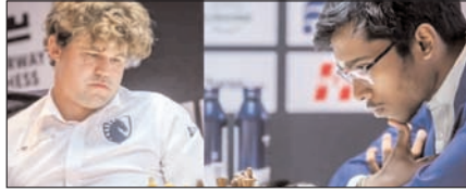
प्रज्ञानंद ने कार्लसन पर दूसरी जीत के साथ इतिहास रचा खेल टाइम्स