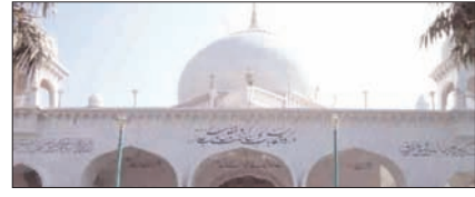
दरगाह बधरा एकता की प्रतीक सम्पादकीय