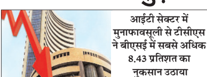
आईटी सेक्टर में मुनाफावसूली से टीसीएस ने बीएसई में सबसे अधिक 8.43 प्रतिशत का नुकसान उठाया

आईटी सेक्टर में भारी विक्रवाली होने से बुधवार को घरेलू शेयर बाजारों में गिरावट रही और टीसीएस का शेयर सबसे अधिक 8.43 प्रतिशत टूट गया। बीएसई का संसेक्स 303.67 अंक (0.41 प्रतिशत) टूटकर 74,346.17 अंक पर बंद हुआ। नेशनल स्टॉक एक्सचेंज (एनएसई) का निफ्टी-50 सूचकांक भी 77.95 अंक यानी 0.33 प्रतिशत नीचे 23,405.60 अंक पर रहा। बाजार पर आज सुबह के समय ज्यादा दबाव था। दोपहर तक संसेक्स 1,157 अंक लुढ़कर 73,492.60 अंक तक उतर गया था। इसके बाद बैंकिंग और वित्तीय कंपनियों में हुई लिक्विडिटी के दबाव से 74,516.65 अंक तक चढ़ने में मदद की, हालांकि यह कभी इरे निशान में नहीं पहुंच सका। आईटी सेक्टर में मुनाफावसूली से टीसीएस ने बीएसई में सबसे अधिक 8.43 प्रतिशत का नुकसान उठाया। संसेक्स की कंपनियों में टेक महिंद्रा का शेयर 6.23 प्रतिशत, एचसीएल टेक्नोलॉजीज का 5.25 प्रतिशत और इंफोसिस का 3.82 प्रतिशत गिर गया। आईटीसी में 2.21 फीसदी, इटरनल में 1.48 फीसदी और एलएंडटी में 1.19 फीसदी की गिरावट रही। अल्ट्राटेक सीमेंट, अडानी पोर्ट्स, बजाज फिनसर्व, बजाज फाइनेंस, बीईएल और रिलायंस इंडस्ट्रीज के शेयर भी नीचे बंद हुए। भारतीय