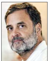
-राहुल गांधी, नेता विपक्ष, लोकसभा