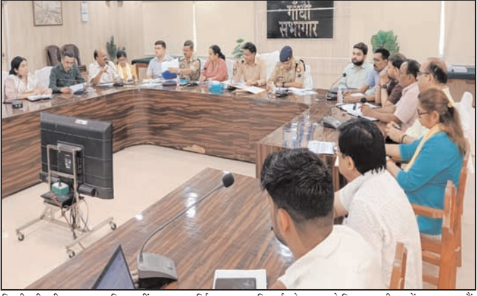
किसी भी कीमत पर प्रभावित नहीं होंगे। उन्होंने कहा कि परीक्षा केंद्रों पर पुरुष एवं महिला अर्थार्थियों की जांच के लिए अलग-अलग स्टाफ की तैनाती की जाए तथा सभी कर्मिकों के लिए फोटोयुक्त पहचान पत्र प्रदर्शित करना अनिवार्य होगा। उन्होंने सैक्टर और स्टेटिक मजिस्ट्रेटों को सौंपे गए दायित्वों का समयबद्ध और जिम्मेदारीपूर्वक निर्वहन करने के निर्देश दिए। जिले में 8, 9 और 10 जून को आयोजित होने वाली परीक्षा के लिए 10 परीक्षा केंद्र बनाए गए हैं। इन केंद्रों पर कुल 28,224 अभ्यर्थी परीक्षा देंगे। प्रत्येक पाली में 4,704 अभ्यर्थी शामिल होंगे। परीक्षा प्रतिदिन दो पालियों में आयोजित होगी। पहली पाली सुबह 10 बजे से

शाह टाइम्स संवाददाता हसनपुर। प्रशासन द्वारा पुलिस भर्ती परीक्षा की तैयारियां युद्ध स्तर पर की गयी हैं। तीन दिनों तक चलने वाली इस परीक्षा के 28 हजार 224