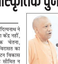
उग्र भारत की सांस्कृतिक चेतना आध्यात्मिक परंपरा और ज्ञान-विरासत का प्रतिनिधि प्रदेश: मुख्यमंत्री

लखनऊ। मुख्यमंत्री योगी आदित्यनाथ ने कहा है कि उग्र केवल आस्था का केंद्र नहीं, बल्कि भारत की सांस्कृतिक चेतना, आध्यात्मिक परंपरा और ज्ञान-विरासत का प्रतिनिधि प्रदेश है। इसलिए पर्यटन विकास को केवल आधारभूत ढांचे तक सीमित न रखकर उसे सांस्कृतिक पुनर्जागरण, स्थानीय अर्थव्यवस्था, रोजगार सृजन और वैश्विक पहचान से जोड़कर आगे बढ़ाया जाना चाहिए। गुरुवार को पर्यटन विभाग की समीक्षा बैठक में मुख्यमंत्री ने कहा कि पर्यटन प्रदेश की सांस्कृतिक अर्थव्यवस्था को नई गति देने का महत्वपूर्ण माध्यम है। इससे स्थानीय उत्पादों, हस्तशिल्प, पारंपरिक कला, खानपान और सेवा क्षेत्र को व्यापक अवसर मिलेंगे। बैठक में भारतीय ज्ञान परंपरा के संरक्षण से जुड़े 'ज्ञान भारत मिशन' की भी समीक्षा की गई। मुख्यमंत्री ने कहा कि प्राचीन पांडुलिपियां भारत की सभ्यता, दर्शन और वैज्ञानिक परंपरा में अमूल्य धरोहर हैं। इनके संरक्षण और डिजिटलीकरण से नई पीढ़ी अपनी जड़ों से जुड़