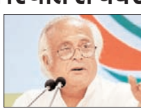
एफपीआई को राहत देने के लिए आयकर कानून में संशोधन अध्यादेश लाने की तैयारी जारी: कांग्रेस

कांग्रेस ने आरोप लगाया है कि देश की अर्थव्यवस्था सुस्त निवेश, कमजोर मांग और निजी क्षेत्र की निवेश में घटती रुचि जैसी चुनौतियों का सामना कर रही है और सरकार इन समस्याओं के समाधान के ठोस उपाय करने की बजाय विदेशी पोर्टफोलियो निवेशकों (एफपीआई) को रहत देने के लिए आयकर कानून में संशोधन संबंधी अध्यादेश लाने की तैयारी में है। पार्टी का कहना है कि यह कदम अर्थव्यवस्था की बुनियादी समस्याओं का समाधान नहीं कर सकता इसलिए सरकार को आर्थिक स्थिति को लेकर घबराहट में कदम उठाने के बजाय ठोस उपाय करने की दिशा में पहल कर दीर्घकालिक उपाय करने चाहिए। कांग्रेस संचार विभाग के प्राधेन जयराम रमेश ने गुरुवार को एक बयान में कहा कि एक समाच.