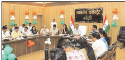
अभियान के दौरान केंद्र और राज्य सरकार की जनकल्याणकारी योजनाओं, उपलब्धियों तथा विकास कार्यों को आमजन तक प्रभावी ढंग से पहुंचाया जाए। उन्होंने अधिकारियों को निर्देश दिए कि कार्यक्रमों में जनभागीदारी सुनिश्चित की जाए, ताकि अभियान को जनआंदोलन का स्वरूप दिया जा सके। उन्होंने बताया कि अभियान की शुरुआत