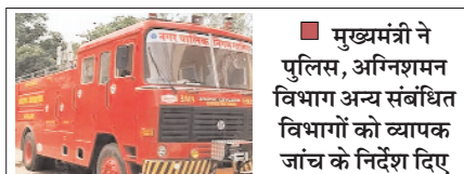
मुख्यमंत्री ने पुलिस, अग्निशमन विभाग अन्य संबंधित विभागों को व्यापक जांच के निर्देश दिए

लखनऊ/वाराणसी। दिल्ली में हुए भीषण अग्नि कांड के बाद उग्र सरकार ने प्रदेश भर में अग्नि सुरक्षा व्यवस्था को लेकर सतर्कता बढ़ा दी है। मुख्यमंत्री योगी आदित्यनाथ ने पुलिस, अग्निशमन विभाग, लोक निर्माण विभाग तथा अन्य संबंधित विभागों को व्यापक जांच और सुरक्षा ऑडिट के निर्देश दिए हैं। मुख्यमंत्री ने कहा है कि प्रदेश की सभी हाईराइज इमारतों, व्यावसायिक प्रतिष्ठानों, सरकारी और निजी कार्यालयों, होटल, मॉल तथा अन्य सार्वजनिक भवनों की सतर्क जांच कराई जाए। जहाँ भी अग्निशमन मानकों में कमी पाई जाए, वहाँ तत्काल सुधारत्मक कार्रवाई सुनिश्चित की जाए।