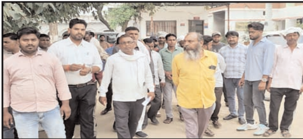
देते हुए उनसे वहां पर फड़ न लगवाने का अनुरोध किया। आरोप है कि एफएसओ ने उनके साथ दुर्व्यवहार व अभद्रता की और जातिसूचक शब्दों से भी अपमानित किया। हालांकि एफएसओ ने इन आरोपों का खंडन करते हुए पालिकाकर्मियों पर ही

शाह टाइम्स संवाददाता, गजरीला। अग्निशमन विभाग के एफएसओ पर कार्रवाई की मांग को लेकर नगर पालिका के कर्मचारी थाने पहुँचे। उन्होंने यहां के बाद सीओ कार्यालय में पहुंचकर सीओ को अपने बयान दिए। कहा कि एफएसओ द्वारा किए गए ए दुर्व्यवहार और जातिसूचक शब्दों से अपमानित करने के मामले में उनके विरुद्ध मुकदमा दर्ज किया जाए। बता दें कि बीते दिन नगर पालिका के कर्मचारी बुधवार को व्यवस्थित ढंग से लगावने के लिए ड्यूटी पर थे। उनका आरोप है कि एफएसओ फायर ब्रिगेड ऑफिस के सामने दुकानदारों के फड़ लगाव रहे थे जबकि पालिका कर्मचारियों ने अधिकारियों के आदेश का हवाला