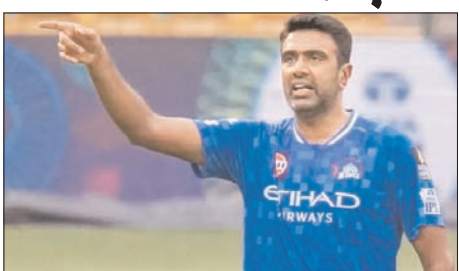
दिलचस्प मिसाल है। मैं एक पल के लिए खूद को सूर्यकुमार यादव के रूप में अपने मन में सोच रहा हूँ कि इस समय वह कैसा महसूस कर रहे होंगे। मुझे यकीन है कि किसी भी खिलाड़ी को टीम से बाहर किए जाने पर दुखी होने का पूरा हक है और अगर वह बुरा महसूस कर रहे हैं, तो वह पूरी तरह जायज है। उन्होंने कहा, 'प्लेडिग जिस तरह यह फैसला लिया गया है, उससे लेकर मुझे थोड़ी झिझक है क्योंकि मैं अपने मन में सोच रहा हूँ— अगर मैं खूद को सूर्यकुमार की जगह रखूँ तो? ठीक है, मेरी बल्लेबाजी को टीम में भरना नहीं दे पाया। मैं उस स्तर पर नहीं खेल पाया, जैसा खेल सकता था। लेकिन फिर भी मैं देश के लिए टी

नई दिल्ली। पूर्व भारतीय स्पिनर आर अश्विन का मानना है कि सूर्यकुमार यादव को बल्लेबाज के रूप में खूद को साबित करने के लिए थोड़ा और समय दिया जा सकता था, बजाय इसके कि टी 20 विश्व कप खिताब जिताने के सिर्फ दो महीने बाद ही उन्हें भारत की टी20 टीम से पूरी तरह बाहर कर दिया जाए। बल्लेबाज के तौर पर सूर्यकुमार का टी-20 विश्व कप साधारण रहा था। उन्होंने 136-72 के स्ट्राइक रेट से 242 रन बनाए थे। इसके बाद आईपीएल में भी वह लय हासिल नहीं कर सके और 147-54 के स्ट्राइक रेट से 270 रन ही बना पाए। आईपीएल क्रिकेट को वीडियो शो में अश्विन ने कहा, 'प्लेडिग, मुझे लगता है कि यह एक बहुत