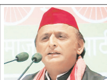
महंगाई से टूटी जनता की कम्मर: आप

शाह टाइम्स ब्यूरो लखनऊ। सपा अध्यक्ष अखिलेश यादव ने रविवार को अयोध्या के राम मंदिर में भक्तों की ओर से दिए जाने वाले चढ़ावे की करोड़ों की रकम गायब होने का संसदीय खेज बयान दिया है। उन्होंने कहा कि यह बेहद शर्मनाक है और कोई भी इस पर सफाई देने के लिए तैयार नहीं है। उन्होंने कहा कि न्यायालय को मामले में स्वतः संज्ञान लेकर जांच करनी चाहिए। उन्होंने सरकार पर भी सवाल उठाए। उन्होंने एक्स पर बयान जारी कर कहा कि समस्त विश्व में भगवान राम के उपासकों के लिए ये एक बेहद बेवैधानशील समाचार है कि 'राम मंदिर' के चढ़ावे की करोड़ों की रकम गायब पाई गई है।