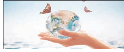
गंभीर प्रदूषण की चपेट में हैं सभी महासागर सम्पादकीय