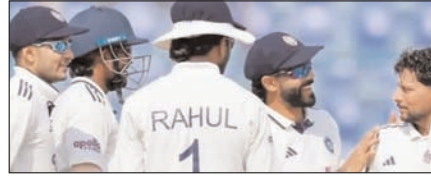
मुल्लापुर टेस्ट: भारत ने कसा अफगानिस्तान पर शिकंजा खेल टाइम्स