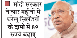
मोदी सरकार ने चार महीनों में घरेलू सिलेंडरों के दामों में 89 रुपये बढ़ाए

नई दिल्ली, वार्ता कांग्रेस अध्यक्ष मल्लिकार्जुन खड़गे ने रसोई गैस सिलेंडर के दाम बढ़ाने को लेकर सरकार को कटघरे में खड़ा करते हुए कहा है कि वह अब रसोई गैस के बढ़ाने जनता को लूट रही है और 12 साल में उसने घरेलू एलपीजी सिलेंडर की कीमतों में 530 रुपये की वृद्धि की है। खड़गे ने रविवार को सोशल मीडिया एक्स पर कहा कि मोदी सरकार ने पिछले चार महीनों में घरेलू एलपीजी सिलेंडर के दामों में 89 रुपये की बढ़ोतरी की है। संसद में प्रधानमंत्री नरेंद्र मोदी ने पश्चिम एशिया संकट के मद्देनजर 41 देशों से ईंधन विविधोकरण (फ्यूल डाइवर्सिफिकेशन) की बात कही थी, लेकिन इसके बावजूद ग्रामीण क्षेत्रों में आज भी एलपीजी की किल्लत बनी हुई है। उन्होंने सवाल किया कि 2025-26 में उज्ज्वला योजना के 5.56 करोड़ परिवारों ने केवल एक बार या एक भी बार रिकॉर्ड नहीं कराया। इनमें से 3.30 करोड़ परिवारों ने तो एक भी सिलेंडर रिकॉर्ड नहीं किया। उन्होंने पूछा कि क्या यह स्थिति सरकार की नीतियों और बढ़ती कीमतों का परिणाम नहीं है। कांग्रेस अध्यक्ष ने कहा कि भाजपा नेता और मोदी पहले महंगाई के मुद्दे पर यूपीए सरकार को घेरते थे, लेकिन अब घरेलू एलपीजी की कीमतों में लगातार वृद्धि के बावजूद भाजपा के नेता चुपकी साधे हुए हैं। उन्होंने सवाल किया कि जो नेता पहले महंगाई के विरोध में सिलेंडर लेकर सड़कों पर बैठते थे, वे अब बिरोध क्यों नहीं कर रहे हैं। खड़गे ने कहा कि बढ़ती महंगाई और रसोई गैस की ऊंची कीमतों का सबसे अधिक असर गरीब तथा मध्यम वर्गीय परिवारों पर पड़ रहा है और सरकार को इस मुद्दे पर जवाब देना चाहिए।