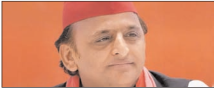
अखिलेश यादव ने राम मंदिर में चढ़ावे की रकम को लेकर उठाए गंभीर सवाल पेज 2

नई दिल्ली, मुजफ्फरनगर, देहरादून, हल्द्वानी, मुगदाबाद, बरेली, मेरठ व लखनऊ से प्रकाशित