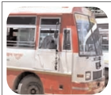
28 लाख अभ्यर्थियों के शामिल होने की संभावना