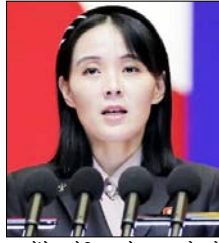
उन्होंने अमेरिका को उस दावे को भी खारिज कर दिया जिसमें कहा गया था कि अमेरिका के राष्ट्रपति ट्रंप और चीन के राष्ट्रपति शी जिनपिंग ने उत्तर कोरिया के परमाणु निरस्त्रीकरण पर सहमति जताई है। उन्होंने कहा कि अमेरिका अभी भी पुराने दौर की सोच में फंसा हुआ है। उत्तर कोरिया अब पीछे हटने वाला नहीं है और अपनी सुरक्षा के लिए परमाणु ताकत बढ़ाता रहेगा। उत्तर कोरिया

प्योंगयांग। उत्तर कोरिया ने एक बार फिर अमेरिका को खुली चुनौती देते हुए साफ कर दिया है कि वह अपने परमाणु हथियार कार्यक्रम को बंद नहीं करेगा। उत्तर कोरियाई नेता किम जोंग उन की बहन किम यों जोंग ने अमेरिका की परमाणु निरस्त्रीकरण की मांग को पुराना और अव्यावहारिक सपना बताया। उन्होंने कहा कि अमेरिका और उसके सहयोगी देशों से मिल रहे खतरे के बीच उत्तर कोरिया लगातार अपने परमाणु हथियारों को मजबूत करेगा। इस बयान ने एक बार फिर कोरियाई प्रायद्वीप में तनाव बढ़ा दिया है। किम जोंग उन की बहन और उत्तर कोरिया की वरिष्ठ नेता किम यों जोंग ने कहा कि उत्तर कोरिया को परमाणु शक्ति राष्ट्र के रूप में मान्यता मिल चुकी है और अमेरिका की तरफ से इसे बदलने की कोशिश का कोई कानूनी महत्व नहीं है।