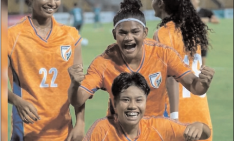
एक गोल खया। इसी बीच उपराष्ट्रपति सीपी राधाकृष्णन और प्रधानमंत्री नरेंद्र मोदी ने दक्षिण एशियाई फुटबॉल महासंघ (सैफ) महिला चैंपियनशिप 2026 जीतने पर भारतीय महिला फुटबॉल टीम को रविवार को बधाई दी। उन्होंने पूरे टूर्नामेंट में शानदार प्रदर्शन के लिए खिलाड़ियों की तारीफ की और धरोसा जताया कि उनकी यह कामयाबी और अधिक युवाओं को इस खेल से जुड़ने के लिए प्रेरित करेगी। सोशल मीडिया मंच 'एक्स' पर एक पोस्ट में प्रधानमंत्री ने टीम की इस