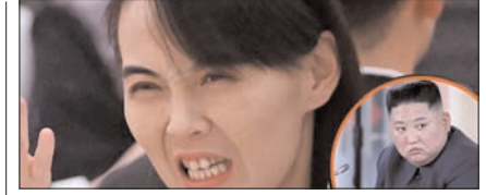
उत्तर कोरिया ने अमेरिका को दी खुली चुनौती, परमाणु हथियार नहीं छोड़ेगे पेज 12