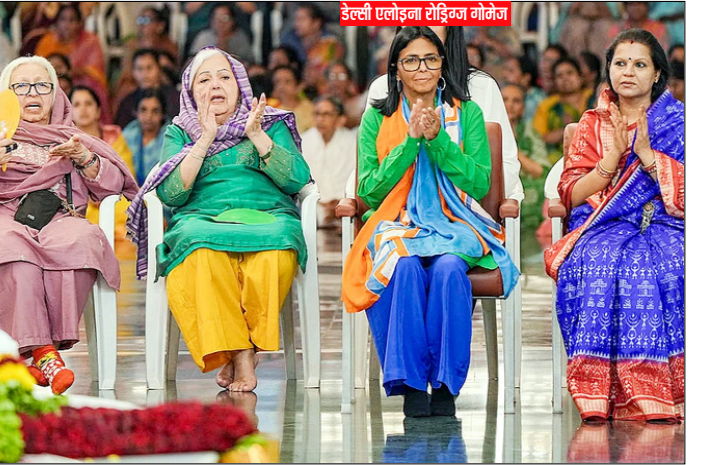
अंध प्रदेश। श्री सत्य साईं जिले में स्थित प्रशांति मिलनम के दौरे के दौरान लोगों के साथ प्रार्थना करती बोलिवेरियन गणराज्य वेनेजुएला की कार्यवाहक राष्ट्रपति डेल्ली एलोइजा रोड्रिगुज गोलोज।

हफरनन ने कहा कि ऐसा लगता है कि दो शूटर थे जो 'शायद एक-दूसरे पर गोली चला रहे थे' और उनमें से कोई भी अभी हिरासत में नहीं है। सीएनएन की रिपोर्ट के मुताबिक गोलियों की तेज आवाज सुनकर फेस्टिवल में आए लोग घबराकर ऐतिहासिक इलाके में भागने लगे। गोलीबारी से घबराई भीड़ चिल्ला रही थी और फूट डूकों तथा गोल्फ कार्ट के बीच छिपने की कोशिश कर रही थी। टोलेडो के मेयर वेड कैम्पजुकिविज ने कहा कि सभी घायलों की हालत बेहतर है।