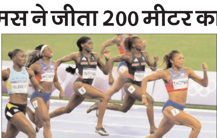
चैंपियन जूलियन अल्फ्रेड द्वारा अप्रैल में ऑस्टिन, टेक्सास में बनाए गए 21-86 सेकंड के 2026 के पिछले वर्ल्ड बेस्ट समय को पीछे छोड़ दिया। उन्होंने इस साल की शुरुआत में 'नैरोबी डक-न्यात्रा और अदीस अबाबा डर्इथियोपिया' में भी 200 मीटर

फेवर ओफिली 22-15 सेकंड के साथ तीसरे स्थान पर रहीं। मुक. इबले जीतने के बाद थॉमस ने कहा, 'मैं इस समय को देखकर थोड़ी हैरान हूँ, लेकिन मैं कड़ा अभ्यास कर रही हूँ। अफ्रीका की मेरा दूर बहुत अच्छा रहा, और अब मेरी कड़ी मेहनत का फल मिल रहा है। मैं इस 'ऑफ' ईयर (बिना बड़े टूर्नामेंट वाले साल) का आनंद ले रही हूँ क्योंकि इसमें ओलंपिक या वर्ल्ड चैंपियनशिप का कोई दबाव नहीं है, इसलिए मैं बस इस सीजन का मजा ले रही हूँ। थॉमस ने सेंट लूसिया की मौजूदा ओलंपिक 100 मीटर