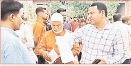
राजस्व विभाग व नगर पालिका की संयुक्त कार्रवाई

शाह टाइम्स संवाददाता स्योहारा। सरकारी भूमि को अतिक्रमण मुक्त कराने के लिए राजस्व विभाग और नगर पालिका की संयुक्त टीम ने कार्रवाई करते हुए कब्रिस्तान के रूप में दर्ज सरकारी संपत्ति से अवैध कब्जा हटाया। कार्रवाई के दौरान अधिकारियों ने भूमि की पैमाइश कर अभिलेखों का मिलान किया तथा अवैध निर्माण को हटाने की कार्रवाई कराई।