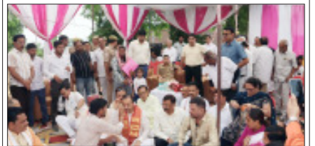
सम्भल- दंगा पीड़ित को अवासीय पट्टा देने से पूर्व हवन पूजन करते राण्यमंत्री।