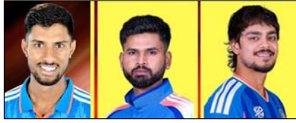
सूर्यकुमार की कप्तानी लेने की दौड़ में श्रेयस अय्यर, ईशान किशन व तिलक वर्मा खेल टाइम्स