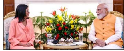
भारत और वेनेजुएला द्विपक्षीय साझेदारी को मजबूत बनाएंगे