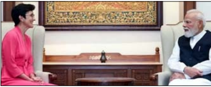
अपने परिचालन के 125 साल पूरे करने जा रहा है। सिटी बैंक की ओर से गुरुवार को हुई इस मुलाकात पर जारी एक विज्ञापित में कहा गया है कि

नई दिल्ली। वैश्विक स्तर पर काम करने वाले अमेरिका के प्रसिद्ध बैंकिंग संस्थान सिटी बैंक के संचालक मंडल की प्रमुख और मुख्य अधिशासी अधिकारी (सीईओ) जेन फ्रेजर ने यहां प्रधानमंत्री नरेंद्र मोदी से मुलाकात की और भारत के आर्थिक विकास में सहयोग देने की अपनी कंपनी की प्रतिबद्धता को दोहराया। सिटी अगले वर्ष भारत में