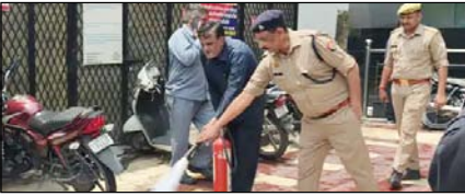
दिल्ली में होटल अग्निकांडके बाद यूपी में अलर्ट जारी

नई दिल्ली, मुजफ्फरनगर, देहरादून, हल्द्वानी, मुरादाबाद, बरेली, मेरठ व लखनऊ से प्रकाशित