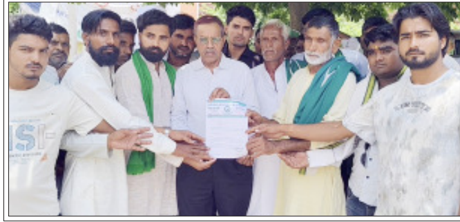
सम्भला भारत अमेरिका मुक्त समझौते के विरोध में राष्ट्रपति के नाम ज्ञापन देते किसान।

कर्मचारी बनवाया और घरों पर काम कराया, मौका देखते ही उसको पकका कराकर सरकारी कर्मचारी का दर्जा दिलवा दिया। पूर्ववर्ती सरकारी में नियुक्तियों में चले इसे खेले में एक नहीं, बल्कि निज स्वार्थ की खातिर किये गए खेल में शामिल कई अफसरों के नाम भी सामने आ सकते हैं चर्चा है बरसों पूर्व में तहसीलदार के अर्दली पुत्र को भी नगर के कॉलेज में फ़ैरे ही नियुक्ति दिलायी गयी थी।