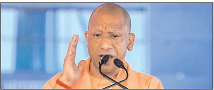
आमजन की समस्याओं का समयबद्ध निस्तारण हो: मुख्यमंत्री योगी

नई दिल्ली, मुजफ्फरनगर, देहरादून, हल्द्वानी, मुरादाबाद, बरेली, मेरठ व लखनऊ से प्रकाशित