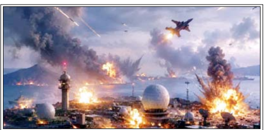
अमेरिकी लड़ाकू विमानों ने ईरान की हवाई रक्षा प्रणालियों, एक ग्राउंड कंट्रोल स्टेशन और दो हमलावर ड्रोन को नष्ट कर दिया

अमेरिका और ईरान के बीच सप्ताहात में हुए इस ताजा सैन्य टकराव के बीच, परदे के पीछे राजनीतिक प्रयास भी जारी हैं ताकि एक व्यापक समझौता किया जा सके और ईरान के परमाणु कार्यक्रम पर नए सिरे से बातचीत की रूपरेखा तैयार की जा सके। यूएस सेंट्रल कमांड (सेंटकॉम) ने कहा कि उसने 'ईरान की आक्रामक कार्रवाइयों' के जवाब में शनिवार और रविवार को ईरानी सैन्य ठिकानों के खिलाफ 'आत्मरक्षा में हमले' किए। इस कार्रवाई के तहत दक्षिणी ईरान में रडार प्रणालियों और ड्रोन कमांड-एंड-कंट्रोल केंद्रों को निशाना बनाया गया। यह कार्रवाई ईरान द्वारा अंतर्राष्ट्रीय जलक्षेत्र के ऊपर उड़ान भर रहे एक अमेरिकी एमब्यू-1 ड्रोन को मार गिराए जाने के कथित दावे के