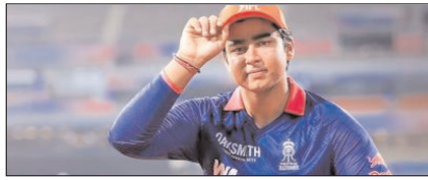
सूर्यवंशी ने जीते ऑरेंज कैप, एमवीपी और इमर्जिंग प्लेयर अवार्ड