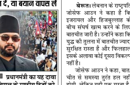
प्रधानमंत्री का यह दावा नेपाल के राष्ट्रीय हितों को नुकसान पहुंचाने वाला है

काठमांडू। नेपाल के प्रधानमंत्री बालेन शाह ने रविवार को कहा था कि सिर्फ भारत ने ही नेपाली जमीन पर कब्जा नहीं किया, बल्कि नेपाल ने भी कुछ भारतीय इलाकों पर कब्जा किया है। इस बयान का आज नेपाल की संसद में जमकर विरोध हुआ, विपक्षी दलों ने बालेन शाह से भारत से जुड़े इस विवादित दावे पर जवाब मांगा।