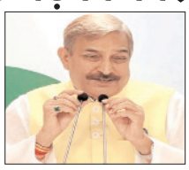
राज्यसभा उपनेता और पार्टी सांसद प्रमोद तिवारी ने कहा- जनता की जेब पर डाका

नई दिल्ली, वार्ता कर्मश्रियल एलपीजी सिलेंडर की कीमतों में एक बार फिर बढ़ोतरी होने के बाद कांग्रेस के राज्यसभा उपनेता और सांसद प्रमोद तिवारी ने केंद्र सरकार पर जनता की जेब पर डाका डालने का आरोप लगाते हुए कहा है कि एक तरफ प्रधानमंत्री मन की बात करते हैं, वहीं दूसरी तरफ उनकी सरकार गैस सिलेंडर के दाम बढ़ाकर आम लोगों पर आर्थिक बोझ डाल रही है। तिवारी ने सोमवार को कहा कि 19 किलो वाले कर्मश्रियल एलपीजी सिलेंडर की कीमत में 42 रुपये की वृद्धि कर दी गई है। इसके बाद दिल्ली में इसकी कीमत 3113.50 रुपये और कोल. काला में 3255.50 रुपये पहुंच गई है। उन्होंने यह भी कहा कि 5 किलो वाले छोटे सिलेंडर के दाम में 11 रुपये की बढ़ोतरी की गई है, जिससे छात्रों, मजदूरों और छोटे कारोबारियों पर सीधा असर पड़ेगा। कांग्रेस नेता ने कहा कि जनवरी से जून के बीच 19 किलो वाले कर्मश्रियल सिलेंडर की कीमत में कुल 1560 रुपये और 5 किलो वाले सिलेंडर की कीमत में 323 रुपये की बढ़ोतरी हुई है। उन्होंने इसे लूट का सिलसिला बताते हुए कहा कि सरकार लगातार जनता पर महंगाई का बोझ डाल रही है। श्री तिवारी ने कहा कि अंतर्राष्ट्रीय बाजार में कच्चे तेल की कीमतें 116 डॉलर प्रति बैरल से घटकर 92 डॉलर प्रति बैरल के आसपास आ गई हैं, इसके बावजूद एलपीजी के दाम बढ़ाए जा रहे हैं। उन्होंने आरोप लगाया कि सरकार आम जनता की जेब काट रही है और लोग इस स्थिति को भली-भांति समझ रहे हैं। उल्लेखनीय है कि गैस कंपनियों ने 1 जून से 19 किलो वाले कर्मश्रियल एलपीजी सिलेंडर की कीमत में 42 रुपये की बढ़ोतरी की है। इससे पहले 1 मई को भी कर्मश्रियल सिलेंडरों के दाम बढ़ाए गए थे।