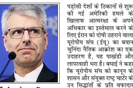
ईरान ऐसा नहीं मानता कि केवल सुरक्षा परिषद का प्रस्ताव ही समझौते के लागू होने की गारंटी होगा