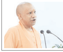
अनावश्यक विलंब होने पर संबंधित अधिकारियों की जवाबदेही भी तय की जाए: मुख्यमंत्री

शाह टाइम्स ब्यूरो लखनऊ। उत्तर प्रदेश के मुख्यमंत्री योगी आदित्यनाथ ने सोमवार को आयोजित जनता दर्शन में प्रदेश के विभिन्न जिलों से आए लोगों की समस्याएं सुनीं और संबंधित अधिकारियों को त्वरित एवं प्रभावी कार्रवाई के निर्देश दिए। उन्होंने कहा कि आमजन की समस्याओं का समयबद्ध निस्तारण सुनिश्चित किया जाए तथा अनावश्यक विलंब होने पर संबंधित अधिकारियों की जवाबदेही भी तय की जाए। जनता दर्शन के दौरान मुख्यमंत्री के समक्ष राज्य और पुलिस विभाग से जुड़े कई प्रकरण प्रस्तुत किए गए। मुख्यमंत्री ने अधिकारियों को निर्देशित किया कि लॉबिंग राजस्व वार्ता का निर्धारित समय सीमा के भीतर निस्तारण किया जाए। छह अनावश्यक विलंब होने पर संबंधित अधिकारियों की जवाबदेही भी तय की जाए। माह से अधिक समय से लॉबिंग मामलों की विशेष समीक्षा की जाए और बिना उचित कारण विलंब पाए जाने पर संबंधित अधिकारियों के विरुद्ध कार्रवाई सुनिश्चित की जाए। मुख्यमंत्री ने कहा कि सरकार की प्राथमिकता है कि प्रत्येक जरूरतमंद व्यक्ति को न्याय मिले और पात्र लोगों तक सरकारी योजनाओं का लाभ बिना किसी भेदभाव के पहुंचे। उन्होंने अधिकारियों से संवेदनशीलता के साथ कार्य करते हुए जरूरतमंदों के उपचार, सहायता और समस्याओं के समाधान को प्राथमिकता देने को कहा। उन्होंने कहा कि जरूरतमंद लोगों के चेहरे पर खुशहाली लाना शासन-प्रशासन का दायित्व है। जनता दर्शन के दौरान हापड़ से आई एक छात्रा ने अपने परिवार को आर्थिक स्थिति और पढ़ाई में आने वाली कठिनाइयों का जिक्र किया। मुख्यमंत्री ने छात्रा से उसकी पढ़ाई के बारे में जानकरी ली। छात्रा द्वारा कक्षा सात में अध्ययनरत होने की जानकारी देने पर मुख्यमंत्री ने उसे आवश्यक