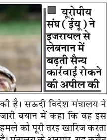
यूरोपीय संघ (ईयू) ने इजरायल से लेबनान में बढ़ती सैन्य कार्रवाई रोकने की अपील की

बेरूत। लेबनान के राष्ट्रपति जोसेफ आउन ने कहा है कि इजरायल और हिजबुल्लाह के बीच संघर्ष खत्म करने के लिए बातचीत जारी है। उन्होंने कहा कि युद्ध की तुलना में बातचीत ज्यादा सुरक्षित रास्ता है और फिलहाल इसके अलावा कोई दूसरा विकल्प नहीं है।