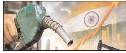
महंगाई की मार झेलता आम आदमी, मजे में जिदगी जीता एक वर्ग!