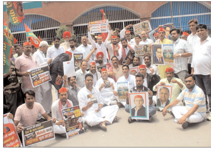
कलेक्ट्रेट पर हंगामा करते सपा कार्यकर्ता।

प्रदर्शन का सबसे चर्चित पहलू रहा सांकेतिक विरोध। कार्यकर्ताओं ने ईंधन की कीमतों में वृद्धि से आम आदमी पर बढ़ते बोझ को दर्शाने के लिए एक कार को रस्सियों से बांधकर कलेक्ट्रेट तक खींचा। इस दौरान 'महंगाई वापस लो', 'भाजपा सरकार हारा में आओ' के नारे गुंजते