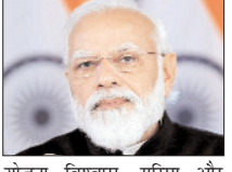
योजना विश्वास, गरिमा और सशक्तिकरण के बारे में है। सभी लाभार्थियों को मेरी शुभकामनाएं, जिनका दुःख संकल्प और उद्यम हमारे देश की अर्थव्यवस्था को मजबूत करना जारी रखता है। केंद्र सरकार द्वारा जून 2020 में कोविड महामारी के बीच शुरू की गई, पीएम स्वनिधि को उन रेहड़ी पटरी वालों को आर्थिक सहायता प्रदान करने के लिए डिज़ाइन किया गया था जिनका आजीविका लॉकडाउन और आर्थिक व्यवधानों से गंभीर रूप से प्रभावित हुई थी। यह योजना पात्र विक्रेताओं को बिना किसी गारंटी के कार्यशील पूंजी ऋण प्राप्त

नई दिल्ली। प्रधानमंत्री नरेंद्र मोदी ने सोमवार को प्रधानमंत्री स्ट्रीट वेंडर्स आत्मनिर्भर निधि (पीएम स्वनिधि) योजना के छह साल पूरे होने पर इसके प्रभाव का उल्लेख करते हुए कहा कि इस पहल ने बिना गारंटी ऋण, वित्तीय समावेशन और विकास के अवसर प्रदान कर अनगिनत रेहड़ी पटरी वालों को जीवन को बदल दिया है। प्रधानमंत्री ने सोशल मीडिया प्लेटफॉर्म एक्स पर एक पोस्ट में, योजना के लाभार्थियों को शुभकामनाएं दीं और देश की अर्थव्यवस्था में उनके योगदान की सराहना की। श्री मोदी ने कहा, 'छात्र हम पीएम स्वनिधि योजना के छह वर्ष पूरे कर रहे हैं, जिसने बिना गारंटी ऋण, वित्तीय समावेशन और विकास के नए अवसरों तक पहुंच सुनिश्चित करके अनगिनत रेहड़ी पटरी वालों को जीवन को बदल दिया है। यह