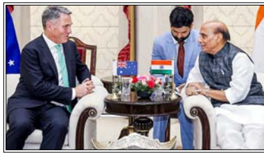
रक्षा मंत्री राजनाथ सिंह और ऑस्ट्रेलिया के रक्षा मंत्री रिचर्ड मार्ल्स ने सोमवार को यहाँ दूसरे भारत व ऑस्ट्रेलिया रक्षा मंत्री संवाद की सह अध्यक्षता की

नई दिल्ली। भारत और ऑस्ट्रेलिया ने अपनी रणनीतिक रक्षा साझेदारी को मजबूती से आगे बढ़ाते हुए समुद्री सुरक्षा, रक्षा उद्योग, परस्पर सैन्य संचालन क्षमता और उभरती प्रौद्योगिकियों के क्षेत्रों में सहयोग बढ़ाने पर सहमति व्यक्त की है। दोनों देशों ने हिन्द-प्रशांत क्षेत्र में सुरक्षा और स्थिरता को मजबूत करने की अपनी प्रतिबद्धता दोहराई।