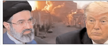
अमेरिका ने ईरान की रडार-ड्रोन कंट्रोल साइट्स पर किया हमला