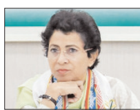
राहत तथा फसलों के लिए लाभकारी न्यूनतम समर्थन मूल्य (एएसपी) सुनिश्चित करना आवश्यक है। उन्होंने केंद्र सरकार से उर्वरकों की बढ़ती हुई कीमतों वापस लेने और किसानों के लिए विशेष राहत पैकेज की घोषणा करने की मांग की। वह कांग्रेस किसानों के हितों से जुड़े मुद्दों को उठाती रही हैं और आगे भी किसानों के अधिकारों के लिए आवाज उठाती रहेंगी।

चंडीगढ़, वार्ता हरियाणा में सिरसा सीट से सांसद कुमारी सैलजा ने आरोप लगाया कि केंद्र की भाजपा सरकार की नीतियों के कारण खेती किसानों के लिए घाटे का सौदा बनती जा रही है। उन्होंने कहा कि किसानों की आय दोगुनी करने का वादा पुरा नहीं हुआ, जबकि खाद, बीज, कीटनाशक, डीजल और कृषि उपकरणों की कीमतों में लगातार वृद्धि से खेती की लागत बढ़ी है। कुमारी सैलजा ने यहां एक बयान में कहा कि हाल ही में एनपीके और पोटाश जैसे उर्वरकों की कीमतों में बढ़ोतरी से किसानों पर अतिरिक्त आर्थिक बोझ पड़ा है। उनके अनुसार खेती के लिए आवश्यक संसाधनों के महंगे होने से किसानों की परिस्थितियां बर्दाश्त हैं। उन्होंने कहा कि किसानों को राहत देने के लिए कृषि आदानों की कीमतों पर नियंत्रण, डीजल पर