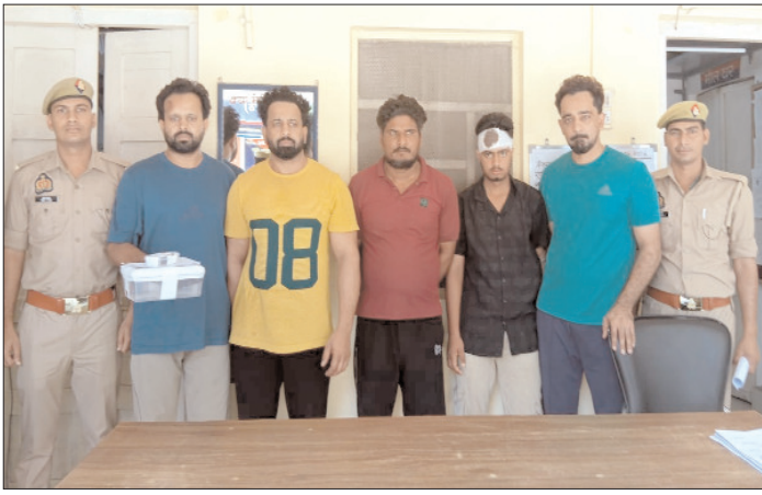
पुलिस हिरासत में आरोपी।