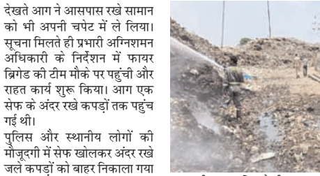
आग की सूचना मिलते ही दमकल विभाग की टीम मौके पर पहुंची और अग्नि सुरक्षा उपायों के प्रति जागरूक भी किया गया। विभाग ने नागरिकों से अपील की है कि गर्मी के मौसम में बिजली के उपकरणों का उपयोग सावधानीपूर्वक करें तथा किसी भी आपात स्थिति में तुरंत फायर सर्विस को सूचना दें।

शाह टाइम्स संवाददाता हापुड़। मंगलवार को शहर और उसके आसपास के क्षेत्र में आग लगने की दो अलग-अलग घटनाओं ने लोगों को निता में डाल दिया। एक ओर प्रीत विहार की द्वारिका धाम कॉलोनी में मकान की दूसरी मंजिल पर आग लगने से घरेलू सामान जलकर राख हो गया, वहीं दूसरी ओर रामपुर रोड स्थित डॉपिंग ग्राउंड में कबाड़ के ढेर में आग भड़क उठी। दोनों घटनाओं में दमकल विभाग की मुस्लेदी के चलते आग पर समय रहते नियंत्रण पा लिया गया और किसी प्रकार की जनहानि नहीं हुई।