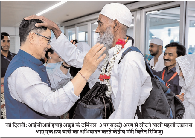
नई दिल्ली: आईजीआई हवाई अड्डे के टर्मिनल-3 पर सऊदी अरब से लौटने वाली पहली उड़ान से आए एक हज यात्री का अभिवादन करते केंद्रीय मंत्री किरन रिजजु।

प्रधानमंत्री रिसर्च चेर योजना के लिए आवेदन शुरू नई दिल्ली। शिक्षा मंत्रालय के उच्च शिक्षा विभाग की ओर से प्रधानमंत्री रिसर्च चेर (पीएमआरसी) योजना 2026 के लिए आवेदन शुरू हो गए हैं। शिक्षा मंत्रालय ने मंगलवार को बताया कि पीएमआरसी केंद्र सरकार की एक प्रमुख राष्ट्रीय पहल है जिसका उद्देश्य दुनिया भर में कार्यरत भारतीय मूल के उत्कृष्ट शोधकर्ताओं, वैज्ञानिकों, तकनीकी विशेषज्ञों और पेशेवरों को भारत के शीर्ष उच्च शिक्षण संस्थानों, राष्ट्रीय प्रयोगशालाओं और अनुसंधान केंद्रों से जोड़ना है।