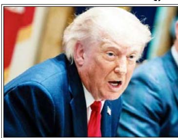
नेतन्याहू ने सेना को लेबनान में अपने जमीनी अभियान का विस्तार करने का निर्देश दिया है। इजरायल ने नबातिएह शहर के निकट एक रणनीतिक पहाड़ी पर स्थित ऐतिहासिक व्यूफोर्ट किले पर भी कब्जा कर लिया है।

इजरायल के पीएम नेतन्याहू को फोन कर फटकार लगाई, कहा- पागल हो गए हो क्या, तुरंत ये सब रोको