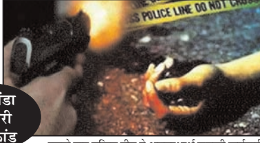
बिलसंडा व्यापारी हत्याकांड

मामले में अब तक तीन साजिशकर्ताओं और चार हमलावरों समेत सात आरोपी दबोचे