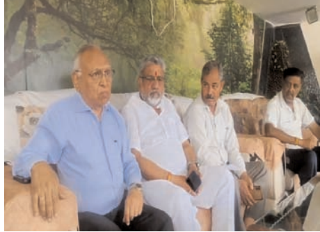
निगरानी व्यवस्था को निष्क्रिय करने के लिए सीसीटीवी कैमरों को क्षतिग्रस्त कर दिया और रिकॉर्डिंग सिस्टम भी अपने साथ ले गए। परिवार ने बताया कि बदमाशों ने भागने के लिए कार का उपयोग करने की कोशिश की थी, लेकिन कार स्टार्ट नहीं होने पर वे बाइक

लेकर निकल गए। उनके जाने के बाद परिवार ने पुलिस को सूचना दी। घटना की जानकारी मिलते ही पुलिस के आला अधिकारी मौके पर पहुंचे और जांच शुरू कर दी। फॉरेंसिक टीम ने भी घटनास्थल से साक्ष्य जुटाए। पुलिस आसपास के सीसीटीवी कैमरों की फुटेज और मोबाइल सर्विलांस की मदद से बदमाशों की तलाश कर रही है। पुलिस अधिकारियों का कहना है कि घटना के खुलासे के लिए विशेष टीमें लगाई गई हैं। प्रारंभिक जांच में कुछ अहम सुराग मिले हैं, जिनके आधार पर कार्रवाई की जा रही है। वहीं, शहर के व्यापारिक वर्ग ने इस घटना पर चिंता व्यक्त करते हुए सुरक्षा व्यवस्था और मजबूत किए जाने की मांग की है।