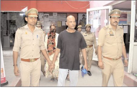
लालकुर्ती पुलिस ने मां, पत्नी, बहन व भाई को हिरासत में लिया

शाह टाइम्स संवाददाता मेरठ। लालकुर्ती थाना क्षेत्र के घोसी मोहल्ला में पुलिस टीम पर