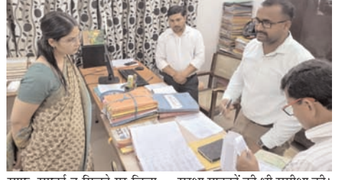
साफ-सफाई न मिलने पर जिलाधिकारी ने नाराजगी जताते हुए नजारात नाज़िर को तत्काल व्यवस्था सुधारने के निर्देश दिए। वहीं रिकॉर्ड रूप में शासनादेशों का रिकॉर्ड अपडेट न पाए जाने पर संबंधित कर्मचारियों को फटकार लगाई गई और सभी अभिलेखों को व्यवस्थित एवं अद्यतन रखने को कहा गया। निरीक्षण के दौरान जिलाधिकारी ने

शाह टाइम्स संवाददाता हापुड़। जिलाधिकारी कविता मीना ने मंगलवार को कलेक्ट्रेट परिसर का औचक निरीक्षण कर कार्यालयी व्यवस्थाओं की हकीकत परखी। निरीक्षण के दौरान कई विभागों में साफ-सफाई की कमी और अभिलेखों के अद्यतन न होने जैसी खामियां सामने आने पर संबंधित अधिकारियों एवं कर्मचारियों को कड़ी चेतावनी दी गई।