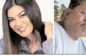
सुष्मिता को अपनी लाइफ के सबसे जरूरी लोगों में से एक बताया और खुलासा किया कि उनके ब्रेकअप में दूरी ने अहम भूमिका निभाई थी। लंदन में रहने वाले इस कारोबारी के अनुसार, दोनों के बीच कोई ड्रामेटिक ब्रेकअप नहीं हुआ था। बल्कि, धीरे-धीरे