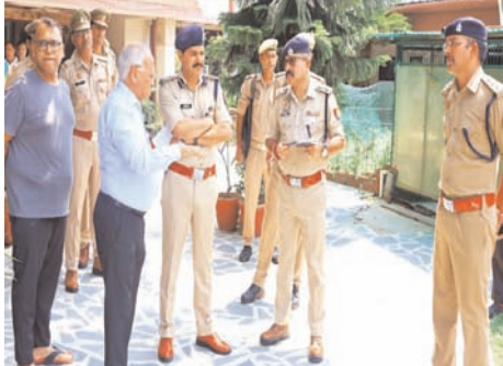
बदमाशों ने परिवार के अन्य सदस्यों को भी धमकाकर एक जगह बैठा दिया। इसके बाद आरोपितों ने पूरे मकान की तलाशी ली। अलमरियों और लॉकरों में रखे सोने के आभूषण तथा नकदी समेट ली। वारदात के दौरान बदमाश बेहद सतर्क दिखाई दिए। उन्होंने घर की

शाह टाइम्स संवाददाता हापुड़। शहर के पॉश क्षेत्र गढ़ रोड में सोमवार रात हथियारबंद बदमाशों ने एक उद्योगपति के घर धावा बोल कर परिवार को बंधक बना लिया और लाखों की संपत्ति लूटकर फरार हो गए। करीब तीन-चौथाई घंटे तक चली इस वारदात से इलाके में दहशत फैल गई। पुलिस ने मामले की जांच के लिए कई टीमों गठित कर दी हैं।