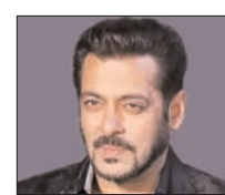
आरोप लगाया: फिल्म से उनके व्यक्तित्व संबंधी अधिकारों का घोर उल्लंघन हुआ