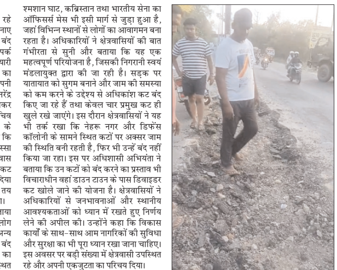
कसेरुखेड़ा कट बंद करने के विरोध में अधिकारियों से मिले क्षेत्रवासी, जनहित में निर्णय लेने की करी मांग

शमशान घाट, कब्रिस्तान तथा भारतीय सेना का ऑफिसर्स मैसे भी इसी मार्ग से जुड़ा हुआ है, जहां विभिन्न स्थानों से लोगों का आवागमन बना रहता है। अधिकारियों ने क्षेत्रवासियों की बात गंभीरता से सुनी और बताया कि यह एक महत्वपूर्ण परिवोजना है, जिसकी निगरानी स्वयं मंडलायुक्त द्वारा की जा रही है। सड़क पर यातायात को सुगम बनाने और जाम की समस्या को कम करने के उद्देश्य से अधिकारियों कट बंद किए जा रहे हैं तथा केवल चार प्रमुख कट ही खुले रखे जाएंगे। इस दौरान क्षेत्रवासियों ने यह भी तर्क रखा कि नेहरू नगर और डिफेंस कॉलोनी के सामने स्थित कटों पर अक्सर जाम की स्थिति बनी रहती है, फिर भी उन्हें बंद नहीं किया जा रहा। इस पर अधिशासी अभियंता ने बताया कि उन कटों को बंद करने का प्रस्ताव भी विचाराधीन वहां डाउन टाउन के पास डिवाइडर कट खोले जाने की योजना है। क्षेत्रवासियों ने अधिकारियों से जनभावनाओं और स्थानीय आवश्यकताओं को ध्यान में रखते हुए निर्णय लेने की अपील की। उन्होंने कहा कि विकास कार्यों के साथ-साथ आम नागरिकों की सुविधा और सुरक्षा का भी पूरा ध्यान रखा जाना चाहिए। इस अवसर पर बड़ी संख्या में क्षेत्रवासी उपस्थित रहे और अपनी एकजुटता का परिचय दिया।