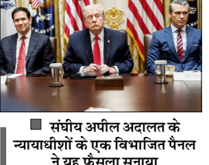
संघीय अपील अदालत के न्यायाधीशों के एक विभाजित पैनल ने यह फैसला सुनाया