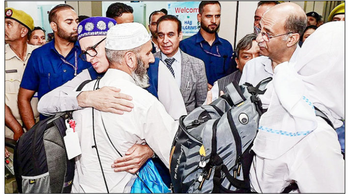
श्रीनगर। हवाई अड्डे पर मक्का से आने वाले हज यात्रियों के पहले जट्टे का स्वागत करते जम्मू-कश्मीर के मुख्यमंत्री उमर अब्दुल्ला।

नई दिल्ली। दक्षिण अफ्रीका के उपराष्ट्रपति शिपोकोसा पॉलुस माशातिले ने मंगलवार को यहां उपराष्ट्रपति सीपी राधाकृष्णन से मुलाकात की और द्विपक्षीय संबंधों को और मजबूत बनाने की प्रतिबद्धता जताई। दोनों नेताओं ने भारत-दक्षिण अफ्रीका द्विपक्षीय संबंधों को और सुदृढ़ बनाने पर सार्थक चर्चा की, जिसमें व्यापार, निवेश, रक्षा सहयोग, कौशल विकास तथा जन-से-जन संबंधों को मजबूत करने पर विशेष ध्यान दिया गया। उन्होंने विकासशील देशों की प्राथमिकताओं को आगे बढ़ाने तथा ब्रिक्स, जी-20, इन्फ्रा और हिंद महासागर तटीय संघ जैसे बहुपक्षीय मंचों में सहयोग बढ़ाने पर भी विचारों का आदान-प्रदान किया। दोनों नेताओं ने द्विपक्षीय आर्थिक संबंधों की पूर्ण क्षमता का उपयोग करने के उपायों पर चर्चा की।