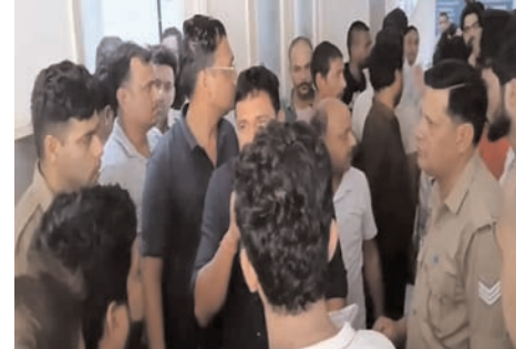
जानकारी के अनुसार, प्रसव के लिए भर्ती कराई गई महिला का ऑपरेशन कर चिकित्सकों ने बच्चे का जन्म कराया था। परिजनों के मुताबिक जन्म के बाद नवजात की तबीयत बिगड़ने लगी और उसे विशेष चिकित्सकीय निगरानी में रखा गया। परिवार का आरोप है कि हालत गंभीर होने के बावजूद बच्चे

शाह टाइम्स संवाददाता हापुड़। शहर के गढ़ रोड स्थित एक निजी अस्पताल में नवजात शिशु की मौत के बाद मंगलवार को माहौल तनावपूर्ण हो गया। शोक-काल परिजनों ने अस्पताल प्रशासन पर समय रहते उचित निर्णय न लेने का आरोप लगाते हुए जमकर विरोध प्रदर्शन किया। घटना की सूचना पर पहुंची पुलिस ने स्थिति को नियंत्रित किया।