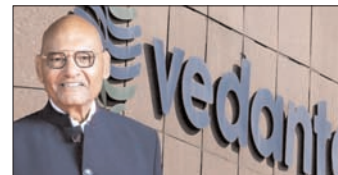
गई सभी जानकारी उपलब्ध करा रहे हैं। कंपनी सभी लागू कानूनों और नियमों का पालन करने के लिए प्रतिबद्ध है। चूंकि यह मामला अभी नियामक प्रक्रिया के अधीन है, इसलिए हम इस स्तर पर आगे कोई टिप्पणी करने में असमर्थ हैं। यह कार्रवाई ऐसे समय में हुई है जब कंपनी अपने कारोबार को चार नई

शाह टाइम्स ब्यूरो नई दिल्ली। प्रवर्तन निदेशालय (ईडी) ने विदेशी मुद्रा प्रबंधन अधिनियम (फंमा) के नियमों के कथित उल्लंघन के मामले में मंगलवार को अनिल अग्रवाल के नेतृत्व वाले वेदांता समूह के परिसरों पर छापेमारी की। यह छापेमारी वेदांता द्वारा अपनी मुख्य कंपनी वेदांता रिसोर्सेज को किए गए रॉयल्टी भुगतान की जांच के सिलसिले में समूह के मुंबई और दिल्ली स्थित कार्यालयों पर की जा रही है। इस मामले पर वेदांता के प्रवक्ता ने कहा कि हम अधिकारियों को पूरा सहयोग दे रहे हैं और मांगी