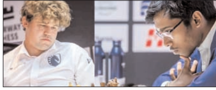
प्रज्ञानंद ने कार्लसन पर दूसरी जीत के साथ इतिहास रचा खेल टाइम्स