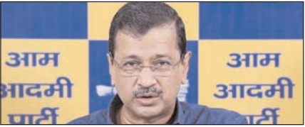
देश में कभी सोना नहीं बेचा गया : केजरीवाल पेज 2

नई दिल्ली, मुजफ्फरनगर, देहरादून, हल्द्वानी, मुगदाबाद, बरेली, मेरठ व लखनऊ से प्रकाशित