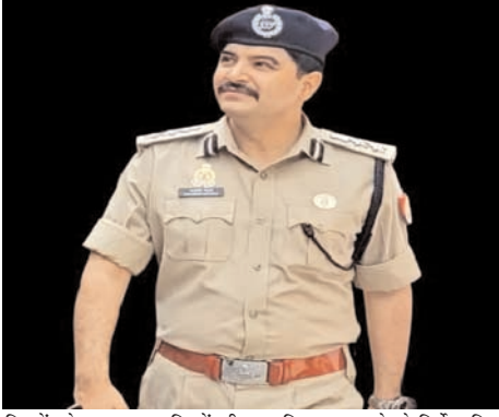
जिलों को फरार अपराधियों की गिरफ्तारी के लिए विशेष अभियान चलाने के निर्देश दिए गए थे, जिसके सकारात्मक