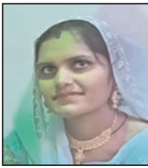
पिता की तहरीर पर पति समेत पांच के खिलाफ मुकदमा दर्ज