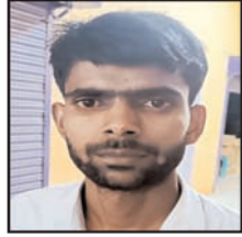
पुलिस बदमाशों की तलाश में कर रही कांभिंग

शाह टाइम्स संवाददाता, गजरोला। नगर के हसनपुर रोड स्थित एक दुग्ध फ्रैक्ट्री के सुपरवाइजर के साथ घर लौटते समय तीन बदमाशों ने तमंचे की नोक पर लूटपाट की घटना को अंजाम दिया। बदमाश सुपरवाइजर की बाइक, मोबाइल व 24 हजार रुपये की नकदी लूटकर फरार हो गए।