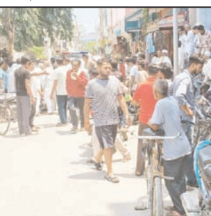
शाह टाइम्स संवाददाता गंगोह। यूरिया खाद लेने आए दो पक्षों में वाहन को आगे पीछे लगाने को लेकर कहासुनी इतनी हो गई कि कुछ ही देर में वह मारपीट में बदल गई। पुलिस भी मौके पर पहुंच गई लेकिन तब तक