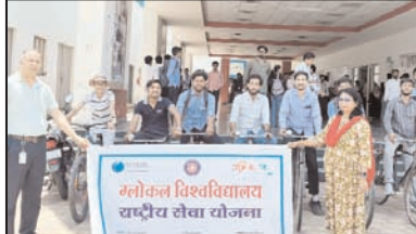
प्रतिरोधक क्षमता बढ़ती है तथा मानसिक तनाव में कमी आती है। साथ ही, साइकिल का उपयोग प्रदूषण एवं डीजल पर निर्भरता कम कर पर्यावरण संरक्षण में महत्वपूर्ण योगदान देता है। रैली के माध्यम से विद्यार्थियों को स्वस्थ जीवनशैली अपनाने, प्रदूषण कम करने तथा सामा. जिक उत्तरदायित्व के प्रति जागरूक रहने का संदेश दिया गया। प्रतिभागियों ने भवस्थ युवा, सशक्त भारत तथा धरति पर्यावरण, सुरक्षित भविष्य जैसे