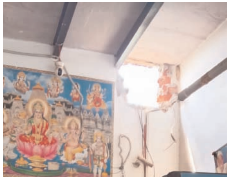
ऊपरी हिस्से में संध लगाकर अंदर प्रवेश किया और आराम से चोरी की वारदात को अंजाम दिया। चोर दुकान में रखी करीब 15 हजार

शाह टाइम्स संवाददाता पिलखुवा। मोनाड यूनिवर्सिटी के सामने स्थित एक कन्फेक्शनरी दुकान में मंगलवार रात चोरों ने फिल्मी अंदाज में चोरी की वारदात को अंजाम दिया। बदमाश दुकान की दीवार काटकर अंदर दाखिल हुए और नकदी, सिगरेट, प्रिंटर तथा अन्य सामान लेकर फरार हो गए। सुबह घटना की जानकारी मिलने पर क्षेत्र में हड़कंप मच गया। पुलिस ने मामला दर्ज कर जांच शुरू कर दी है।