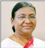
-द्रौपदी मुर्मू, राष्ट्रपति

जनजातियों के समग्र विकास और सरकार की योजनाएँ उन तक सुचारु रूप से पहुंचाने के लिए अधिकारियों को उनके पास जाकर उनकी समस्याओं को समझना होगा, अधिकारी गांव-गांव जाकर आदिवासियों से मिलें और उनके साथ घुल-मिलकर उनकी समस्याओं को समझें, तभी वे वास्तविकताओं से अवगत हो सकेंगे, इसके बाद ही आदिवासियों के समग्र विकास की योजनाएँ शासन स्तर पर बनाई जा सकेंगी, आदिवासी खुलकर अपनी दिक्कतों और समस्याओं लोगों से बताते नहीं हैं, उनके साथ घुल-मिलकर ही उनकी दुश्वारियों समझी जा सकती हैं आदिवासी बहुत आत्मसम्मान से जीते हैं, उनके पास धन नहीं होगा, उनके पास खाने को कुछ नहीं होगा, लेकिन वे आत्मसम्मान से समझौता नहीं करेंगे।