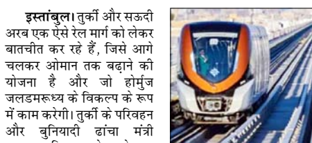
इस्तांबुल। तुर्की और सऊदी अरब एक ऐसे रेल मार्ग को लेकर बातचीत कर रहे हैं, जिससे आगे चलकर ओमान तक बढ़ाने की योजना है और जो होमरुज जलडमरूमध्य के विकल्प के रूप में काम करेगी। तुर्की के परिवहन और बुनियादी ढांचा मंत्री अब्दुलकादिर उरालोग्लू ने एक समाचार एजेंसी को बताया कि यह रेल मार्ग काली हद तक हिजाज रेलवे के रास्ते पर आधारित है।

उन्होंने कहा कि पहले चरण में तुर्की की सीमा से सीरिया के अलेप्पो तक रेल पट्टी का निर्माण करना जरूरी है। वहां से दमिश्क तक का एक हिस्सा पहले से ही बना हुआ है-जॉर्डन और सऊदी अरब की सीमा काली हिस्से पर कोई रेलवे नहीं है, हम अभी सऊदी अरब के साथ इसका रास्ते पर चर्चा कर रहे हैं कि यह रास्ता रियाद की ओर मुड़ेगा या इसे हिजाज तक लाया जाएगा। हमारा अंतिम लक्ष्य ओमान तक रेल मार्ग बनाना है। वास्तव में, हम होमरुज जलडमरूमध्य से बचे रहकर निकलने वाले रास्ते की बात कर रहे हैं। गौरतलब है कि सऊदी अरब के हिजाज क्षेत्र में मक्का और मदीना के बीच पहले से ही एक तेज गति वाली रेल लाइन मौजूद है। उरालोग्लू ने मार्च में कहा था कि तुर्की ऐतिहासिक हिजाज रेलवे के उस हिस्से को फिर से खोलने का काम करने के लिए दमिश्क सीरिया के साथ बातचीत कर रहा था जो कभी इन देशों को आपस में जोड़ता था।