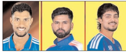
सूर्यकुमार की कप्तानी लेने की दौड़ में श्रेयस अय्यर, ईशान किशन व तिलक वर्मा खेल टाइम्स