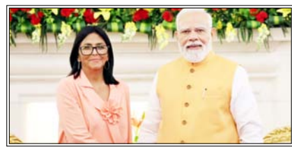
पीएम ने वैश्विक और क्षेत्रीय मुद्दों पर चर्चा के साथ-साथ विकासशील देशों के हितों को बढ़ावा देने पर बात की

नई दिल्ली। भारत और वेनेजुएला ने विशेष रूप से ऊर्जा और उसके साथ-साथ, महत्वपूर्ण खनिज, व्यापार, निवेश, फार्मास्यूटिकल, स्वास्थ्य सेवा तथा ऑटोमोबाइल जैसे क्षेत्रों में सहयोग बढ़ाने पर सहमति व्यक्त करते हुए द्विपक्षीय साझेदारी को और अधिक मजबूत बनाने की प्रतिबद्धता दोहराई है।