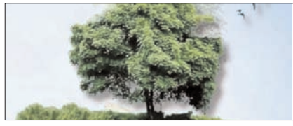
प्रकृति से समझौते का नहीं, संकल्प का समय सम्पादकीय