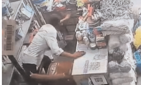
बताया कि चोरी में उनका मोबाइल और कुछ नकदी गायब हुई है। उन्होंने पुलिस से मामले का जल्द खुलासा कर आरोपी को गिरफ्तार करने की मांग की है। साथ ही उन्होंने आशंका जताई कि बाजार में सक्रिय कोई चोर गिरोह व्यापारियों को निशाना बना रहा है। घटना के बाद स्थानीय व्यापारियों में रोष है।

शाह टाइम्स संवाददाता बड़ौता। बड़ौता कोतवाली क्षेत्र के मुख्य बाजार स्थित एक पेंट की दुकान से मोबाइल और नकदी चोरी होने का मामला सामने आया है। पूरी घटना दुकान में लगे सीसीटीवी कैमरे में कैद हो गई। पीड़ित दुकानदार की शिकायत पर पुलिस ने मामले की जांच शुरू कर दी है।