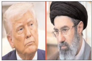
युद्ध शक्तियों वाले प्रस्ताव के पक्ष में वोट दिया, उनमें मिशिगन के प्रतिनिधि टॉम बैरेट, ओहायो के वॉरिन डेविडसन, पेंसिल्वेनिया के ब्रायन फिट्जपैट्रिक और केंटकी के थॉमस मैसी शामिल थे। उन्होंने चेतावनी दी कि ट्रम्प बिना किसी साफ रणनीति के देश को एक लंबे संघर्ष में घसीट सकते हैं। साथ ही

रिपब्लिकन के नेतृत्व वाली अमेरिकी प्रतिनिधि सभा ने राष्ट्रपति डोनाल्ड ट्रम्प को ईरान में आगे कोई भी सैन्य कार्रवाई करने से रोकने के लिए एक प्रस्ताव वॉर पावर्स रेजोल्यूशन (युद्ध शक्ति प्रस्ताव) को मंजूरी दे दी है। यह प्रस्ताव 215-208 मतों से पारित हुआ है। यह प्रस्ताव तब सफल हुआ जब चार रिपब्लिकन सदस्यों ने डेमोक्रेट्स के साथ मिलकर इस युद्ध के प्रति अपनी असहमति जताई।