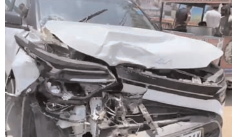
इतनी जोरदार थी कि तीनों वाहन क्षतिग्रस्त हो गए। घटना की सूचना मिलते ही स्थानीय लोग मौके पर पहुंचे और राहत कार्य में जुट गए। कुछ समय के लिए सड़क पर यातायात प्रभावित रहा, लेकिन बाद में क्षतिग्रस्त वाहनों को हटाकर यातायात को सुचारु करा दिया गया।

शाह टाइम्स संवाददाता बागपत। राष्ट्र वंदना चौक के पास गुरुवार को एक सड़क हादसे में तीन वाहन आपस में टकरा गए। हादसे में वाहनों को काफी नुकसान पहुंचा, लेकिन किसी के गंभीर रूप से घायल न होने से बड़ा हादसा टल गया।