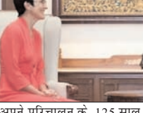
अपने परिचालन के 125 साल पूरे करने जा रहा है। सिटी बैंक की ओर से गुरुवार को हुई इस मुलाकात पर जारी एक विज्ञापित में कहा गया है कि

पीएम से जेन फ्रेजर ने भारत के विकास की प्राथमिकताओं व सहयोग के अवसरों पर की चर्चा