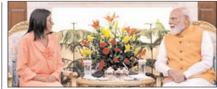
भारत और वेनेजुएला द्विपक्षीय साझेदारी को मजबूत बनाएंगे