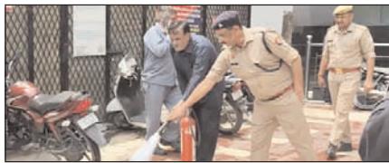
दिल्ली में होटल अग्निकांड के बाद यूपी में अलर्ट जारी

नई दिल्ली, मुजफ्फरनगर, देहरादून, हल्द्वानी, मुगदाबाद, बरेली, मेरठ व लखनऊ से प्रकाशित