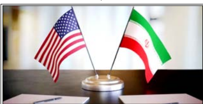
डोनाल्ड ट्रम्प और उनका प्रशासन ईरान को कोई बड़ी रियायत दिए बिना बड़े पैमाने पर धन जारी करने को मंजूरी देने में आनाकानी कर रहा है

ईरान की दो टूक अरबों डॉलर की जब्त की गई उसकी धनराशि को तुरंत जारी किया जाए