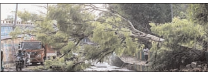
नई दिल्ली। दिल्ली के कई हिस्सों में गुरुवार दोपहर को हुई बारिश से पिछले कई दिनों से पड़ रही भीषण गर्मी से राहत मिली है। राष्ट्रीय राजधानी के कुछ हिस्सों में दिन में तेज आंधी के बाद बारिश हुई। भारत मौसम विज्ञान विभाग (आईएमडी) के अनुसार, गुरुवार दोपहर 2:30 बजे तक मयूर विहार स्टेशन पर सबसे अधिक 23 मिमी बारिश दर्ज की गई, जो 'मध्यम बारिश' की श्रेणी में आती है। आयानगर, पुष्प विहार, पालम और प्रगति मैदान में भी

कुछ और हिस्सों, तमिलनाडु के शेष हिस्सों, दक्षिण-पश्चिम बंगाल की खाड़ी, मध्य-पश्चिम, मध्य-पूर्व और उत्तर-पूर्व बंगाल की खाड़ी के कुछ हिस्सों में भी आगे बढ़ चुका है। अगले दो-तीन दिनों के दौरान मध्य अरब सागर के कुछ और हिस्सों, पूरे गोवा, महाराष्ट्र और आंध्र प्रदेश के कुछ हिस्सों, कर्नाटक के