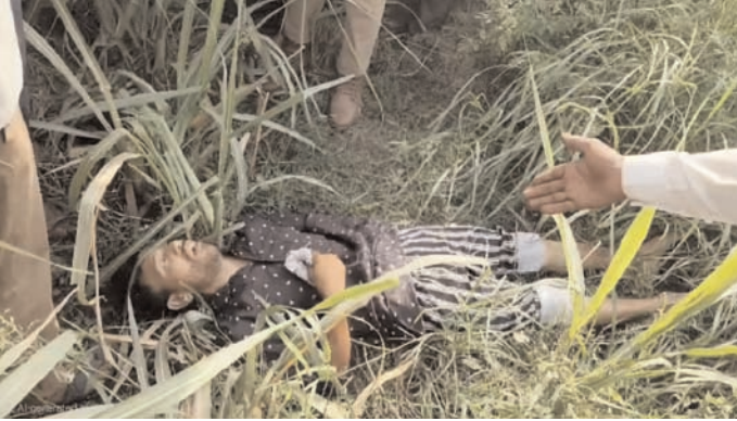
जाएगी। वहीं ग्रामीणों ने मांग उठाई है कि खेतों में करंटयुक्त तार लगाने वालों के खिलाफ सख्त कानूनी कार्रवाई सुनिश्चित की जाए, जिससे भविष्य में किसी और परिवार को इस तरह का दर्द न झेलना पड़े।

उसकी मौत हो चुकी थी। घटना ने एक बार फिर खेतों में अवैध रूप से लगाए जा रहे करंटयुक्त तारों पर सवाल खड़े कर दिए हैं। जिले में पहले भी ऐसे कई हादसे हो चुके हैं, जिनमें लोगों की जान जा चुकी है। बावजूद इसके खेतों में करंट छोड़कर फसलों की सुरक्षा करने की प्रवृत्ति पर अंकुश नहीं लग पाया है। ग्रामीणों का कहना है कि खेतों में लगाए गए ऐसे तार न केवल इंसानों बल्कि पशुओं के लिए भी बड़ा खतरा बन चुके हैं। कई बार राहगीर और किसान भी अनजाने में इनकी चपेट में आ जाते हैं। इसके बावजूद जिम्मेदार लोग नियमों की अनदेखी कर रहे हैं। थाना प्रभारी का कहना है कि घटना की जांच की जा रही है। पोस्टमार्टम रिपोर्ट और जांच के आधार पर आगे की कार्रवाई की