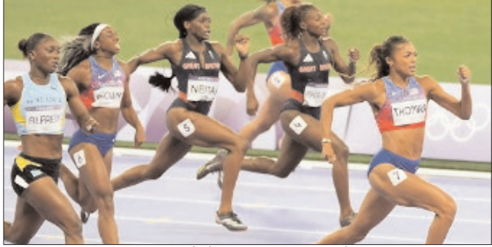
गैबी थॉमस ने जीता 200 मीटर का खिताब।

रहा है। मैं इस 'ऑफ' ईयर (विना बड़े टूर्नामेंट वाले साल) का आनंद ले रही हूँ क्योंकि इसमें ओलंपिक या वर्ल्ड चैंपियनशिप का कोई दबाव नहीं है, इसलिए मैं बस इस सीजन का मजा ले रही हूँ। थॉमस ने सेंट लूसिया की मौजूदा ओलंपिक 100 मीटर