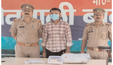
जिंदा कारतूस भी बरामद हुआ। इस संबंध में शस्त्र अधिनियम के तहत अलग मुकदमा दर्ज किया गया है। बरामदगी के आधार पर संबंधित मुकदमों में आवश्यक धाराओं की बढ़ोतरी भी की गई है। थाना प्रभारी का कहना है कि गिरफ्तार आरोपी से पूछताछ में कई महत्वपूर्ण जानकारीयां मिली हैं, जिनके आधार पर अन्य घटनाओं के खुलासे की भी संभावना है। आरोपी को न्यायालय में पेश कर न्यायिक हिरासत में भेजने की कार्रवाई की जा रही है। साथ ही गिरोह के फरार सदस्यों की तलाशी में पुलिस टीमों को लगाया गया है।

काला इन्वेंटरी बाबूगढ़ थाना क्षेत्र में दर्ज चोरी के मुकदमे से संबंधित है। इसके अलावा दो मोबाइल फोन बुलंदशहर जनपद के बीबीनगर थाना क्षेत्र में हुई चोरी की घटना से जुड़े पाए गए। वहीं विना नंबर प्लेट की स्केलर प्लस मोटरसाइकिल अमरोहा जिले के गजरोला थाना क्षेत्र में हुई लूट की वारदात की निकली। पूछताछ में आरोपी ने अपने साथियों के साथ मिलकर हापुड़, अमरोहा और बुलंदशहर जनपदों में चोरी और लूट की कई घटनाओं को अंजाम देने की बात स्वीकार की है। पुलिस का कहना है कि गिरोह के अन्य सदस्यों की पहचान कर उनकी गिरफ्तारी के प्रयास किए जा रहे हैं। तलाशी के दौरान आरोपी के कब्जे से एक 315 बोर का अवैध तमंचा और एक