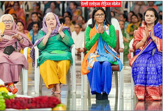
अंध प्रदेश। श्री सत्य साई जिले में स्थित प्रशांति मिलनम के दौरे के दौरान लोगों के साथ प्रार्थना करती बोलिवेरियन गणराज्य वेनेजुएला की कार्यवाहक राष्ट्रपति डेल्ली एलोइजा रोड्रिगुज गोलेज।

हफरनन ने कहा कि ऐसा लगता है कि दो शूटर थे जो 'शायद एक-दूसरे पर गोली चला रहे थे' और उनमें से कोई भी अभी हिरासत में नहीं है। सीएनएन की रिपोर्ट के मुताबिक गोलियों की तेज आवाज सुनकर फेस्टिवल में आए लोग घबराकर ऐतिहासिक इलाके में भागने लगे। गोलीबारी से घबराई भीड़ चिल्ला रही थी और फूट डूकों तथा गोल्फ कार्ट के बीच छिपने की कोशिश कर रही थी। टोलेडो के मेयर वेड कैम्पजुकिविज ने कहा कि सभी घायलों की हालत बेहतर है।