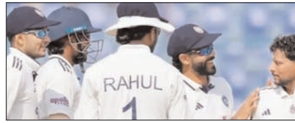
मुल्लापुर टेस्ट: भारत ने कसा अफगानिस्तान पर शिकंजा खेल टाइम्स