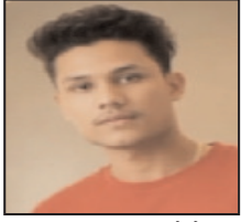
मृतक का फाइल फोटो

बड़ौत से शाहदरा जाते समय खेकड़ा रेलवे स्टेशन पर हुआ हादसा, परिवार में कोहराम