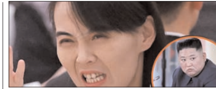
उत्तर कोरिया ने अमेरिका को दी खुली चुनौती, परमाणु हथियार नहीं छोड़ेगे पेज 12