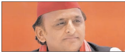
अखिलेश यादव ने राम मंदिर में चढ़ावे की रकम को लेकर उठाए गंभीर सवाल पेज 2

नई दिल्ली, मुजफ्फरनगर, देहरादून, हल्द्वानी, मुगदाबाद, बरेली, मेरठ व लखनऊ से प्रकाशित