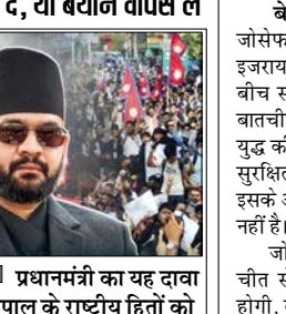
प्रधानमंत्री का यह दावा नेपाल के राष्ट्रीय हितों को नुकसान पहुंचाने वाला है

काठमांडू। नेपाल के प्रधानमंत्री बालेन शाह ने रविवार को कहा था कि सिर्फ भारत ने ही नेपाली जमीन पर कब्जा नहीं किया, बल्कि नेपाल ने भी कुछ भारतीय इलाकों पर कब्जा किया है। इस बयान का आज नेपाल की संसद में जमकर विरोध हुआ, विपक्षी दलों ने बालेन शाह से भारत से जुड़े इस विवादित दावे पर जवाब मांगा।