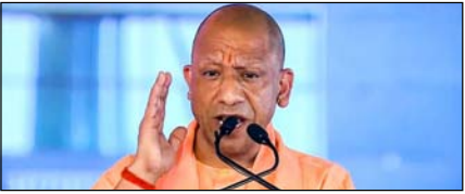
आमजन की समस्याओं का समयबद्ध निस्तारण हो: मुख्यमंत्री योगी

नई दिल्ली, मुजफ्फरनगर, देहरादून, हल्द्वानी, मुरादाबाद, बरेली, मेरठ व लखनऊ से प्रकाशित