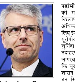
ईरान ऐसा नहीं मानता कि केवल सुरक्षा परिषद का प्रस्ताव ही समझौते के लागू होने की गारंटी होगा