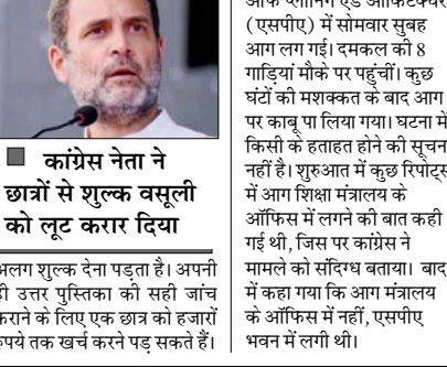
कांग्रेस नेता ने छात्रों से शुल्क वसूली को लूट करार दिया

नई दिल्ली। कांग्रेस के पूर्व अध्यक्ष तथा लोकसभा में विपक्ष के नेता राहुल गांधी ने केंद्रीय माध्यमिक शिक्षा बोर्ड (सीबीएसई) पर उसकी गलतियों के लिए छात्रों से शुल्क वसूली को लूट करार देते हुए कहा है कि जब शिक्षा को सेवा के बजाय कारोबार बना दिया जाता है, तो उससे अनेक बुराइयें जन्म लेना शुरू कर देती हैं। राहुल गांधी ने एक्स पर कहा कि सीबीएसई की गलतियों से नंबर गलत आएँ, तो उसकी कीमत छात्रों को चुकाना पड़ती है। डिजिटल स्कैन कॉपी, री-टोटलिंग और री-इवैल्यूएशन के लिए अलग-