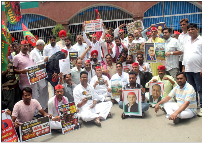
कलेक्ट्रेट पर हंगामा करते सपा कार्यकर्ता।

शाह टाइम्स संवाददाता मेरठ। समाजवादी पार्टी ने सोमवार को बहुती महंगाई, बिजली दरों और पेट्रोल-डीजल, सीएनजी व रसाईं गैस के बढ़ते दामों के खिलाफ जागरण प्रदर्शन किया। पार्टी के आह्वान पर सैकड़ों कार्यकर्ता कमिश्नरी पार्क मैदान में एकत्र हुए और वहां से कलेक्ट्रेट तक पैदल मार्च निकाला। प्रदर्शन का सबसे चर्चित पहलू रहा सांकेतिक विरोध। कार्यकर्ताओं ने ईंधन की कीमतों में वृद्धि से आम आदमी पर बढ़ते बोझ को दर्शाने के लिए एक कार को रस्सियों से बांधकर कलेक्ट्रेट तक खींचा। इस दौरान 'महंगाई वापस लो', 'भाजपा सरकार हारा' में आओ' के नारे गुंजते