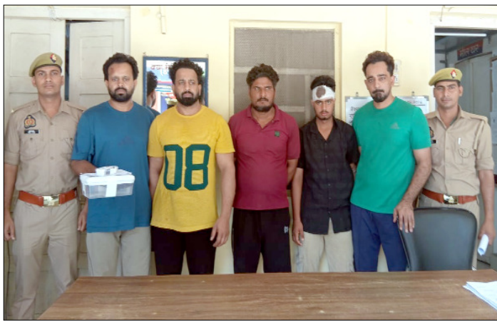
पुलिस हिरासत में आरोपी।