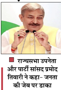
राज्यसभा उपनेता और पार्टी सांसद प्रमोद तिवारी ने कहा- जनता की जेब पर डाका

नई दिल्ली, वार्ता कर्मशियल एलपीजी सिलेंडर की कीमतों में एक बार फिर बढ़ोतरी होने के बाद कांग्रेस के राज्यसभा उपनेता और सांसद प्रमोद तिवारी ने केंद्र सरकार पर जनता की जेब पर डाका डालने का आरोप लगाते हुए कहा है कि एक तरफ प्रधानमंत्री मन की बात करते हैं, वहीं दूसरी तरफ उनकी सरकार गैस सिलेंडर के दाम बढ़ाकर आम लोगों पर आर्थिक बोझ डाल रही है। तिवारी ने सोमवार को कहा कि 19 किलो वाले कर्मशियल एलपीजी सिलेंडर की कीमत में 42 रुपये की वृद्धि कर दी गई है। इसके बाद दिल्ली में इसकी कीमत 3113.50 रुपये और कोल. काता में 3255.50 रुपये पहुंच गई है। उन्होंने यह भी कहा कि 5