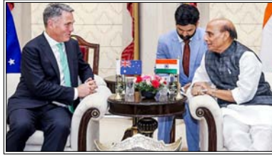
रक्षा मंत्री राजनाथ सिंह और ऑस्ट्रेलिया के रक्षा मंत्री रिचर्ड मालर्स ने सोमवार को यहाँ दूसरे भारत व ऑस्ट्रेलिया रक्षा मंत्री संवाद की सह अध्यक्षता की

नई दिल्ली। भारत और ऑस्ट्रेलिया ने अपनी रणनीतिक रक्षा साझेदारी को मजबूती से आगे बढ़ाते हुए समुद्री सुरक्षा, रक्षा उद्योग, परस्पर सैन्य संचालन क्षमता और उभरती प्रौद्योगिकियों के क्षेत्रों में सहयोग बढ़ाने पर सहमति व्यक्त की है। दोनों देशों ने हिन्द-प्रशांत क्षेत्र में सुरक्षा और स्थिरता को मजबूत करने की अपनी प्रतिबद्धता दोहराई।