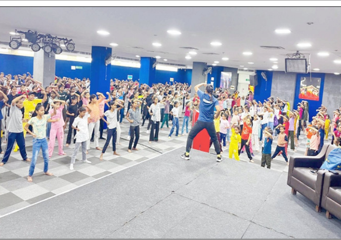
स्पेशल यूनिट फॉर वूमन एंड चाइल्ड द्वारा आयोजित आत्मरक्षा ग्रीष्मकालीन शिविर में भाग लेती महिलाएं एवं बच्चे।