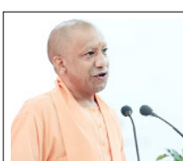
अनावश्यक विलंब होने पर संबंधित अधिकारियों की जवाबदेही भी तय की जाए: मुख्यमंत्री

शाह टाइम्स ब्यूरो लखनऊ। उत्तर प्रदेश के मुख्यमंत्री योगी आदित्यनाथ ने सोमवार को आयोजित जनता दर्शन में प्रदेश के विभिन्न जिलों से आए लोगों की समस्याएं सुनीं और संबंधित अधिकारियों को त्वरित एवं प्रभावी कार्रवाई के निर्देश दिए। उन्होंने कहा कि आमजन की समस्याओं का समयबद्ध निस्तारण सुनिश्चित किया जाए तथा अनावश्यक विलंब होने पर संबंधित अधिकारियों की जवाबदेही भी तय की जाए। जनता दर्शन के दौरान मुख्यमंत्री के समक्ष राज्य और पुलिस विभाग से जुड़े कई प्रकरण प्रस्तुत किए गए। मुख्यमंत्री ने अधिकारियों को निर्देशित किया कि लंबित राजस्व वारंटों का निर्धारित समय सीमा के भीतर निस्तारण किया जाए। छह