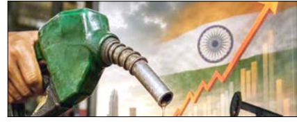
महंगाई की मार झेलता आम आदमी, मजे में जिदगी जीता एक वर्ग!