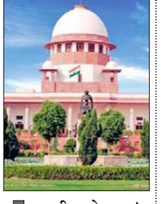
एनटीई को राहत! मामले की सुनवाई जुलाई तक स्थगित की

नई दिल्ली। सुप्रीम कोर्ट ने आगामी 21 जून को फिर से होने वाली नीट-यूजी परीक्षा को कंप्यूटर आधारित टेस्ट (सीबीटी) प्रारूप में आयोजित करने के लिए राष्ट्रीय परीक्षण एजेंसी (एनटीई) को निर्देश देने से सोमवार को इन्कार कर दिया और मौजूदा 'पेन-एंड-पेपर' (ऑफलाइन) मोड को ही बरकरार रखने का फैसला किया।