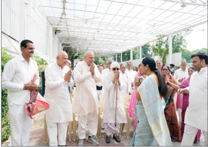
मुख्यमंत्री रेखा गुप्ता दिल्ली के किसानों से मिलती हुईं।

जैतपुर पुरता मार्ग से फरीदाबाद सेक्टर-65 तक लगभग 24 किलोमीटर तथा वहां से सोहना तक 26 किलोमीटर लंबा हिस्सा पहले से संचालित है। अब डीएनडी से जुड़ने वाला अंतिम खंड पूरा होने के बाद यह संपर्क और अधिक प्रभावी हो जाएगा। इस परियोजना को शुरू होने से दिल्ली, नोएडा, ग्रेटर नोएडा, गाजियाबाद, फरीदाबाद और पलवल के बीच यात्रा करने वाले हजारों वाहन चालकों को वैकल्पिक और तेज मार्ग उपलब्ध होगा।