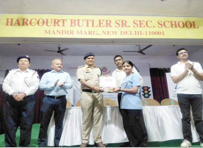
दिल्ली टैफिक पुलिस के 'प्रोजेक्ट संगम' के तहत हुए कार्यक्रम में प्रतिभागियों को सम्मानित किया गया।

पुलिस ने इमारत के मालिक के खिलाफ भारतीय न्याय संहिता (बीएनएस) की धाराओं 105 (गैर इरादतन हत्या), 290 (इमारत गिराने, मरम्मत या निर्माण आदि के संबंध में लाप. रवाहीपूर्ण आचरण) और 125(ए) (दूसरों के जीवन या निजी सुरक्षा को खतरे में डालने वाला कृत्य) के तहत प्राथमिकी दर्ज की है। पुलिस ने बताया कि इमारत के फरार मालिक का पता लगाने और उसे गिरफ्तार करने के लिए कई पुलिस दल गठित किए गए हैं।