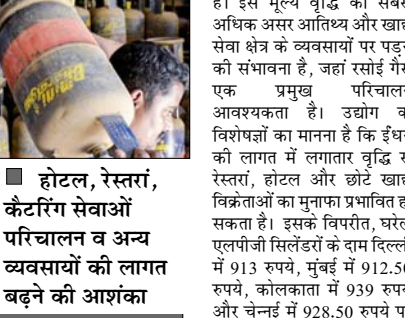
होटल, रेस्तरां, कैटरिंग सेवाओं परिचालन व अन्य व्यवसायों की लागत बढ़ने की आशंका

नई दिल्ली। देशभर में वाणिज्यिक रसाईं गैस (एलपीजी) सिलेंडरों की कीमतों में सोमवार को एक बार फिर बढ़ोतरी की गई। इससे होटल, रेस्तरां, कैटरिंग सेवाओं और एलपीजी पर निर्भर अन्य व्यवसायों की परिचालन लागत बढ़ने की आशंका है। दिल्ली में 19 किलोग्राम वाले वाणिज्यिक एलपीजी सिलेंडर की कीमत में 42 रुपये बढ़ाकर 3,113.50 रुपये कर दी गई है। कोलकाता में सबसे अधिक 53.50 रुपये की बढ़ोतरी दर्ज की गई, जबकि मुंबई और चेन्नई में क्रमशः 43.50 रुपये और 46 रुपये बढ़ाई गई हैं। तेल विपणन कंपनियों ने पांच किलोग्राम के फ्री ट्रेड एलपीजी सिलेंडर की कीमत में भी 11 रुपये की वृद्धि की है। हालांकि घरेलू इस्तेमाल वाले 14.2 किलोग्राम के सिलेंडर के दाम में