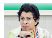
राहत तथा फसलों के लिए लाभकारी न्यूनतम समर्थन मूल्य (एएसपी) सुनिश्चित करना आवश्यक है। उन्होंने केंद्र सरकार से उर्वरकों की बढ़ती हुई कीमतों को लेकर राहत पैकेज की घोषणा करने की मांग की। वह कांग्रेस किसानों के हितों से जुड़े मुद्दों को उठाती रही हैं और आगे भी किसानों के हितों के लिए आवाज उठाती रहेंगी।

चंडीगढ़, वार्ता हरियाणा में सिरसा सीट से सांसद कुमारी सैलजा ने आरोप लगाया कि केंद्र की भाजपा सरकार की नीतियों के कारण खेती किसानों के लिए घाटे का सौदा बनती जा रही है। उन्होंने कहा कि किसानों की आय दोगुनी करने का वादा पुरा नहीं हुआ, जबकि खाद, बीज, कीटनाशक, डीजल और कृषि उपकरणों की कीमतों में लगातार वृद्धि से खेती की लागत बढ़ी है। कुमारी सैलजा ने यहां एक बयान में कहा कि हाल ही में एनपीके और पोटाश जैसे उर्वरकों की कीमतों में बढ़ोतरी से किसानों पर अतिरिक्त आर्थिक बोझ पड़ा है। उनके अनुसार खेती के लिए आवश्यक संसाधनों के महंगे होने से किसानों की परिस्थितियां बुरी हैं। उन्होंने कहा कि किसानों को राहत देने के लिए कृषि आदानों की कीमतों पर नियंत्रण, डीजल पर