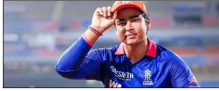
सूर्यवंशी ने जीते ऑरेंज कैप, एमवीपी और इमर्जिंग प्लेयर अवॉर्ड