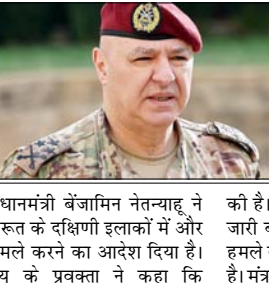
यूरोपीय संघ (ईयू) ने इजरायल से लेबनान में बढ़ती सैन्य कार्रवाई रोकने की अपील की

प्रधानमंत्री बेंजामिन नेतन्याहू ने बेरूत के दक्षिणी इलाकों में और हमले करने का आदेश दिया है। ईयू के प्रवक्ता ने कहा कि इजरायल को लेबनान में सैन्य तनाव बढ़ाने वाली कार्रवाई बंद करनी चाहिए। इजरायल को लेबनान की संप्रभुता और उसकी क्षेत्रीय अखंडता का सम्मान करना चाहिए। सऊदी अरब ने कहा कि इस तरह की घटनाएं क्षेत्र में शांति और स्थिरता बहाल करने की कोशिशों को कमजोर करती हैं और तनाव को और बढ़ाती हैं।