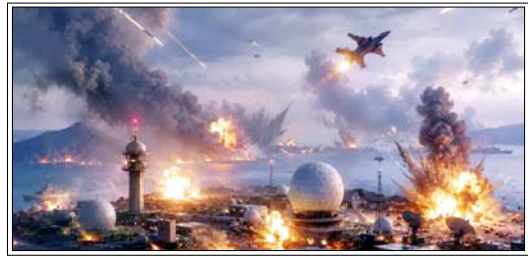
अमेरिकी लड़ाकू विमानों ने ईरान की हवाई रक्षा प्रणालियों, एक ग्राउंड कंट्रोल स्टेशन और दो हमलावर ड्रोन को नष्ट कर दिया

वाशिंगटन/तेहरान। अमेरिका-ईरान के बीच जारी संघर्षविषयों को आगे बढ़ाने और होर्मुज जलडमरूमध्य को फिर से खोलने के उद्देश्य से किए गए प्रस्तावित समझौते में अमेरिकी राष्ट्रपति डोनाल्ड ट्रम्प की ओर से कुछ बदलाव सुझाकर उसे वापस भेजने के बावजूद ईरान और अमेरिका के बीच हमलों और जवाबी हमलों का सिलसिला जारी है।