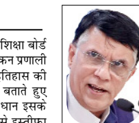
शिक्षा मंत्री धर्मेश प्रधान इस्तीफा दें या उन्हें तत्काल पद से हटाएं प्रधानमंत्री मोदी: पवन खेड़ा

नई दिल्ली, वार्ता कांग्रेस ने केंद्रीय माध्यमिक शिक्षा बोर्ड (सीबीएसई) की डिजिटल मूल्यांकन प्रणाली की खामियों को देश के शिक्षा इतिहास की सबसे बड़ी संस्थागत विफलता बताते हुए कहा है कि शिक्षा मंत्री धर्मेश प्रधान इसके लिए जिम्मेदार हैं और उन्हें पद से इस्तीफा देना चाहिए अथवा प्रधानमंत्री नरेंद्र मोदी को उन्हें तत्काल हटा देना चाहिए। कांग्रेस संचार विभाग के प्रमुख पवन खेड़ा ने सोमवार को यहां पार्टी मुख्यालय में संवाददाता सम्मेलन में आरोप लगाया कि मोदी सरकार के 12 वर्षों के शासन में देश की शिक्षा व्यवस्था लगातार कमजोर हुई है। सीबीएसई, नीट, यूजीसी-नेट और सीयूईटी जैसे मामलों में देश को परीक्षा प्रणाली की विश्वसनीयता पर गंभीर सवाल खड़े कर दिए हैं। खेड़ा ने यह भी आरोप लगाया कि सीबीएसई ने डिजिटल डिजिटल प्रणाली में सुरक्षा संबंधी गंभीर खामियां भी सामने आईं, जिनसे छात्रों के डेटा अंदाज किया। उनके अनुसार परीक्षा के दौरान दर्जनों तकनीकी कर्मियों सामने आई थीं, लेकिन