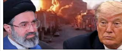
अमेरिका ने ईरान की रडार-ड्रोन कंट्रोल साइट्स पर किया हमला