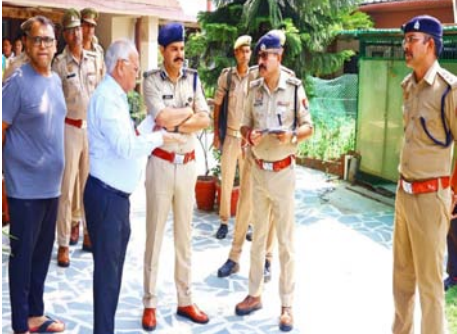
बदमाशों ने परिवार के अन्य सदस्यों को भी धमकाकर एक जगह बैठा दिया। इसके बाद आरोपितों ने पूरे मकान की तलाशी ली। अलमरारियों और लॉकरों में रखे सोने के आभूषण तथा नकदी समेट ली। वारदात के दौरान बदमाश बेहद सतर्क दिखाई दिए। उन्होंने घर की

शाह टाइम्स संवाददाता हापुड़। शहर के पॉश क्षेत्र गढ़ रोड में सोमवार रात हथियारबंद बदमाशों ने एक उद्योगपति के घर धावा बोल कर परिवार को बंधक बना लिया और लाखों की संपत्ति लूटकर फरार हो गए। करीब तीन-चौथाई घंटे तक चली इस वारदात से इलाके में दहशत फैल गई। पुलिस ने मामले की जांच के लिए कई टीमों गठित कर दी हैं।