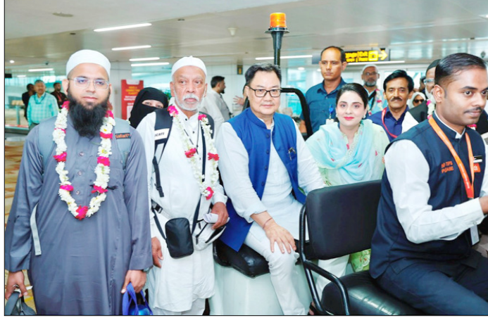
दिल्ली के इंदिरा गांधी अंतरराष्ट्रीय हवाई अड्डे से दिल्ली स्टेट हज कमेटी की व्यवस्था में हज पर जाने वाले हाजियों की वापसी शुरू।