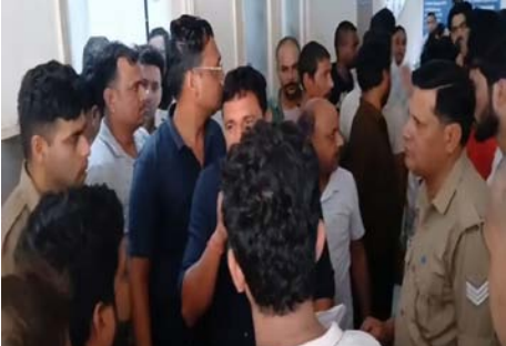
जानकारी के अनुसार, प्रसव के लिए भर्ती कराई गई महिला का ऑपरेशन कर चिकित्सकों ने बच्चे का जन्म कराया था। परिजनों के मुताबिक जन्म के बाद नवजात की तबीयत बिगड़ने लगी और उसे विशेष चिकित्सकीय निगरानी में रखा गया। परिवार का आरोप है कि हालत गंभीर होने के बावजूद बच्चे

शाह टाइम्स संवाददाता हापुड़। शहर के गढ़ रोड स्थित एक निजी अस्पताल में नवजात शिशु की मौत के बाद मंगलवार को माहौल तनावपूर्ण हो गया। शोक-काल परिजनों ने अस्पताल प्रशासन पर समय रहते उचित निर्णय न लेने का आरोप लगाते हुए जमकर विरोध प्रदर्शन किया। घटना की सूचना पर पहुंची पुलिस ने स्थिति को नियंत्रित किया।