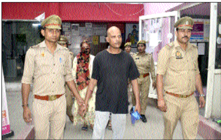
लालकुर्ती पुलिस ने मां, पत्नी, बहन व भाई को हिरासत में लिया

शाह टाइम्स संवाददाता मेरठ। लालकुर्ती थाना क्षेत्र के घोसी मोहल्ला में पुलिस टीम पर