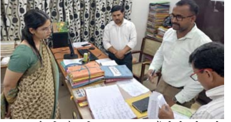
साफ-सफाई न मिलने पर जिलाधिकारी ने नाराजगी जताते हुए नजारात नाज़िर को तत्काल व्यवस्था सुधारने के निर्देश दिए। वहीं रिकॉर्ड रूप में शासनादेशों का रिकॉर्ड अपडेट न पाए जाने पर संबंधित कर्मचारियों को फटकार लगाई गई और सभी अभिलेखों को व्यवस्थित एवं अद्यतन रखने को कहा गया। निरीक्षण के दौरान जिलाधिकारी ने

शाह टाइम्स संवाददाता हापुड़। जिलाधिकारी कविता मीना ने मंगलवार को कलेक्ट्रेट परिसर का औचक निरीक्षण कर कार्यालयी व्यवस्थाओं की हकीकत परखी। निरीक्षण के दौरान कई विभागों में साफ-सफाई की कमी और अभिलेखों के अद्यतन न होने जैसी खामियां सामने आने पर संबंधित अधिकारियों एवं कर्मचारियों को कड़ी चेतावनी दी गई।