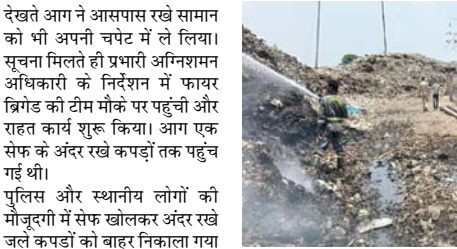
आग की सूचना मिलते ही दमकल विभाग की टीम मौके पर पहुंची और दमकल वाहन से लगातार पानी की बौछार कर आग बुझाने का प्रयास शुरू किया। कानू मशकत के बाद आग को नियंत्रित कर लिया गया। दमकल अधिकारियों ने बताया कि दोनों घटनाओं में समय पर कार्रवाई होने से बड़ा नुकसान टल गया। आग बुझाने के बाद लोगों को विद्युत उपकरणों के रखरखाव और अग्नि सुरक्षा उपायों के प्रति जागरूक भी किया गया। विभाग ने नागरिकों से अपील की है कि गर्मी के मौसम में बिजली के उपकरणों का उपयोग सावधानीपूर्वक करें तथा किसी भी आपात स्थिति में तुरंत फायर सर्विस को सूचना दें।

शाह टाइम्स संवाददाता हापुड़। मंगलवार को शहर और उसके आसपास के क्षेत्र में आग लगने की दो अलग-अलग घटनाओं ने लोगों को निता में डाल दिया। एक ओर प्रीत विहार की ट्रारिका धाम कॉलोनी में मकान की दूसरी मंजिल पर आग लगने से घरेलू सामान जलकर राख हो गया, वहीं दूसरी ओर रामपुर रोड स्थित डॉपिंग ग्राउंड में कबाड़ के ढेर में आग भड़क उठी। दोनों घटनाओं में दमकल विभाग की मुस्लेदी के चलते आग पर समय रहते नियंत्रण पा लिया गया और किसी प्रकार की जनहानि नहीं हुई।