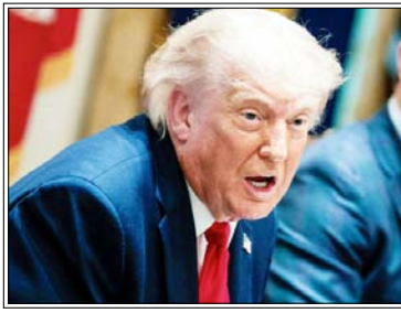
नेतन्याहू ने सेना को लेबनान में अपने जमीनी अभियान का विस्तार करने का निर्देश दिया है। इजरायल ने नबातिएह शहर के निकट एक रणनीतिक पहाड़ी पर स्थित ऐतिहासिक व्यूफोर्ट किले पर भी कब्जा कर लिया है।

इजरायल के पीएम नेतन्याहू को फोन कर फटकार लगाई, कहा- पागल हो गए हो क्या, तुरंत ये सब रोको