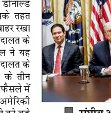
संघीय अपील अदालत के न्यायाधीशों के एक विभाजित पैनल ने यह फैसला सुनाया