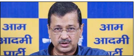
देश में कभी सोना नहीं बेचा गया : केजरीवाल पेज 2

नई दिल्ली, मुजफ्फरनगर, देहरादून, हल्द्वानी, मुगदाबाद, बरेली, मेरठ व लखनऊ से प्रकाशित