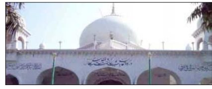
दरगाह बधरा एकता की प्रतीक सम्पादकीय