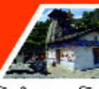
त्रियुगी नारायण मन्दिर

माणगा गांव, व्यास गुफा और गणेश गुफा, भीमशिला, औली, फूलों की घाटी, वसुधारा जलाप्रपात, चरणपादुका, तमकुंड, नारदकुंड, ज्योतिर्मठ (जोशीमठ), सतोपथ झील, पाण्डुकेश्वर, आदिबदरी मन्दिर, हेमकुंड साहिब