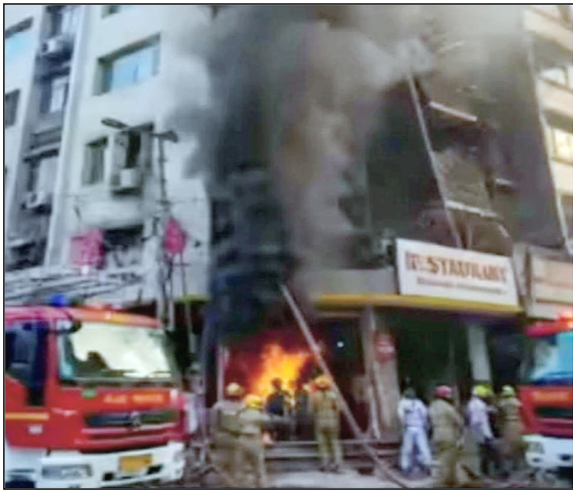
■ एम्स में 10 दमकलकर्मी भी भर्ती, जो राहत कार्य के समय घायल हुए ■ बच्चे के साथ तीसरे फ्लोर से कूदी महिला ■ स्टोरेंट के ऊपर बने गेस्ट हाउस में थी 6 कमरे की ही परमिशन बनाए गए थे 25 कमरे

शाह टाइम्स संवाददाता नई दिल्ली। मालवीय नगर के हौजरानी स्थित एक रेस्तरां में बुधवार सुबह आठ बजे आग लग गई। फायर ब्रिगेड के अनुसार, सुबह 8.50 बजे आग लगने की सूचना मिली, जिसके बाद दमकल विभाग की 10 गाड़ियां मौके पर पहुंचीं। मालवीय नगर स्थित रफ्लरिस्टा गेस्ट हाउस में अचानक भीषण आग लग गई। इस हादसे में अब तक 21 लोगों की मौत हो चुकी है, जबकि 40 से अधिक लोगों को सुरक्षित बाहर निकालकर अस्पतालों में भर्ती कराया गया है। बिल्डिंग के नीचे चल रहा था रेस्टोरेंट, जहां की आग बिल्डिंग में फैल गई। कई लोग जान बचाने के लिए बिल्डिंग से नीचे कूदे।