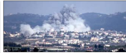
ईरान के केशम द्वीप पर अमेरिकी हमला, ईरान ने भी किया पलटवार पेज 12