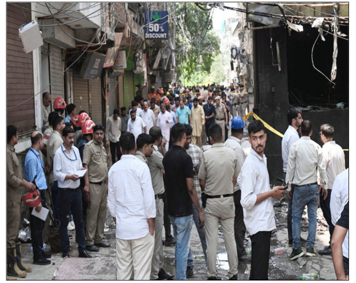
मालवीय नगर में फायर फाइटर्स, पुलिस व अन्य अधिकारी घटनास्थल का मुआयना करते हुए।

दिल्ली पुलिस के अनुसार, हादसे वाले होटल में आने-जाने का केवल एक ही रास्ता था। इस दर्दनाक हादसे में जान गंवाने वाले 21 लोगों में से ज्यादातर विदेशी नागरिक हैं। वहीं, लगभग 26 लोग गंभीर रूप से घायल हुए हैं, जिनमें भी विदेशी नागरिकों की संख्या अधिक है। पुलिस इस मामले में गैर-इरादतन हत्या और अन्य संबंधित धाराओं के तहत मुकदमा दर्ज करने की तैयारी कर रही है। इस रेस्टोरेंट के ऊपर बने गेस्ट हाउस में 6 कमरे की ही परमिशन ली गई थी लेकिन यहां 25 कमरे बनाए गए थे। यह इलाका बड़ी संख्या में विदेशी मेहमानों को उठराने के लिए जाना जाता है। इनमें से कई लोग दिल्ली में इलाज के लिए आते थे क्योंकि कई बड़े अस्पताल यहां से नजदीक हैं।