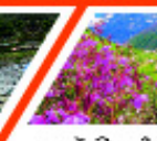
फूलों की घाटी