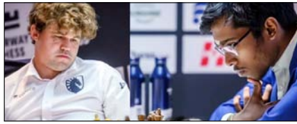
प्रज्ञानंद ने कार्लसन पर दूसरी जीत के साथ इतिहास रचा खेल टाइम्स