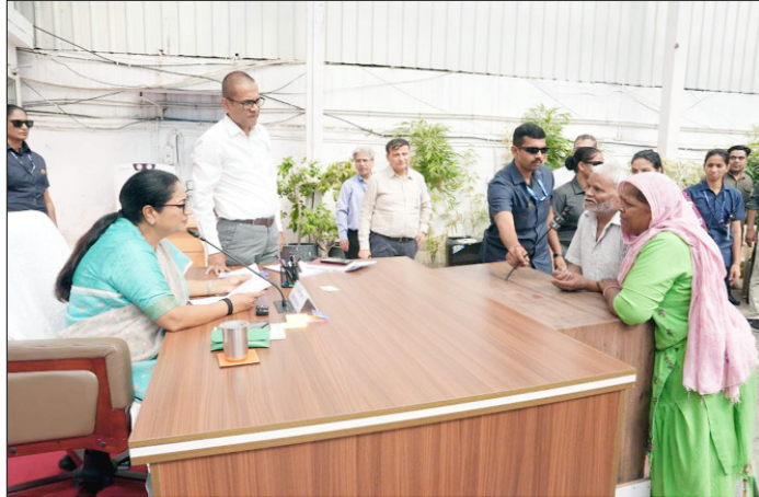
मुख्यमंत्री रेखा गुप्ता मुख्यमंत्री जन सेवा सदन में आयोजित जनसुनवाई कार्यक्रम के दौरान राजधानी के विभिन्न क्षेत्रों से आए नागरिकों से सीधे संवाद करते हुए।

करते हुए मुख्यमंत्री ने अधिकारियों को निर्देश दिया कि लंबित मामलों की प्राथमिकता के आधार पर समीक्षा कर उचित समाधान सुनिश्चित किया जाए। वहीं, शिक्षा से संबंधित विषय लेकर पहुंची एक महिला ने अपने बच्चों की पढ़ाई में आ रही कठिनाइयों से मुख्यमंत्री को अवगत कराया, जिस पर मुख्यमंत्री ने संबंधित अधिकारियों को तत्काल आवश्यक सहायता उपलब्ध कराने के निर्देश दिए। इसी प्रकार, एक महिला ने बैंकिंग और पारिवारिक विवाद से जुड़े मामले में अपनी समस्या मुख्यमंत्री के समक्ष रखी।