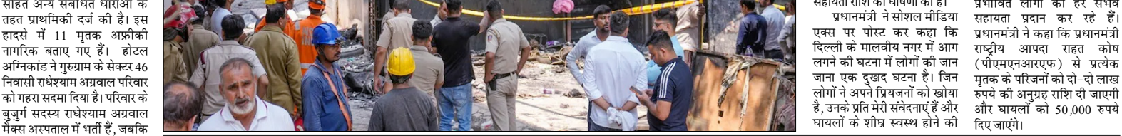
दिल्ली में इलाज के लिए आया था, जो हादसे का शिकार हो गया। जांच में होटल फ्लोरिडा स्टे बी एंड बी में सुरक्षा मानकों के गंभीर उल्लंघन सामने आए हैं। अधिकारियों के अनुसार आग होटल के बेसमेंट में संचालित रेस्तरां 'लेमन ग्रीन' में लगी थी। सूत्रों के मुताबिक होटल में प्रवेश और निकास के लिए केवल एक ही रास्ता था, जिससे आपात स्थिति में लोगों को बाहर निकलने में भारी कठिनाई हुई। जांच में यह भी सामने आया है कि होटल को केवल छह कमरों के संचालन की अनुमति थी, जबकि वहां करीब 25 कमरे संचालित किए जा रहे थे और लगभग -शेष पृष्ठ दो पर

नई दिल्ली। प्रधानमंत्री नरेन्द्र मोदी ने राजधानी दिल्ली के मालवीय नगर में बुधवार सुबह एक होटल में आग लगने की घटना पर गहरा दुख व्यक्त किया है और इस हादसे में मारे गए लोगों के परिजनों एवं घायलों के लिए सहायता राशि की घोषणा की है। प्रधानमंत्री ने सोशल मीडिया एक्स पर पोस्ट कर कहा कि दिल्ली के मालवीय नगर में आग लगने की घटना में लोगों की जान जाना एक दुःख घटना है। जिन लोगों ने अपने प्रियजनों को खोया है, उनके प्रति मेरी संवेदनाएं हैं और घायलों के शीघ्र स्वस्थ होने की कठिनाई हुई। जांच में यह भी सामने आया है कि होटल को केवल छह कमरों के संचालन की अनुमति थी, जबकि वहां करीब 25 कमरे संचालित किए जा रहे थे और लगभग -शेष पृष्ठ दो पर