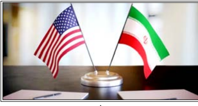
डोनाल्ड ट्रम्प और उनका प्रशासन ईरान को कोई बड़ी रियायत दिए बिना बड़े पैमाने पर धन जारी करने को मंजूरी देने में आनाकानी कर रहा है

ईरान की दो टूक अरबों डॉलर की जब्त की गई उसकी धनराशि को तुरंत जारी किया जाए