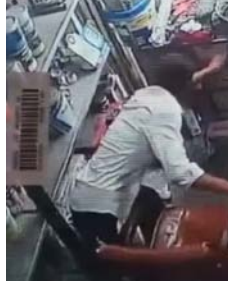
बताया कि चोरी में उनका मोबाइल और कुछ नकदी गायब हुई है। उन्होंने पुलिस से मामले का जल्द खुलासा कर आरोपी को गिरफ्तार करने की मांग की है। साथ ही उन्होंने आशंका जताई कि बाजार में सक्रिय कोई चोर गिरोह व्यापारियों को निशाना बना रहा है। घटना के बाद स्थानीय व्यापारियों में रोष है।

शाह टाइम्स संवाददाता बड़ौता। बड़ौता की तवाली क्षेत्र के मुख्य बाजार स्थित एक पेंट की दुकान से मोबाइल और नकदी चोरी होने का मामला सामने आया है। पूरी घटना दुकान में लगे सीसीटीवी कैमरे में कैद हो गई। पीड़ित दुकानदार की शिकायत पर पुलिस ने मामले की जांच शुरू कर दी है।