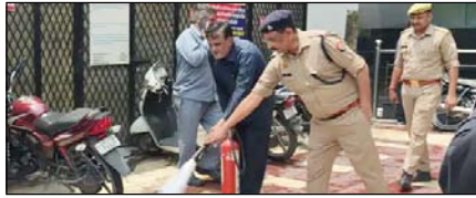
दिल्ली में होटल अग्निकांडके बाद यूपी में अलर्ट जारी

नई दिल्ली, मुजफ्फरनगर, देहरादून, हल्द्वानी, मुगदाबाद, बरेली, मेरठ व लखनऊ से प्रकाशित