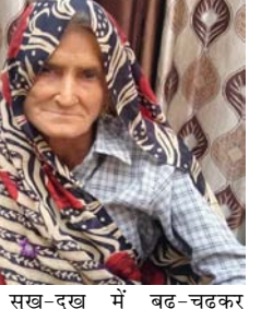
सुख-दुख में बह-चढ़कर भागीदारी निभाती थीं और समाज के हर वर्ग के लोगों से उनका आत्मीय संबंध था। उनके निधन से परिवार ही नहीं, पूरे क्षेत्र में शोक का माहौल है।