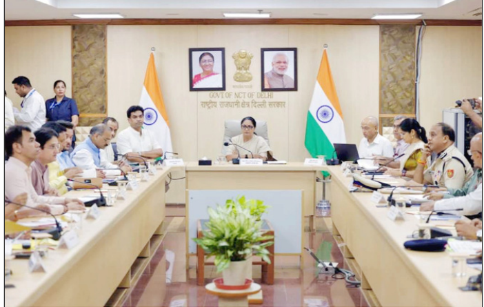
मुख्यमंत्री रेखा गुप्ता कांवड़ यात्रा-2026 की तैयारियों को लेकर आयोजित कांवड़ समिति की समीक्षा बैठक की अध्यक्षता करते हुए।

की जाणकारी पेश की। राजस्व विभाग ने बैठक में मुख्यमंत्री के समक्ष जाणकारी दी कि पिछले वर्ष दिल्ली में 308 कांवड़ शिविरों का सफलतापूर्वक संचालन किया गया था। पिछले वर्ष पहली बार कांवड़ समितियों को अनुदान राशि सीधे उनके बैंक खातों में ट्रांसफर करने और सिंगल विंडो व्यवस्था लागू करने का निर्णय लिया गया था। समिति के सदस्यों एवं जनप्रतिनिधियों ने बताया कि इस व्यवस्था से पारदर्शिता बढ़ी, अधिकांश समस्याओं का समाधान हुआ और कांवड़ समितियों ने इस पहल की सराहना की।