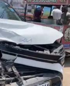
इतनी जोरदार थी कि तीनों वाहन क्षतिग्रस्त हो गए। घटना की सूचना मिलते ही स्थानीय लोग मौके पर पहुंचे और राहत कार्य में जुट गए। कुछ समय के लिए सड़क पर यातायात प्रभावित रहा, लेकिन बाद में क्षतिग्रस्त वाहनों को हटाकर यातायात को सुचारु करा दिया गया।

शाह टाइम्स संवाददाता बागपत। राष्ट्रीय राजमार्ग चोक के पास गुरुवार को एक सड़क हादसे में तीन वाहन आपस में टकरा गए। हादसे में वाहनों को काफी नुकसान पहुंचा, लेकिन किसी के गंभीर रूप से घायल न होने से बड़ा हादसा टल गया।