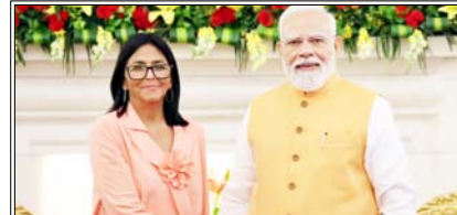
पीएम ने वैश्विक और क्षेत्रीय मुद्दों पर चर्चा के साथ-साथ विकासशील देशों के हितों को बढ़ावा देने पर बात की

नई दिल्ली। भारत और वेनेजुएला ने विशेष रूप से ऊर्जा और उसके साथ-साथ, महत्वपूर्ण खनिज, व्यापार, निवेश, फार्मास्यूटिकल, स्वास्थ्य सेवा तथा ऑटोमोबाइल जैसे क्षेत्रों में सहयोग बढ़ाने पर सहमति व्यक्त करते हुए द्विपक्षीय साझेदारी को और अधिक मजबूत बनाने की प्रतिबद्धता दोहराई है।