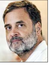
-राहुल गांधी, नेता विपक्ष, लोकसभा