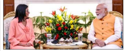
भारत और वेनेजुएला द्विपक्षीय साझेदारी को मजबूत बनाएंगे