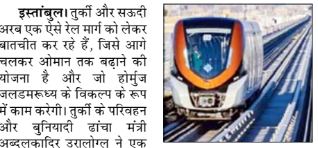
इस्तांबुल। तुर्की और सऊदी अरब एक ऐसे रेल मार्ग को लेकर बातचीत कर रहे हैं, जिससे आगे चलकर ओमान तक बढ़ाने की योजना है और जो होमरुज जलडमरूमध्य के विकल्प के रूप में काम करेगी। तुर्की के परिवहन और बुनियादी ढांचा मंत्री अब्दुलकादिर उरालोग्लू ने एक समाचार एजेंसी को बताया कि यह रेल मार्ग काली हद तक हिजाज रेलवे के रास्ते पर आधारित है।

उन्होंने कहा कि पहले चरण में तुर्की की सीमा से सीरिया के अलेप्पो तक रेल पट्टी का निर्माण करना जरूरी है। वहां से दक्षिण तक का एक हिस्सा पहले से ही बना हुआ है—जॉर्डन और सऊदी अरब की सीमा काली हिस्से पर कोई रेलवे नहीं है, हम अभी सऊदी अरब के साथ इसका रास्ते पर चर्चा कर रहे हैं कि यह रास्ता रियाद की ओर मुड़ेगा या इसे हिजाज तक लाया जाएगा। हमारा अंतिम लक्ष्य ओमान तक रेल मार्ग बनाना है। वास्तव में, हम होमरुज जलडमरूमध्य से बचे रहकर निकलने वाले रास्ते की बात कर रहे हैं। गौरतलब है कि सऊदी अरब के हिजाज क्षेत्र में मक्का और मदीना के बीच पहले से ही एक तेज गति वाली रेल लाइन मौजूद है। उरालोग्लू ने मार्च में कहा था कि तुर्की ऐतिहासिक हिजाज रेलवे के उस हिस्से को फिर से खोलने का काम करने के लिए दक्षिण सीरिया के साथ बातचीत कर रहा था जो कभी इन देशों को आपस में जोड़ता था।