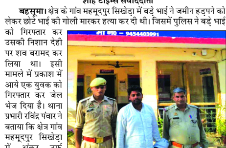
शाह टाइम्स संवाददाता

मृतक के बड़े भाई को पुलिस पहले ही कर चुकी है गिरफ्तार