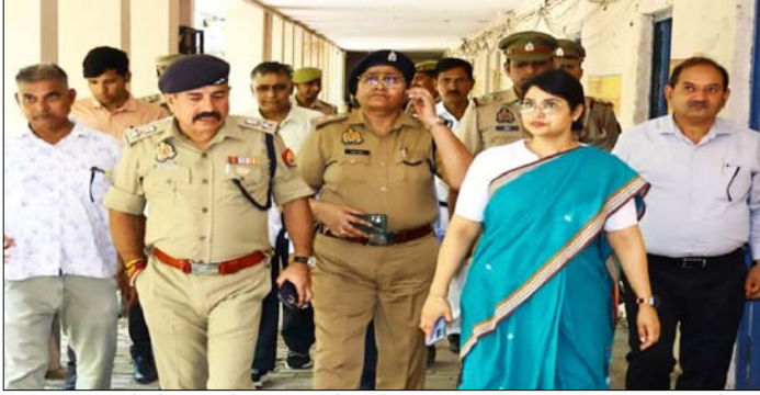
संबंधित व्यवस्थाओं को बारीकी से परखा। अधिकारियों ने केंद्र व्यवस्थापकों एवं ड्यूटी पर तैनात कर्मचारियों को शासन की गाइडलाइन का शत-प्रतिशत पालन सुनिश्चित करने के निर्देश दिए।