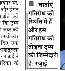
वार्ताएं गतिरोध की स्थिति में हैं और इस गतिरोध को तोड़ना ट्रम्प की जिम्मेदारी है: रेज़ाई

तेहरान। ईरान के वरिष्ठ सलाहकार मो. हसन रेज़ाई ने कहा है कि अमेरिका और ईरान के बीच किसी भी संभावित समझौते की सफलता इस बात पर निर्भर करेगी कि ट्रम्प प्रशासन ईरान की 24 अरब डॉलर की जल्द की हुई संपत्तियों को जारी करने की मांग स्वीकार करता है या नहीं। सीएनएन को दिए एक साक्षात्कार में ईरान के सर्वोच्च नेता अयातुल्ला मोजतबा खामनेई के सैन्य सलाहकार रेज़ाई ने कहा कि अब अगला कदम अमेरिका के राष्ट्रपति डोनाल्ड ट्रम्प को उठाना है। उन्होंने कहा कि वार्ताएं गतिरोध की स्थिति में हैं और इस गतिरोध को तोड़ना ट्रम्प की जिम्मेदारी है। गंद अब ट्रम्प के पाले में है। उन्होंने चेतावनी दी कि यदि सैन्य टकराव फिर शुरू हुआ तो अमेरिका का दायरा फारस की खाड़ी से कहीं आगे तक फैल सकता है। रेज़ाई के अनुसार ईरान चाहता है कि अंतरिम समझौते पर हस्ताक्षर होते ही 24 अरब डॉलर जारी किए जाएं, जबकि शेष 12 अरब डॉलर बाद में दिए जाएं। उन्होंने कहा कि यह राशि जारी करना विश्वास बहाली का महत्वपूर्ण कदम होगा और युद्ध समाप्त करने के लिए समझौते तक पहुंचने में मदद करेगा। उन्होंने कहा कि यदि ट्रम्प वास्तव में ईरान के साथ समझौता करना चाहते हैं तो यह 24 अरब डॉलर विश्वास की परीक्षा है। अमेरिका को यह परीक्षा पास करनी होगी,