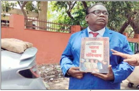
■ शाम को पुलिस ने सीटी बजाकर खाली कराया धरना स्थल

शाह टाइम्स संवाददाता नई दिल्ली। कॉकरोच जनता पार्टी (सीजेपी) ने घोषणा की है कि दिल्ली पुलिस ने शांति से निबट करके प्रस्तावित जंतर-मंतर पर प्रदर्शन के लिए अनुमति दी है। सोशल मीडिया पर अपडेट शेयर करते हुए पार्टी ने कहा था कि अब समर्थक सीधे धरना स्थल पर जा सकते हैं। उन्हें अब संसद स्ट्रीट पुलिस स्टेशन जाने की जरूरत नहीं है, जैसा कि पहले दिल्ली पहुंचने के बाद उनकी पहली मौजिल तय की गई थी। घोषणा के साथ दिए गए राजनीतिक संदेश में जंतर-मंतर पर प्रदर्शन की अनुमति दी है। अब हम सीधे जंतर-मंतर पर इकट्ठा हो सकते हैं, और पहले की योजना के अनुसार संसद स्ट्रीट पुलिस स्टेशन जाने की जरूरत नहीं है। पार्टी ने यह भी लिखा है कॉकरोच आ रहे हैं धर्मप्रधान जा रहे हैं। इसके बाद प्रदर्शन में शामिल होने कई राज्यों से लोग जंतर-मंतर आए और पूरा प्रदर्शन शांतिपूर्ण रहा। शाम 4 बजे से पहले खतम भी हो गया। जंतर-मंतर