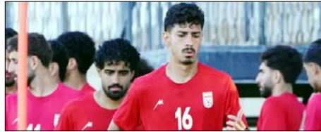
स्टाफ अभी भी वीजा का इंतजार कर रहे हैं। महासंघ का कहना है कि इससे टीम को बराबरी का मौका नहीं मिल रहा है और वह इस मामले को फीफा के सामने उठाएगा। वहीं, अमेरिकी अधिकारियों का कहना है कि सभी खिलाड़ियों, कोच, ट्रेनर और कुछ सपोर्ट स्टाफ को वीजा जारी कर दिया गया है, लेकिन कुछ आवेदनों को मंजूरी नहीं दी गई। ईरानी टीम फिलहाल तुर्किये के अंताल्या में अभ्यास कर रही है और वहां से मेक्सिको के रवाना होगा। फीफा वर्ल्ड कप 2026 का आयोजन 11 जून से 19 जुलाई तक अमेरिका, कनाडा और मेक्सिको में होगा। पहली बार यह टूर्नामेंट तीन देशों की मेजबानी में खेला जाएगा। इसमें 48 टीमों हिस्सा लेंगी।