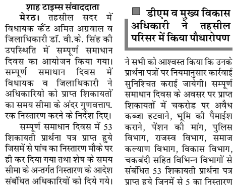
शाह टाइम्स संवाददाता