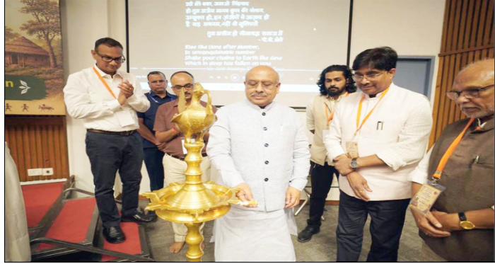
इंडिया इंटरनेशनल सेंटर में आयोजित राष्ट्रीय संगोष्ठी 'भगवान श्री बिरसा मुंडा, जनजातीय भारत में सांस्कृतिक पुनर्जागरण एवं संग्रहालयों में उनका प्रतिनिधित्व' पर आधारित कार्यक्रम का दीप प्रज्वलित कर शुभारंभ करते हुए।

राष्ट्रीय संगोष्ठी 'भगवान श्री बिरसा मुंडा, जनजातीय भारत में सांस्कृतिक पुनर्जागरण एवं संग्रहालयों में उनका प्रतिनिधित्व' को मुख्य अतिथि के रूप में संबोधित करते हुए कही। म्यूजियम एसोसिएशन ऑफ इंडिया द्वारा आयोजित इस संगोष्ठी में संग्रहालय विशेषज्ञों, इतिहासकारों, पुरातत्वविदों, विद्वानों तथा शोधकर्ताओं ने भाग लिया। संगोष्ठी में भगवान श्री बिरसा मुंडा की स्थायी विरासत,