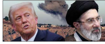
अमेरिका-ईरान फिर सैन्य टकराव के बेहद करीब