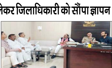
नागरिकों एवं वाहन चालकों द्वारा यह शिकायत प्राप्त हो रही है कि केवल वाराणसी स्थित टोल प्लाजा को लाभ पहुंचाने के उद्देश्य से रिंग रोड पर गंगा नदी के ऊपर बने पुल पर बैरिकेडिंग कर भारी वाहनों की आवाजाही रोक दी गई है। इस