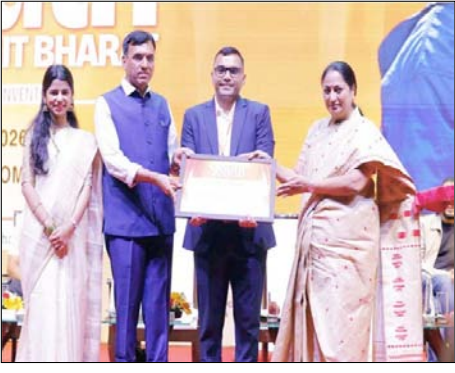
खेल मंत्रालय के अंतर्गत आयोजित 'विकसित भारत के लिए युवा-मेरा भारत युवा सम्मेलन' कार्यक्रम में शामिल हुईं मुख्यमंत्री रेखा गुप्ता।