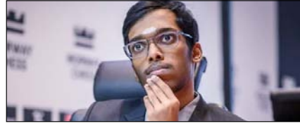
प्रज्ञानंद ने आखिरी राउंड में नॉर्वे चेस 2026 का खिताब जीता