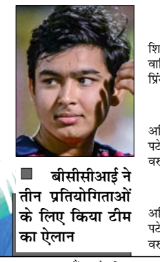
शुरुआत आयरलैंड के खिलाफ बेलफास्ट में 26 और 28 जून को दो टी-20 मैचों से करेगा, जिसके बाद