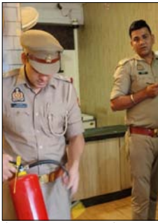
विभिन्न प्रतिष्ठानों तथा गैर-व्यावसायिक संस्थानों का निरीक्षण किया गया। फायर विभाग की टीमों ने मौके पर पहुंचकर भवनों में स्थापित अग्निशमन उपकरणों की

शाह टाइम्स संवाददाता हापुड़। जनपद में अग्नि सुरक्षा व्यवस्थाओं को दुरुस्त करने के लिए अग्निशमन विभाग ने सख्त रुख अपनाते हुए होटलों, रेस्तरां, क्लबों और अन्य व्यावसायिक प्रतिष्ठानों में व्यापक जांच अभियान चलाया। महानिदेशक अग्निशमन एवं आपात सेवा मुख्यालय लखनऊ के निर्देश पर संचालित स्क्रीम संख्या-05 के तहत मुख्य अग्निशमन अधिकारी हापुड़ के निर्देशन में जिले के विभिन्न क्षेत्रों में फायर ऑडिट, अग्निशमन उपकरणों की जांच, प्रशिक्षण तथा मांक ड्रिल का आयोजन किया गया।