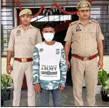
घटना के करीब तीन महीने बाद किशोरी को पेट में दर्द होने पर परिजन डॉक्टर के पास लेकर गए। डॉक्टर ने बताया कि किशोरी

शाह टाइम्स संवाददाता नोएडा। इकोटेक वन कोतवाली पुलिस ने एक युवक को किशोरी से दुष्कर्म करने के आरोप में गिरफ्तार किया। आरोपी पर पारिवारिक रिश्ते की फूफंदी बहन के साथ दुष्कर्म करने का आरोप लगा है। पुलिस द्वारा आरा. पी के खिलाफ आवश्यक कार्रवाई की जा रही है। पुलिस से मिली जानकारी के मुताबिक करीब छह महीने पहले दिल्ली से एक 17 वर्षीय किशोरी लुक्सर गांव में रिश्तेदार के यहां शादी समारोह में आई थी। इसी शादी में उसके परिवार के रिश्ते का ममेरा भाई भी शामिल हुआ था। यहां दोनों करीबी रिश्तेदार के घर में रुके थे। इस बीच आरोपी ने मौका कर किशोरी के साथ दुष्कर्म की घटना को अंजाम दिया।