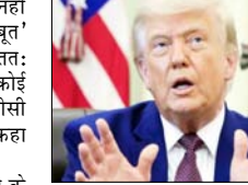
कुछ ऐसी चीजें हैं जिन्हें करने के बारे में उन्होंने कभी नहीं सोचा था, लेकिन अब उन्हें करना पड़ेगा: ट्रम्प

वाशिंगटन। अमेरिका के राष्ट्रपति डोनाल्ड ट्रम्प ने कहा है कि ईरान के साथ जारी युद्ध को समाप्त करने के लिए अभी तक कोई अंतिम समझौता नहीं हुआ है, क्योंकि ईरानी नेतृत्व 'मजबूत' और 'स्वाभिमान' है, लेकिन अंततः उसके पास समझौते के अलावा कोई विकल्प नहीं बचेगा। ट्रम्प ने एनबीसी न्यूज को दिए एक साक्षात्कार में कहा कि वे मजबूत हैं, वे गर्व से भरे हुए हैं। कुछ ऐसी चीजें हैं जिन्हें करने के बारे में उन्होंने कभी नहीं सोचा था, लेकिन अब उन्हें करना पड़ेगा। उनके पास कोई विकल्प नहीं है, हालांकि इसमें थोड़ा समय लगेगा। ट्रम्प की यह टिप्पणी ऐसे समय आई है, जब अमेरिका और ईरान के बीच युद्ध समाप्त करने के लिए चल रही वार्ता चौथे महीने में प्रवेश कर चुकी है। अप्रैल में हुआ युद्धविराम अभी तक किसी तरह कायम है, लेकिन दोनों देशों के बीच कूटनीतिक गतिरोध बना हुआ है। हाल के दिनों में