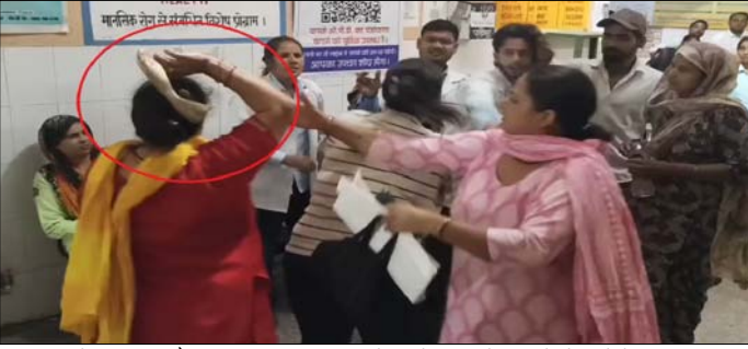
अस्पताल के कर्मचारी और अन्य लोग मौके पर पहुंच गए तथा दोनों पक्षों को शांत कराने का प्रयास किया। बताया जा रहा है कि इस दौरान महिला ने वहां मौजूद कुछ अन्य कर्मचारियों के साथ भी तीखी बहस की। जिसके चलते विवाद ने उग्र रूप ले लिया। घटना का वीडियो सोशल मीडिया पर वायरल होने के बाद लोगों के बीच इसे लेकर चर्चाओं का दौर जारी है। हालांकि वायरल वीडियो और दोनों

जानकारी के अनुसार थाना हापुड़ देहात क्षेत्र स्थित सरकारी सीएचसी अस्पताल में एक महिला अपनी बेटी के साथ आयुष्मान कार्ड बनवाने के लिए पहुंची थी। इसी दौरान किसी बात को लेकर महिला और अस्पताल में कार्यरत ट्रेनी नर्स के बीच विवाद हो गया। प्रत्यक्षदर्शियों के मुताबिक दोनों पक्षों के बीच पहले तीखी नोकझोंक हुई, जिसके बाद मामला हाथापाई में बदल गया। महिला का आरोप है कि अस्पताल में मौजूद नर्सिंग स्टाफ उसकी बेटी को देखकर मुस्कराया और बाद में अपनी एक अन्य साथी को बुलाकर भी कुछ कहा, जिसके बाद दोनों हंसते हुए वहां से चली गईं। महिला का कहना है कि जब उसने इस बारे में आपत्ति जताई और कारण पूछा तो उसके साथ अभद्र व्यवहार किया गया। विवाद बढ़ने पर महिला का गुस्सा फूट पड़ा और उसने ट्रेनी नर्स के साथ मारपीट कर दी। घटना के दौरान अस्पताल परिसर में अफरा-तफरी का माहौल बन गया। शोर-शराबा सुनकर