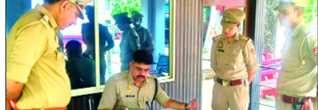
शाह टाइम्स संवाददाता