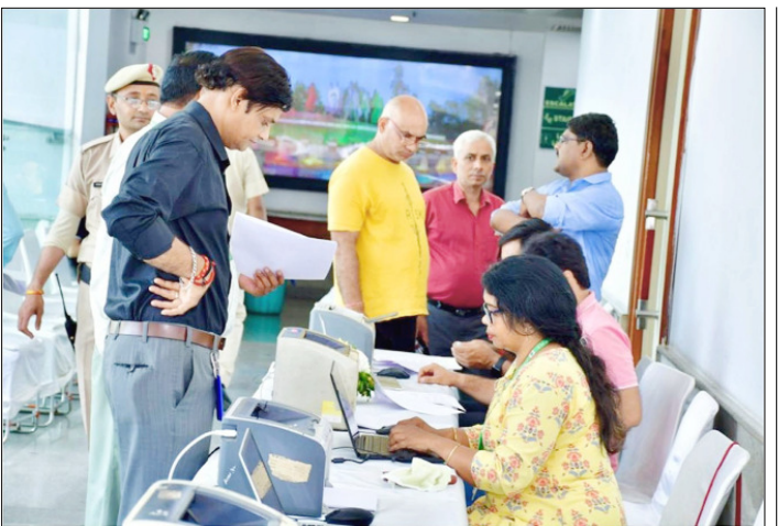
नई दिल्ली नगरपालिका परिषद् (एनडीएमसी) ने जय सिंह रोड स्थित एनडीसीसी कन्वेंशन सेंटर में आयोजित 'सुविधा शिविर' में शिकायतों को निबटारा करत अधिकारियों।

अंदर जाने पर वह सोफे के पास मुत अवस्था में पड़ी मिली। उन्होंने जानकारी पुलिस को दी। पुलिस के अधिकारिक सूत्रों ने कहा कि आरोपियों की तलाश के लिए सात टीम गठित की गई है। तीन टीमें यूपी, हरियाणा और दूसरे राज्य में गई है। चार टीमें दिल्ली में छापेमारी कर रही है। पुलिस ने जांच के दौरान अपार्टमेंट के सीसीटीवी कैमरे की जांच कर 180 लोगों की जानकारी हासिल की। जिसमें से 167 अन्य पहचान कर ली गई है। 13 अन्य संदिग्धों की पहचान की जा रही है। चार टीमें दिल्ली में छापेमारी कर रही है। इसमें भी चार मुख्य संदिग्ध हैं, जो कैब में दिखाई पड़े हैं। जिसमें महिला भी शामिल है।