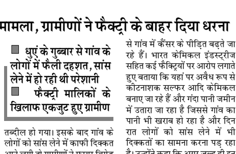
शाह टाइम्स संवाददाता

अच्छरोन्डा गांव का है मामला, ग्रामीणों ने फैंक्ट्री के बाहर दिया धरना