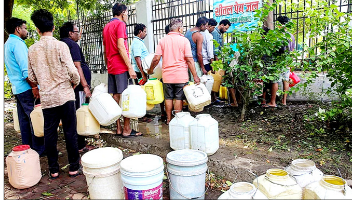
मोपाल। कोला जल आपूर्ति की मरम्मत पूरी न हो पाने के कारण आपूर्ति बाधित होने से पानी भरने के लिए कतार में खड़े लोग।

वाशिंगटन। अमेरिका ने शुक्रवार को ईरान के खिलाफ बड़ी आर्थिक कार्रवाई करते हुए उसके एक 'संगठित नेटवर्क' पर नए प्रतिबंधों का एलान किया है। अमेरिकी प्रशासन के अनुसार, यह नेटवर्क 'अवैध ऊर्जा व्यापार और वैश्विक वित्तीय धोखाधड़ी' में लिप्त था। इसके जरिए दक्षिण और पूर्वी एशिया के बाजारों में करोड़ों डॉलर मूल्य की ईरानी एलपीजी की तस्करी की जा रही थी। अमेरिकी विदेश और वित्त मंत्रालय के जारी बयानों के मुताबिक ईरान इसे ओमान जैसे तीसरे देशों का बताकर बेच रहा था। इस पूरे खेल को छिपाने के लिए संयुक्त अरब अमीरात (यूएई) और चीन में सक्रिय मुखौटा कंपनियों के साथ-साथ ईरान के जहाजों के लिए छद्म बेड़े का इस्तेमाल किया जा रहा था। ये जहाज अपनी पहचान और ईंधन के ईरानी मूल को छिपाकर परिवहन कर रहे थे।