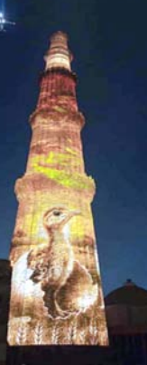
मिलने लगी है। गोडावण, ग्रेट इंडियन बस्टर्ड को राष्ट्रीय स्तर पर भी नई पहचान मिली, जब

नई दिल्ली। दिल्ली के सबसे प्रसिद्ध स्मारकों में से एक कुतुब मीनार पर भारत के सबसे दुर्लभ पक्षियों में शामिल गोडावण, ग्रेट इंडियन बस्टर्ड की कहानी को खास अंदाज में प्रस्तुत किया गया। कई वर्षों से गोडावण की घटती संख्या संरक्षण से जुड़े लोगों के लिए चिंता का विषय रही है। एक समय इस पक्षी को भारत का राष्ट्रीय पक्षी बनाए जाने की चर्चा भी हुई थी, लेकिन देश के घास के मैदानों में इनकी संख्या लगातार कम होती गई और वे धीरे-धीरे लोगों की नजरों से दूर हो गए। हालांकि, पिछले कुछ वर्षों में हुए संरक्षण प्रयासों से अब इसकी वापसी की उम्मीद बढ़ी है और इस पक्षी को फिर से पहचान मिलने लगी है। गोडावण, ग्रेट इंडियन बस्टर्ड को राष्ट्रीय स्तर पर भी नई पहचान मिली, जब