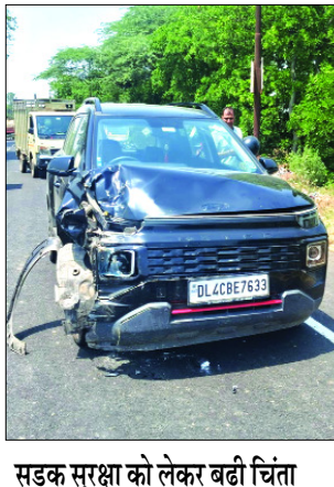
सड़क सुरक्षा को लेकर बढ़ी चिंता