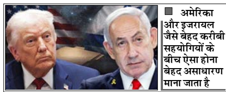
अमेरिका और इजरायल जैसे बेहद करीबी सहयोगियों के बीच ऐसा होना बेहद असाधारण माना जाता है

वाशिंगटन। अमेरिका और इजरायल के बीच ईरान को लेकर मतभेद बढ़ रहे हैं। इस बीच अमेरिकी रक्षा विभाग (पेंटागन) के भीतर यह चिंता बढ़ गई है कि इजरायल अमेरिकी अधिकारियों और ट्रम्प सरकार की अंदरूनी जानकारी जुटाने के लिए जासूसी की कोशिश कर रहा है। एक रिपोर्ट के मुताबिक दो मोज़ेदा और एक पूर्व अमेरिकी अधिकारी ने बताया कि पेंटागन की डिफेंस इंटेलिजेंस एजेंसी (डीआईए) ने हाल ही में इजरायल से जुड़े काउंटर-इंटेलिजेंस खतरे का स्तर बढ़ाकर 'क्रिटिकल' कर दिया है। यह एजेंसी का सबसे गंभीर अलर्ट माना जाता है। अमेरिका और इजरायल जैसे बेहद करीबी सहयोगियों के बीच ऐसा होना बेहद असाधारण माना जाता है। हालांकि इजरायल ने इन आरोपों