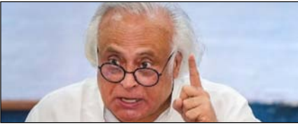
सीबीएसई में अनियमितताएं धर्मप्रधान की अक्षमता का प्रमाण: कांग्रेस

नई दिल्ली, मुजफ्फरनगर, देहरादून, हल्द्वानी, मुगदाबाद, बरेली, मेरठ व लखनऊ से प्रकाशित