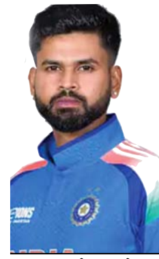
श्री अय्यर भारतीय पुरुष टी-20 क्रिकेट टीम के इतिहास में 15वें कप्तान होंगे। भारत अपने दौरे की

मुम्बई। भारतीय क्रिकेट कंट्रोल बोर्ड (बीसीसीआई) ने शनिवार को आयरलैंड और इंग्लैंड के आगामी दौर (जून-जुलाई) और सितम्बर से जापान में होने वाले 2026 एशियाई खेलों के लिए श्रेयस अय्यर को राष्ट्रीय टी-20 टीम का नया कप्तान बनाया है। राष्ट्रीय टीम चयनकर्ताओं युवा आतिथी बल्लेबाज वैभव सूर्यवंशी को भी टीम में शामिल किया है। तिलक वर्मा भारतीय टीम के उपकप्तान होंगे। इसके अलावा 15 वर्षीय युवा सनसनी वैभव सूर्यवंशी को पहली बार राष्ट्रीय टीम में शामिल किया गया है। उन्होंने तीनों टीमों जगह मिली है। टीम में हर्षित राणा की भी वापसी हुई है, जिन्होंने आखिरी बार इस साल फरवरी की शुरुआत में कोई प्रतिस्पर्धी मैच खेला है। सूर्यकुमार