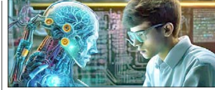
AI के सबसे अच्छे 5 कोर्स: नहीं होगी नौकरी की दिक्कत