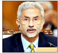
कहा: इससे अवैध कब्जा वैध नहीं होगा, 7 जून को 24 सीटों पर वोटिंग

नई दिल्ली। भारत ने पाकिस्तान के कब्जे वाले गिलगित-बाल्टिस्तान में 7 जून को होने वाले विधानसभा चुनावों का कड़ा विरोध किया है। विदेश मंत्रालय ने जारी बयान में कहा कि पाकिस्तान जिस क्षेत्र पर अवैध और जबरन कब्जा किए हुए है, वहां चुनाव कराने की उसकी योजना पूरी तरह अस्वीकार्य है। विदेश मंत्रालय ने कहा कि पूरा जम्मू-कश्मीर और लद्दाख, जिसमें गिलगित-बाल्टिस्तान भी शामिल है, भारत का अभिन्न और अविभाज्य हिस्सा है। इसलिए पाकिस्तान को उन क्षेत्रों में किसी भी तरह की राजनीतिक प्रक्रिया चलाने का कोई अधिकार नहीं है। चुनाव कराने जैसी गतिविधियां वहां की जमीनी हकीकत को नहीं बदल सकती। गिलगित-बाल्टिस्तान में सितंबर 2025 में अपना कार्यकाल पूरा कर लिया था। नियमों के मुताबिक इसका बाद नए चुनाव कराए जाने थे, लेकिन खराब मौसम और प्रशासनिक कारणों से मतदान समय पर नहीं हो सका। क्षेत्र में होने वाले हर चुनाव या राजनीतिक कदम पर भारत आमतौर पर आपत्ति दर्ज करता है।