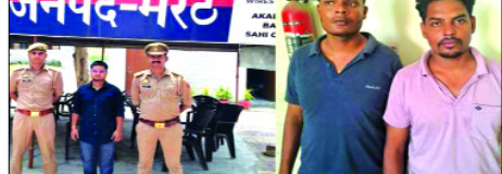
शाह टाइम्स संवाददाता