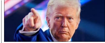
डोनाल्ड ट्रम्प की ईरान को नई धमकी