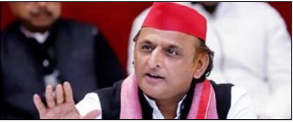
हुगली में टीएमसी सांसद कल्याण बनर्जी पर हमले की अखिलेश यादव ने की निंदा

नई दिल्ली, मुजफ्फरनगर, देहरादून, हल्द्वानी, मुरादाबाद, बरेली, मेरठ व लखनऊ से प्रकाशित