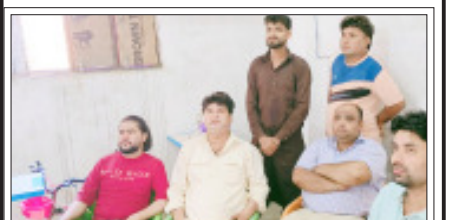
सम्भल-चौधरी सराय में पीएम मोदी के मन की बात सुनते भाजपा पदाधिकारी।