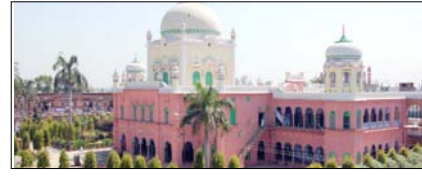
छोटे से मदरसे से विश्व विख्यात संस्था बनना मामूली बात नहीं