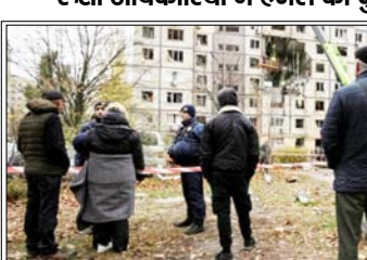
परमाणु संयंत्र पर हमले का आरोप किया खारिज रूसी अधिकारियों ने हमले की पुष्टि की

मास्को। यूक्रेन ने शनिवार रात से रविवार तक रूस के ऊर्जा टिकानों पर नए हमले किए। रूसी अधिकारियों ने इसकी पुष्टि की है। वहीं, कीव ने रूस के उस दावे को खारिज कर दिया, जिसमें कहा गया था कि एक यूक्रेनी ड्रोन ने क्रैमलिन के कब्जे वाले एक अहम परमाणु संयंत्र पर हमला किया। एसोसिएटेड प्रेस की रिपोर्ट में यह जानकारी दी गई।