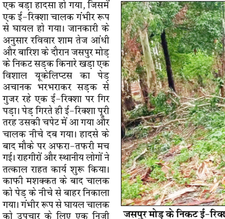
जसपुर मोड़ के निकट ई-रिक्शा पर गिरा यूकेलिप्टस का पेड़, हादसे में चालक गंभीर रूप से घायल।

हवाओं और मूसलाधार बारिश के कारण कई स्थानों पर पेड़ गिर गए, बिजली आपूर्ति प्रभावित हुई तथा लोगों को आवागमन में भी भारी परेशानियों का सामना करना पड़ा। हालांकि बारिश से भीषण गर्मी से राहत मिली, लेकिन इसके साथ आई आंधी ने कई जगह नुकसान भी पहुंचाया।