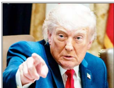
हम एक बहुत अच्छे समझौते के करीब हैं अगर हम इसे कर लेते हैं, तो अच्छा है: ट्रम्प

कहा: अमेरिका ईरान से बहुत अच्छे समझौते के करीब, नहीं बनी बात, तो अपनाएंगे दूसरा रास्ता