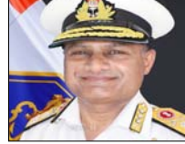
एडमिरल त्रिपाठी 31 मई को अपनी सेवा से हो गए थे रिटायर

पद संभालने के बाद उन्हें साउथ ब्लॉक परिसर में औपचारिक गार्ड ऑफ ऑनर दिया गया। इसके साथ ही वे भारतीय नौसेना के 27वें नौसेना प्रमुख बन गए हैं। दूसरी तरफ, निवर्तमान नौसेना प्रमुख एडमिरल दिनेश कुमार त्रिपाठी ने राष्ट्रीय युद्ध स्मारक जाकर देश के लिए बलिदान देने वाले वीर सैनिकों को श्रद्धांजलि दी। एडमिरल दिनेश