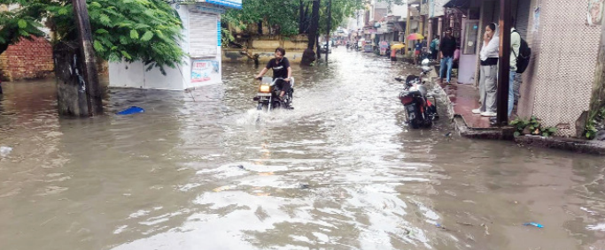
ठाकुरद्वारा। मुंसिफ कोर्ट रोड पर जलभराव के बीच बंद पड़ी बाइक।

कि यदि समय रहते नालों और नालियों की सफाई कराई जाती तो यह स्थिति पैदा नहीं होती। लोगों ने नगर पालिका प्रशासन से जल निक. इसी व्यवस्था को दुरुस्त करने और जलभराव वाले क्षेत्रों के लिए स्थायी समाधान कराने की मांग की है। बारिश के बाद मौसम जरूर सुहावा हो गया और तापमान में गिरावट दर्ज की गई। लेकिन नगर की सड़कों पर भरे पानी ने यह सवाल जरूर छोड़ दिया कि आखिर हर साल बरसात से पहले होने वाले सफाई अभियानों का लाभ जनता को क्यों नहीं मिल पाता।