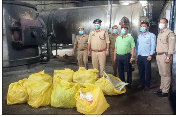
प्रक्रिया को पूरी पारदर्शिता और विधिक प्रावधानों के अनुरूप संपन्न कराया