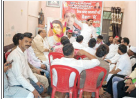
सम्भल-महाराणी अहिल्याबाई होल्कर जयंती पर बोलेती सपा जिलाध्यक्ष।