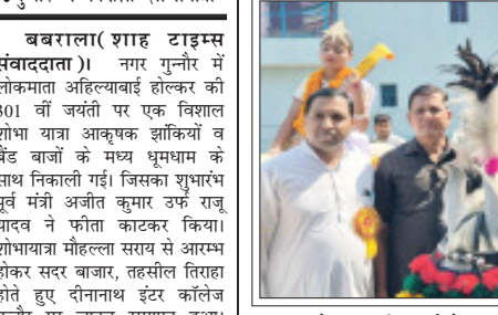
सम्भल- लोकमाता अहिल्याबाई होल्कर जयंती पर शोभायात्रा निकालते।