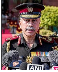
कहा: उनका मुख्य ध्यान सशस्त्र बलों के संगठनात्मक सुधारों पर होगा

नई दिल्ली। जनरल एनएस राजा सुब्रमणि ने रविवार को भारत के नए चीफ ऑफ डिफेंस स्टाफ (सीडीएस) के रूप में कार्यभार संभाल लिया। उन्हें पाकिस्तान और चीन के मामलों का बड़ा विशेषज्ञ माना जाता है। उनका मुख्य उद्देश्य महत्वकांक्षी मिलिट्री थिएटरेशन (सैन्य थिएटराइजेशन) योजना को लागू करना और तीनों सेनाओं के बीच तालमेल को मजबूत करना है। उन्होंने जनरल अमिल चौहान को जगह ली है। जनरल सुब्रमणि ने अपने पूर्ववर्तियों, दिवंगत जनरल बिपिन रावत और जनरल अमिल चौहान के शानदार नेतृत्व और योगदान के प्रति आभार जताया। जनरल चौहान शनिवार को देश के सबसे वरिष्ठ सैन्य कमांडर के रूप में अपना कार्यकाल पूरा करके सेवानिवृत्त हुए। जनरल सुब्रमणि इससे पहले राष्ट्रीय सुरक्षा परिषद सचिवालय (एनएससीएस) में सैन्य सलाहकार के रूप में काम कर रहे थे। वह पिछले साल 31 जुलाई को