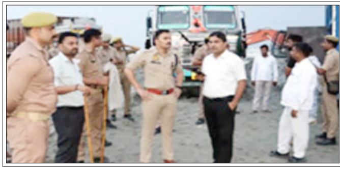
सम्भल। अवैध खनन की सूचना पर पहुंचे डीएम एसपी निरीक्षण करते।

शाह टाइम्स ब्यूरो सम्भल। अवैध खनन को लेकर डीएम की सख्ती का असर होने लगा है। जिलाधिकारी और पुलिस अधीक्षक के कड़े निर्देशों पर परिवहन और खनन विभाग के अधिकारियों ने करने के साथ पांच बड़ी कार्रवाई की। डीएम एसपी ने किया जांच कर के अवैध खनन का चालान कर 10,69,070 रुपये का अर्थदंड से अधिरोपित किया। जनपद में अवैध खनन का काला कारोबार जमकर जारी है। जिलाधिकारी और पुलिस अधीक्षक के अवैध खनन पर सख्त तेवर है। शनिवार को डीएम और एसपी की सख्ती का असर दिखायी दे गया। तहसील गुनौर के जुनावई थाना क्षेत्र के असदपुर में डीएम और एसपी के निरीक्षण के बाद थाना पुलिस ने गंगा किनारे किये गए निरीक्षण में अवैध रूप से खनन करने वालों पर बड़ी कार्रवाई की। पुलिस ने 27 लोगों को हिरासत में