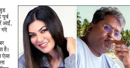
सुष्मिता को अपनी लाइफ के सबसे जरूरी लोगों में से एक बताया और खुलासा किया कि उनके ब्रेकअप में दूरी ने अहम भूमिका निभाई थी। लंदन में रहने वाले इस करोबारी के अनुसार, दोनों के बीच कोई ड्रामेटिक ब्रेकअप नहीं हुआ था। बल्कि, धीरे-धीरे दोनों की जिवरगी अलग-अलग डायरेक्शन में आगे बढ़ गई थी, सुष्मिता भारत में बस गईं और वह लंदन में रहने लगे थे। अपने रिश्ते को याद करते हुए उन्होंने कहा कि सुष्मिता मेरे लिए बहुत खास थीं। उन्होंने मुझे कई मायनों में मंच्योर होने में मदद की और वह

नई दिल्ली। 2022 में जब बॉलीवुड एक्ट्रेस सुष्मिता सेन और आईपीएल के पूर्व बांस ललित मोदी के अफेयर की खबर आई, तो दुनिया ने सुष्मिता को न जाने कितने गंदे ताने दिए थे, लेकिन मंगलवार को एंटरटेनमेंट की दुनिया से एक ऐसी खबर आई है जिसने हर किसी को चौंका दिया है। खुद ललित मोदी ने इस राज पर से ऐसा पर्दा उठाया है कि टूलर्स के मुंह पर ताला लग गया है। ललित मोदी ने साफ कह दिया है कि भाई साहब, सुष्मिता मेरे पैसों पर नहीं पल रही थीं, बल्कि कहानी तो एकदम उल्टी थी। ललित मोदी ने ये भी खुलासा किया कि वे एक्ट्रेस के खर्च पर पलने वाले बॉयफ्रेंड थे। दरअसल हुमन्स ऑफ बॉम्बे के साथ हाल ही में हुई बातचीत में ललित मोदी ने