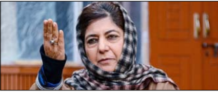
महबूबा ने की जम्मू-कश्मीर पर संवाद के लिए साझा प्रतिनिधिमंडल भेजने की अपील

नई दिल्ली, मुजफ्फरनगर, देहरादून, हल्द्वानी, मुरादाबाद, बरेली, मेरठ व लखनऊ से प्रकाशित