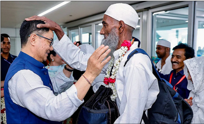
नई दिल्ली: आईजीआई हवाई अड्डे के टर्मिनल-3 पर सऊदी अरब से लौटने वाली पहली उड़ान से आए एक हज यात्री का अभिवादन करते केंद्रीय मंत्री किरन रिजिजू

प्रधानमंत्री रिसर्च चेर योजना के लिए आवेदन शुरू नई दिल्ली। शिक्षा मंत्रालय के उच्च शिक्षा विभाग की ओर से प्रधानमंत्री रिसर्च चेर (पीएमआरसी) योजना 2026 के लिए आवेदन शुरू हो गए हैं। शिक्षा मंत्रालय ने मंगलवार को बताया कि पीएमआरसी केंद्र सरकार की एक प्रमुख राष्ट्रीय पहल है जिसका उद्देश्य दुनिया भर में कार्यरत भारतीय मूल के उत्कृष्ट शोधकर्ताओं, वैज्ञानिकों, तकनीकी विशेषज्ञों और पेशेवरों को भारत के शीर्ष उच्च शिक्षण संस्थानों, राष्ट्रीय प्रयोगशालाओं और अनुसंधान केंद्रों से जोड़ना है।