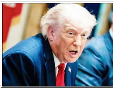
नेतन्याहू ने सेना को लेबनान में अपने जमीनी अभियान का विस्तार करने का निर्देश दिया है। इजरायल ने नबातिएह शहर के निकट एक रणनीतिक पहाड़ी पर स्थित ऐतिहासिक व्यूफोर्ट किले पर भी कब्जा कर लिया है।

इजरायल के पीएम नेतन्याहू को फोन कर फटकार लगाई, कहा- पागल हो गए हो क्या, तुरंत ये सब रोको