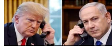
लेबनान पर इजरायली हमले से ट्रंप नाराज, नेतन्याहू को फटकार लगाई