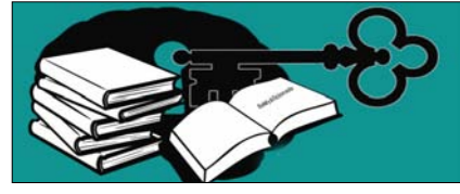
दूते भरोसे के वेंटिलेटर पर देश की परीक्षा व्यवस्था