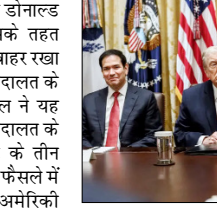
संघीय अपील अदालत के न्यायाधीशों के एक विभाजित पैनल ने यह फैसला सुनाया