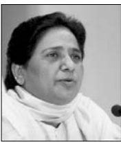
—सुरभी मयावती अध्यक्ष, बहुजन समाज पार्टी