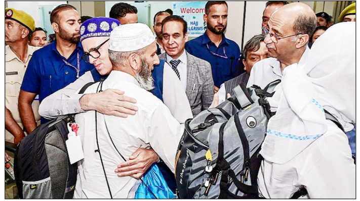
श्रीनगर। हवाई अड्डे पर मक्का से आने वाले हज यात्रियों के पहले जट्टे का स्वागत करते जम्मू-कश्मीर के मुख्यमंत्री उमर अब्दुल्ला।

नई दिल्ली। दक्षिण अफ्रीका के उपराष्ट्रपति शिपोकोसा पोल्लुस माशातिले ने मंगलवार को यहां उपराष्ट्रपति सीपी राधाकृष्णन से मुलाकात की और द्विपक्षीय संबंधों को और मजबूत बनाने की प्रतिबद्धता जताई। दोनों नेताओं ने भारत-दक्षिण अफ्रीका द्विपक्षीय संबंधों को और सुदृढ़ बनाने पर सार्थक चर्चा की, जिसमें व्यापार, निवेश, रक्षा सहयोग, कौशल विकास तथा जन-से-जन संबंधों को मजबूत करने पर विशेष ध्यान दिया गया। उन्होंने विकासशील देशों की प्राथमिकताओं को आगे बढ़ाने तथा ब्रिक्स, जी-20, इन्फ्रा और हिंद महासागर तटीय संघ जैसे बहुपक्षीय मंचों में सहयोग बढ़ाने पर भी विचारों का आदान-प्रदान किया। दोनों नेताओं ने द्विपक्षीय आर्थिक संबंधों की पूर्ण क्षमता का उपयोग करने के उपायों पर चर्चा की।