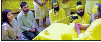
आरसीबी की जीत के बाद वृंदावन पहुंचे विराट-अनुष्का