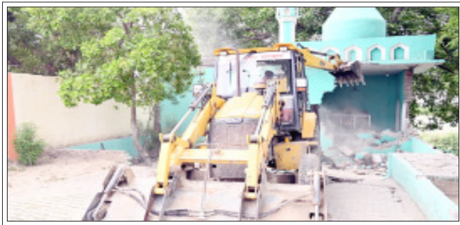
सम्भल। गुनौर तहसील के गांव बाघऊ में मजार को ध्वस्त करता बुल्डोजर जस्टिस।

नखसा कोतवाली क्षेत्र स्थित ग्राम कसेरवा में गाटा संख्या 409 रकबा 0.028 है. ग्राम समाज की भूमि पर कब्रिस्तान पर बने होने के आरोप में तहसीलदार अदालत में चले वाद में 21 अप्रैल 2026 को बंदखली के आदेश पारित किए गए थे। बताया जा रहा है आदेश को इतने दिन बाद भी अवैध कब्जे को हटाना नहीं गया है। और न ही अपील न्यायालय का ही कोई स्थगनादेश ही प्रस्तुत किया गया है। जबकि बंदखली का आदेश हुए एक माह पंद्रह दिन मा समय बात गया है। ग्राम कसेरवा में गाटा