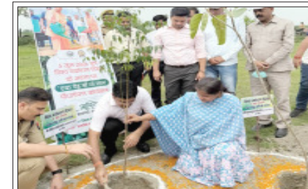
बबराला-गंगाघाट राजघाट पर एक पेड़ मां के नाम का लगाते डीएम व एसपी।

अक्सोजन हमारे जीवन को समृद्ध बना सके और हमें जीवनदान मिल सके। उन्होंने व्यर्थ में बह रहे पानी को बचाने की भी आवश्यकता बताई। ताकि आने वाली पीढ़ी भी इस पानी का इस्तेमाल कर सके। अधिशासी अधिकारी ने गोशाला का निरीक्षण भी किया तथा लेखा लिपिक रईस अहमद से गावों की संख्या उनके रख-रखाव की जानकारी कर गोशाला में सभी तरह की व्यवस्थाओं को दुरुस्त रखने के निर्देश दिए। बहजौड़- विश्व पर्यावरण दिवस के अवसर पर बहजौड़ एक्स्प्लोटेक्स क्लब के तत्वावधान में एक विशेष पर्यावरण जागरूकता अभियान आयोजित किया गया। कार्यक्रम की विशेषता यह रही कि 5 जून को प्रातः 5 बजे क्लब के 5 सदस्यों ने 5 किलोमीटर की साइकिल यात्रा कर 5 औषधीय एवं उपयोगी पौधों का रोपण किया। अभियान में प्रतिभागी पांच प्रतिनिधि के रूप में सम्भव