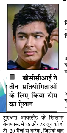
शुरुआत आयरलैंड के खिलाफ बेलफास्ट में 26 और 28 जून को दो टी-20 मैचों से करेगा, जिसके बाद