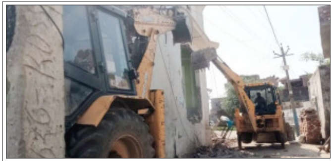
सम्भल। ग्राम कसेरवा में दो मंजिला मस्जिद को ध्वस्त करते दो-दो बुल्डोजर जस्टिस।