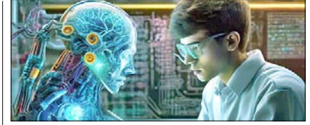
AI के सबसे अच्छे 5 कोर्स: नहीं होगी नौकरी की दिक्कत