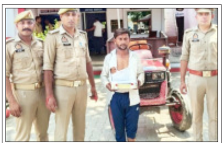
सिरसी- डेढ़ लाख की लूट की झूठी सूचना देने का ट्रेक्टर के साथ आरोपी।

सिरसी। थाना हजरत नगर राठी की कस्बा स्थित पुलिस चौकी प्रभारी ने झूठी लूट का खुलासा कर नकदी व ट्रेक्टर के साथ गिरफ्तार कर लिया।