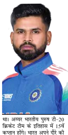
श. अय्यर भारतीय पुरुष टी-20 क्रिकेट टीम के इतिहास में 15वें कप्तान होंगे। भारत अपने दौरे की

यादव को टीम में जगह भी नहीं मिली है। वहीं, चरेलु मैदान पर विश्वकप के दौरान नौ पारियों में 136.72 के स्ट्राइक रेट से 242 रन बनाने वाले 35 साल के सूर्यकुमार को खराब फॉर्म के कारण टीम से बाहर कर दिया गया। आईपीएल 2026 में भी उन्होंने मुम्बई इंडियंस के लिए 13 पारियों में 270 रन बनाए थे। बीसीसीआई ने टीम के नेतृत्व में यह बदलाव लॉस एंजेलिस 2028 ओलंपिक और उसी साल ऑस्ट्रेलिया और न्यूजीलैंड में होने वाले टी-20 वर्ल्ड कप को ध्यान में रखते हुए एक नई टी-20 टीम तैयार करने को लिए किया है। इस सीजन में पंजाब किंग्स के साथ प्लेऑफ में जगह बनाने से मामूली अंतर से चुकने के बावजूद, अय्यर ने 14 मैचों में शानदार 498 रन बनाए। इसमें उनका पहला आईपीएल शतक भी शामिल