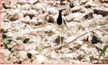
शाह टाइम्स संवाददाता नहटौर। क्षेत्र में ममता और जीव प्रेम की एक अनूठी मिसाल देखने को मिली है। गांव फिरोजपुर के एक खेत में जुताई के दौरान एक टीटरी (रेड-वॉल्टेज लैपविंग) पक्षी ने अपने अंडों को ट्रेक्टर से बचाने के लिए डटकर मुकाबला किया। ट्रेक्टर चालक

की सूझबूझ और पक्षी की ममता ने अंडों को सुरक्षित बचा लिया। प्रकृति के अनमोल रिश्ते और ममता की एक ऐसी तस्वीर सामने आई है, जिसे देखकर हर किसी का दिल पिघल जाए। एक खेत में ट्रेक्टर से जुताई के दौरान टीटरी पक्षी की ममता और बहादुरी ने न केवल ट्रेक्टर चालक को हैरान