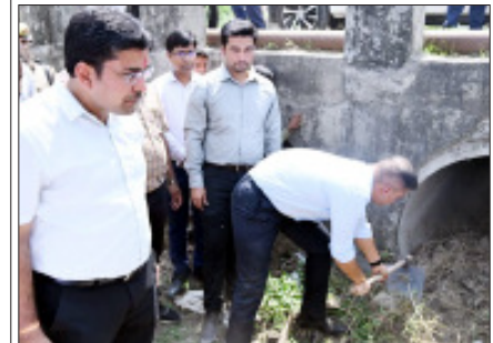
बबराला- वर्धमा नदी के पुनरुद्धार कार्य का फावड़ा चलाकर शुभारम्भ करते एसपी।