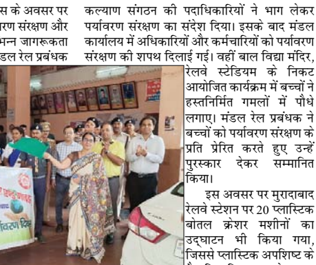
मिलेगा। उत्तर रेलवे भारत स्काउट्स एवं गाइड्स द्वारा स्टेशन परिसर में नुककड़ नाटक प्रस्तुत कर यात्रियों को पर्यावरण संरक्षण का संदेश दिया गया। साथ ही जन-जागरूकता रैली का आयोजन किया गया, जिसमें मंडल रेल प्रबंधक ने हरी झंडी दिखाकर स्वाना किया। प्लास्टिक के उपयोग को रोकने के उद्देश्य से यात्रियों को निशुल्क कपड़े के हैंडबैग भी वितरित किए गए। रेलवे स्टेशन से शुरू हुई रैली विभिन्न रेलवे कॉलोनिजों से होकर स्काउट्स हवर्स पर संपन्न हुई। रेलवे प्रशासन ने पर्यावरण संरक्षण, स्वच्छता और सतत विकास के प्रति अपनी प्रतिबद्धता दोहराई।

मुरादाबाद। विश्व पर्यावरण दिवस के अवसर पर उत्तर रेलवे के मुरादाबाद मंडल में पर्यावरण संरक्षण और स्वच्छता को बढ़ावा देने के लिए विभिन्न जागरूकता कार्यक्रमों का आयोजन किया गया। मंडल रेल प्रबंधक कल्याण संगठन की पदाधिकारियों ने भाग लेकर पर्यावरण संरक्षण का संदेश दिया। इसके बाद मंडल कार्यालय में अधिकारियों और कर्मचारियों को पर्यावरण संरक्षण की शपथ दिलाई गई। वहीं बाला विद्या मंदिर, रेलवे स्टेडियम के निकट आयोजित कार्यक्रम में बच्चों ने हस्तनिर्मित मालों में पौधे लगाए। मंडल रेल प्रबंधक ने बच्चों को पर्यावरण संरक्षण के प्रति प्रेरित करते हुए उन्हें पुरस्कार देकर सम्मानित किया। इस अवसर पर मुरादाबाद रेलवे स्टेशन पर 20 प्लास्टिक बोतल क्रेशर मशीनों का उद्घाटन भी किया गया, जिससे प्लास्टिक अपशिष्ट के वैज्ञानिक निस्तारण को बढ़ावा