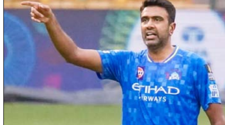
दिलचस्प मिसाल है। मैं एक पल के लिए खूद को सूर्यकुमार यादव की जगह रखकर सोचता हूँ कि इस समय वह कैसा महसूस कर रहे होंगे। मुझे यकीन है कि किसी भी खिलाड़ी को टीम से बाहर किए जाने पर दुखी होने का पूरा हक है और अगर वह युवा महसूस कर रहे हैं, तो वह पूरी तरह जायज है। उन्होंने कहा, 'प्लेकिन जिस तरह यह फेसला लिया गया है, उसे लेकर मुझे थोड़ी झिझक है क्योंकि मैं अपने मन में सोच रहा हूँ--- अगर मैं खूद को सूर्यकुमार की जगह रखूँ तो? ठीक है, मेरी बल्लेबाजी को टीम में मिलाते 18 महीनों या 15 महीनों में मेरा साथ नहीं दे पाया। मैं उस स्तर पर नहीं खेले पाया, जैसा खेल सकता था। लेकिन फिर भी मैं देश के लिए टी

नई दिल्ली। पूर्व भारतीय स्पिनर आर अश्विन का मानना है कि सूर्यकुमार यादव को बल्लेबाज के रूप में खूद को साबित करने के लिए थोड़ा और समय दिया जा सकता था, बजाय इसके कि टी 20 विश्व कप खिताब जिताने के सिर्फ दो महीने बाद ही उन्हें भारत की टी20 टीम से पूरी तरह बाहर कर दिया जाए। बल्लेबाज के तौर पर सूर्यकुमार का टी-20 विश्व कप साधारण रहा था। उन्होंने 136-72 के स्ट्राइक रेट से 242 रन बनाए थे। इसके बाद आईपीएल में भी वह लय हासिल नहीं कर सके और 147-54 के स्ट्राइक रेट से 270 रन ही बना पाए। ईएसपीएन क्रिकेटफो के वीडियो शो में अश्विन ने कहा, 'प्लेखिए, मुझे लगता है कि यह एक बहुत