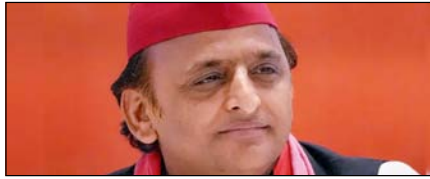
अखिलेश यादव ने राम मंदिर में चढ़ावे की रकम को लेकर उठाए गंभीर सवाल पेज 2

नई दिल्ली, मुजफ्फरनगर, देहरादून, हल्द्वानी, मुरादाबाद, बरेली, मेरठ व लखनऊ से प्रकाशित