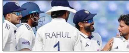
मुल्लापुर टेस्ट: भारत ने कसा अफगानिस्तान पर शिकंजा खेल टाइम्स