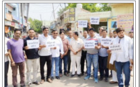
सम्भल- दुष्कर्म पीड़िता के इंसाफ की मांग को प्रदर्शन करते स्वयं संचालित संगठन के लोग।

सम्भल। सामूहिक दुष्कर्म घटना और पुलिस पर सवाल खड़े करने के साथ आरोपियों की गिरफ्तार कर पीड़ित को न्याय दिलाने की मांग को सामाजिक संगठनों का गुस्सा फूट पड़ा। गुस्सा संगठन के कार्यकर्ताओं ने प्रदर्शन कर मामले की निष्पक्ष जांच करने की मांग की। असमोली थाना क्षेत्र के दबाई कला में शौच को गयी नाबालिग का अपहरण का सामूहिक दुष्कर्म का मामला तुरंत पकड़ता जा रहा है। पीड़िता को न्याय और आरोपियों पर सख्त कार्रवाई की मांग को संगठनों ने अपनी आवाज बुलंद करनी शुरू कर दी है। ब्राह्मण शक्ति संघ ने पीड़ित परिवार के साथ अत्याच नहीं होने और मामले की निष्पक्ष जांच की मांग को शक्ति संघ पर प्रदर्शन किया।