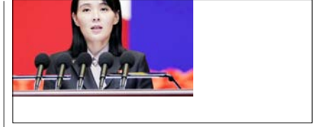
उत्तर कोरिया ने अमेरिका को दी खुली चुनौती, परमाणु हथियार नहीं छोड़ेगे पेज 12