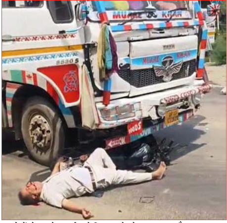
कब्जे में लेकर पोस्टमार्टम के लिए भेज दिया तथा दुर्घटनाग्रस्त ट्रक को अपने कब्जे में ले लिया।

बताया गया कि रविवार सुबह वह अकेले बाइक से बैराज मार्ग से गुजर रहे थे। इसी दौरान मेरिटा स्कूल के पास सामने से आ रहे ट्रक से उनकी बाइक की टक्कर हो गई। आसपास मौजूद लोगों ने घटना की सूचना पुलिस को दी। मौके पर पहुंची पुलिस ने शव को