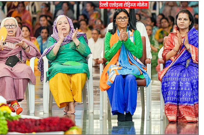
अंध प्रदेश। श्री सत्य साई जिले में स्थित प्रशांति मिलनम के दौरे के दौरान लोगों के साथ प्रार्थना करती बोलिवेरियन गणराज्य वेनेजुएला की कार्यवाहक राष्ट्रपति डेल्ली एलोइजा रोड्रिगुज गोलेज।