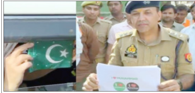
सम्भल। ग्राम कसेरवा में मिले आईलव मोहम्मद पोस्टर व चांद-तारा बना झंडा दिखाते सीओ।

सवाल उठाए और जल्दबाजी में करम उठाने का आरोप लगाया। उन्होंने आरोप लगाया कि मस्जिद, मद्रससा, कब्रिस्तान और अन्य धार्मिक स्थलों को निशाना बनाने के मामलों बंद रहे हैं, जो समाज को बांटने की राजनीति का हिस्सा है। उन्होंने कहा कि वक्फ संपत्ति से जुड़े मामलों में वह प्रभावित पक्ष के साथ खड़े रहेंगे और न्याय के लिए हर कानूनी मंच पर लड़ाई जारी रखेंगे। वक्फ सुनवाई का अधिकार केवल वक्फ ट्रिब्यूनल को है, जबकि प्रशासनिक अधिकारी अपने अधिकार क्षेत्र से बाहर जाकर कार्रवाई कर रहे हैं। उन्होंने आरोप लगाया कि डीएम कोर्ट से आदेश पारित होने के तुरंत बाद बिना पर्याप्त समय दिए मस्जिद को गिरा दिया गया। प्रभावित पक्ष को उच्च अदालत में अपील करने का अवसर भी नहीं दिया गया।