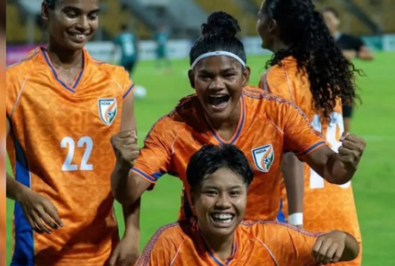
एक गोल खया। इसी बीच उपराष्ट्रपति सीपी राधाकृष्णन और प्रधानमंत्री नरेंद्र मोदी ने दक्षिण एशियाई फुटबॉल महासंघ (सैफ) महिला चैंपियनशिप 2026 जीतने पर भारतीय महिला फुटबॉल टीम को रविवार कोबधाई दी। उन्होंने पूरे टूर्नामेंट में शानदार प्रदर्शन के लिए खिलाड़ियों की तारीफ की और भरोसा जताया कि उनकी यह कामयाबी और अधिक युवाओं को इस खेल से जुड़ने के लिए प्रेरित करेगी। सोशल मीडिया मंच 'एक्स' पर एक पोस्ट में प्रधानमंत्री ने टीम की इस