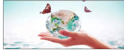
गंभीर प्रदूषण की चपेट में हैं सभी महासागर सम्पादकीय