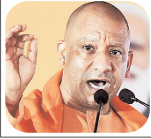
लखनऊ, वाराणसी, नोएडा, जौनपुर और गाजियाबाद में हुई है हत्या की घटनाएं

लखनऊ। योगी आदित्यनाथ सरकार ने अपराध के खिलाफ जीरो टॉलरेंस की नीति लागू की है। सरकार की तरफ से लगातार यह दावा किया जा रहा है कि यूपी से अपराधी दूसरे राज्यों में भाग गए हैं, लेकिन हाल की घटनाएं इस पर सवाल उठा रही हैं। अपराधियों ने पिछले कुछ दिनों में यूपी में जमकर तांडव किया है, तमाम हत्याएं हुई हैं। लगातार कुछ बड़ी अपराधिक घटनाओं से मुख्यमंत्री योगी आदित्यनाथ काफी खफा हैं। उन्होंने शनिवार को अचानक ही ज्यादा अपराध वाले जिलों के पुलिस अधिकारियों को तलब कर लिया और उनकी जमकर क्लास ली। वीडियो कॉन्फ्रेंसिंग के जरिए