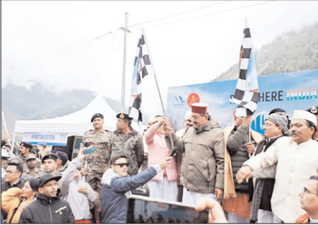
सीमांत नीति घाटी में, देशभर से पहुंचे 933 प्रतिभागी, फिट इंडिया और सीमांत पर्यटन को नई उड़ान देने की पहल