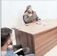
एक धार्मिक यात्रा नहीं, बल्कि उत्तराखण्ड की संस्कृति, आस्था और अतिथि सत्कार को पहचान है। ऐसे में प्रत्येक हितधारक की जिम्मेदारी है कि वह श्रद्धालुओं को सुरक्षित, सुविधाजनक और दिव्यांग यात्रियों के प्रति संवेदनशील व्यवहार सुनिश्चित करने के निर्देश दिए गए। आपदा एवं आपातकालीन परिस्थितियों को ध्यान में रखते हुए एम्बुलेंस, फायर ब्रिगेड और राहत-बचाव वाहनों के लिए मार्ग को हर समय बाधा रहित रखने का निर्णय लिया गया। साथ ही व्यापारियों से अपने प्रतिष्ठानों के आसपास स्वच्छता बनाए रखने, कुड़ा निर्यात स्थानों पर हटाने और यात्रियों के साथ सौहार्दपूर्ण