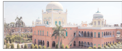
छोटे से मदरसे से विश्व विख्यात संस्था बनना मामूली बात नहीं