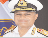
एडमिरल त्रिपाठी 31 मई को अपनी सेवा से हो गए थे रिटायर

पद संभालने के बाद उन्हें साउथ ब्लॉक परिसर में औपचारिक गार्ड ऑफ ऑनर दिया गया। इसके साथ ही वे भारतीय नौसेना के 27वें नौसेना प्रमुख बन गए हैं। दूसरी तरफ, निवर्तमान नौसेना प्रमुख एडमिरल दिनेश कुमार त्रिपाठी ने राष्ट्रीय युद्ध स्मारक जाकर देश के लिए बलिदान देने वाले वीर सैनिकों को श्रद्धांजलि दी। एडमिरल दिनेश