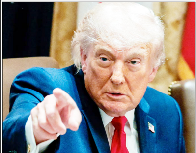
हम एक बहुत अच्छे समझौते के करीब हैं अगर हम इसे कर लेते हैं, तो अच्छा है: ट्रम्प

कहा: अमेरिका ईरान से बहुत अच्छे समझौते के करीब, नहीं बनी बात, तो अपनाएंगे दूसरा रास्ता