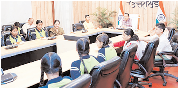
आत्मनिर्भर भारत, पर्यावरण संरक्षण, स्वच्छता, नवाचार, स्थानीय उत्पादों को प्रोत्साहन तथा सामाजिक सरोकारों से जुड़े विषयों पर निरंतर दिए जा रहे संदेश, समाज में सकारात्मक परिवर्तन का आधार बन रहे हैं।

सीएम ने बालिकाओं के साथ सुना प्रधानमंत्री के मन की बात का 134 वं संस्करण