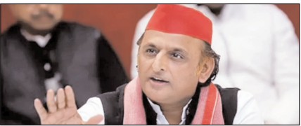
हुगली में टीएमसी सांसद कल्याण बनर्जी पर हमले की अखिलेश यादव ने की निंदा

नई दिल्ली, मुजफ्फरनगर, देहरादून, हल्द्वानी, मुगदाबाद, बरेली, मेरठ व लखनऊ से प्रकाशित