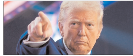
डोनाल्ड ट्रम्प की ईरान को नई धमकी