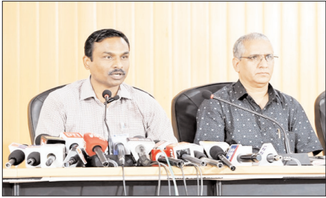
मतदाता पहली बार घर पर न मिलने पर तीन विजिट करेंगे बीएलओ