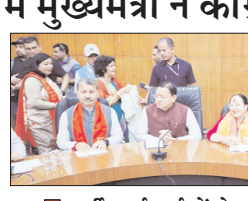
पार्टी कार्यकर्ताओं के साथ की बैठक, संगठन की मजबूती व विभिन्न समस्यायुक्त विषयों पर की चर्चा

शाह टाइम्स ब्यूरो नैनीताल। सूबे के सीएम पुष्कर सिंह धामी शुक्रवार को नैनीताल पहुंचे, नैनीताल आगमन पर उन्होंने पार्टी कार्यकर्ताओं के साथ बैठक कर संगठन को मजबूत बनाने और विभिन्न समस्यायुक्त विषयों पर चर्चा की। सीएम धामी ने कांग्रेस नेता राहुल गांधी पर निशाना साधते हुए कहा कि देश में कोई भी व्यक्ति राहुल गांधी को गंभीरता से नहीं लेता उन्होंने कहा कि राहुल गांधी को स्वयं भी यह पता नहीं रहता कि वह कब क्या बोल जाते हैं।