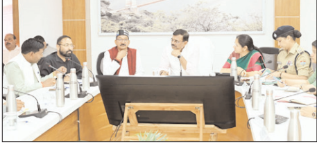
मुख्य सचिव ने जनप्रतिनिधियों एवं सामाजिक कार्यकर्ताओं के साथ विकास कार्यों को लेकर की बैठक