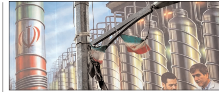
10 न्यूक्लियर बम बना सकता है ईरान: आईईए