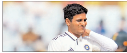
भारत-अफगानिस्तान टेस्ट से शुरु होगा गिल का दौरा