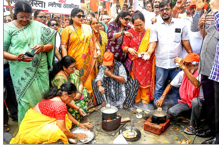
मुंबई। केंद्र सरकार द्वारा पेट्रोल और एलपीजी गैस की कीमतों में की गई वृद्धि के खिलाफ विरोध प्रदर्शन करते शिवसेना (यूबीटी) कार्यकर्ताओं।

ईरान ने साफ कहा है कि अगर उस पर या उसके हितों पर हमला हुआ तो वह कड़ा जवाब देगा। साथ ही कुवैत और बहरीन को चेतावनी दी गई है कि अगर उनकी जमीन का इस्तेमाल ईरान के खिलाफ हुआ तो उसे नजरअंदाज नहीं किया जाएगा। वहीं अमेरिकी संसद के निचले सदन ने ईरान के खिलाफ सैन्य कार्रवाई पर राष्ट्रपति की शक्तियों को सीमित करने का प्रस्ताव पास किया है। इस फैसले का ट्रम्प ने कड़ा विरोध किया और इसे देशहित के खिलाफ बताया। दूसरी ओर मिडिल ईस्ट में तनाव के बावजूद सीजफायर की उम्मीदों के चलते वैश्विक बाजार में कच्चे तेल की कीमतों में हल्की गिरावट दर्ज की गई है। ब्रेंट क्रूड करीब 0.69 प्रतिशत गिरकर 97.14 डॉलर प्रति बैरेल पर पहुंचा, जबकि डब्ल्यूटीआई क्रूड 0.65 प्रतिशत गिरकर 95.40 डॉलर प्रति बैरेल।