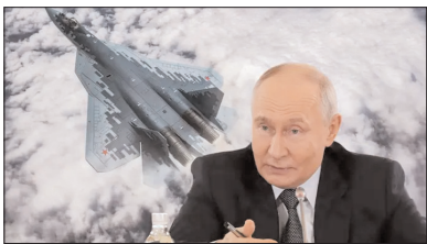
प्रोजेक्ट में साझेदार बनने का ऑफर दिया था। उस समय भारत ने कहा था कि रूस

सेंट पीटर्सबर्ग। रूस के राष्ट्रपति व्लादिमीर पुतिन ने भारत को सुखोई एसयू-57 स्टेल्थ फाइटर जेट को लेकर बड़ा ऑफर दिया है। उन्होंने कहा है कि रूस, भारत के साथ मिलकर इस विमान का विकास और उत्पादन करने के लिए तैयार है। साथ ही रूस जरूरी रक्षा तकनीकों का साझा करने के लिए भी तैयार है।