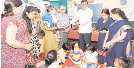
मुख्य सचिव ने विद्यालय, आंगनबाड़ी केंद्र, पुस्तकालय का किया निरीक्षण