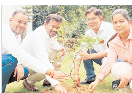
किया। कार्यक्रम के माध्यम से पर्यावरण संरक्षण, हरित विकास एवं स्वच्छ वातावरण का संदेश दिया गया तथा सभी नागरिकों से पौधारोपण अभियान में सक्रिय सहभागिता की अपील की गई।