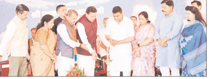
भीमताल में विश्व पर्यावरण दिवस पर कार्यक्रम में शामिल हुए मुख्यमंत्री

शाह टाइम्स ब्यूरो नैनीताल। विश्व पर्यावरण दिवस के मौके पर नैनीताल जिले के भीमताल स्थित रामलीला मैदान में आयोजित जनसभा कार्यक्रम के दौरान उपस्थित जनता को संबोधित करते हुए सीएम धामी ने उपस्थित जनता को विश्व पर्यावरण दिवस की हार्दिक बधाई एवं शुभकामनाएं देते हुए कहा कि यहां की सुंदर झील, चारों ओर फैली हरियाली तथा पर्वतों की अद्भुत श्रृंखला और प्रकृति की अनुभव छटा हमें केवल आनंद का अनुभव ही नहीं कराती बल्कि हमें ये भी याद दिलाती है कि प्रकृति और पर्यावरण ही हमारा वर्तमान भी है और भविष्य भी है। इसलिए इस प्रकृति और पर्यावरण को संरक्षित और सुरक्षित रखना हम सभी का दायित्व है। सीएम धामी ने कहा कि आज का दिन केवल पौधे लगाने या औद्योगिक कार्यक्रमों को करने का ही नहीं है बल्कि आज का दिन आत्मचिंतन करने का भी दिन है। आज का दिन स्वयं से ये पूछने का अवसर है कि हम अपने बच्चों और आने वाली पीढ़ियों को कैसे धरती