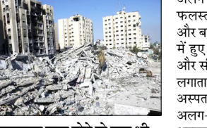
सीजफायर लागू होने के बाद भी अब तक 936 लोगों की मौत हो चुकी है

गाजा। पश्चिम एशिया में इस समय वार्ता और संघर्ष दोनों साथ चल रहे हैं। गाजा से लेकर लेबनान तक लगातार हवाई हमलों, जवाबी कार्रवाई और संघर्ष विराम के बावजूद हो रही मौतों ने हालात को और गंभीर बना दिया है। गाजा स्वास्थ्य मंत्रालय के अनुसार, सीजफायर लागू होने के बाद भी अब तक 936 लोगों की मौत हो चुकी है। मंत्रालय को संयुक्त राष्ट्र और स्वतंत्र विशेषज्ञों द्वारा विश्वसनीय माना जाता है, हालांकि यह नागरिकों और लड़कों का अलग-अलग आंकड़ा जारी नहीं करता। इजरायल का कहना है कि हमले उन घटनाओं के जवाब में किए जाते हैं जिनमें समझौते का उल्लंघन या सुरक्षा खतरा शामिल होता है। इजरायल की सेना ने दावा किया कि उत्तरी गाजा में हुए हमलों में हमास के चार लड़ाकों को मार गिराया गया है। सेना के अनुसार ये लोग हमास नेतृत्व की सरका और खुफिया जानकारी