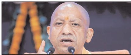
प्रकृति विरोधी माफिया से सतर्क रहें: सीएम योगी

नई दिल्ली, मुजफ्फरनगर, देहरादून, हल्द्वानी, मुगदाबाद, बरेली, मेरठ व लखनऊ से प्रकाशित