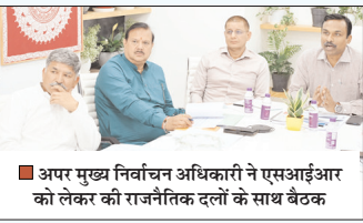
अपर मुख्य निर्वाचन अधिकारी ने एसआईआर को लेकर राजनैतिक दलों के साथ बैठक