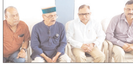
महिलाओं के प्रति वरिष्ठ नेता का बयान उनकी नकारात्मक सोच को दर्शाता है: नवप्रभात

बातें कर रहा है, ऐसे व्यक्तियों को उत्तराखण्ड की जनता से माफ़ी मांगनी चाहिए। उन्होंने कहा भाजपा को चाहिए ऐसे व्यक्ति को तत्काल प्रभाव से उत्तराखण्ड से बाहर करे। नवप्रभात ने कहा कि भाजपा ने हमेशा सैनिकों को ठगने का काम किया है चाहे वह वन रैंक वन पेंशन हों चाहे युवाओं को रोजगार देने के लिए, अग्नि वीर योजना के माध्यम से ठगने का काम किया है।