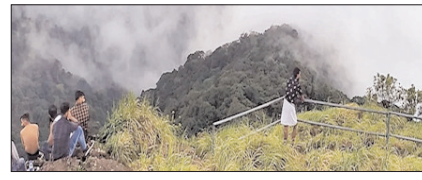
दिल्ली की गर्मी से बचना है, तो यहां जाएं