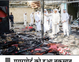
एयरपोर्ट को हुआ नुकसान अमेरिकी निर्मित पैट्रियट रक्षा प्रणाली की विफलता के कारण हुआ