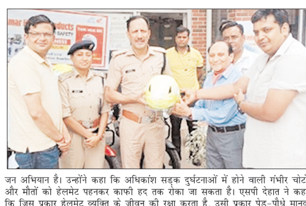
जन अभियान है। उन्होंने कहा कि अधिकांश सड़क दुर्घटनाओं में होने वाली गंभीर चोटों और मौतों को हेल्मेट पहनकर काफी हद तक रोका जा सकता है। एसपी देहात ने कहा कि जिस प्रकार हेल्मेट व्यक्ति के जीवन की रक्षा करता है, उसी प्रकार पेड़-पौधे मानव