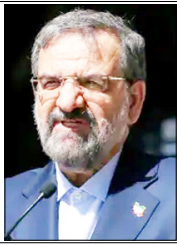
वार्ताएं गतिरोध की स्थिति में हैं और इस गतिरोध को तोड़ना ट्रम्प की जिम्मेदारी है: रेजाई

तेहरान। ईरान के वरिष्ठ सलाहकार मो. हसन रेजाई ने कहा है कि अमेरिका और ईरान के बीच किसी भी संभावित समझौते की सफलता इस बात पर निर्भर करेगी कि ट्रम्प प्रशासन ईरान की 24 अरब डॉलर की जल्द की हुई संपत्तियों को जारी करने की मांग स्वीकार करता है या नहीं। सीएनएन को दिए एक साक्षात्कार में ईरान के सर्वोच्च नेता अयातुल्ला मोजतबा खामनेई के सैन्य सलाहकार रेजाई ने कहा कि अब अगला कदम अमेरिका के राष्ट्रपति डोनाल्ड ट्रम्प को उठाना है। उन्होंने कहा कि वार्ताएं गतिरोध की स्थिति में हैं और इस गतिरोध को तोड़ना ट्रम्प की जिम्मेदारी है। गंदे अब ट्रम्प के पाले में हैं। उन्होंने चेतावनी दी कि यदि सैन्य टकराव फिर शुरू हुआ तो प्रमुख का दायरा फारस का खाड़ी से कहीं आगे तक फैल सकता है। रेजाई के अनुसार ईरान चाहता है कि अंतरिम समझौते पर हस्ताक्षर होते ही 12 अरब डॉलर जारी किए जाएं, जबकि शेष 12 अरब डॉलर बाद में दिए जाएं। उन्होंने कहा कि यह राशि जारी करना विश्वास बहाली का महत्वपूर्ण कदम होगा और युद्ध समाप्त करने के लिए समझौते तक पहुंचने में मदद करेगा। उन्होंने कहा कि यदि ट्रम्प वास्तव में ईरान के साथ समझौता करना चाहते हैं तो यह 24 अरब डॉलर विश्वास की परीक्षा है। अमेरिका को यह परीक्षा पास करनी होगी,