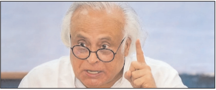
सीबीएसई में अनियमितताएं धर्मप्रधान की अक्षमता का प्रमाण: कांग्रेस

नई दिल्ली, मुजफ्फरनगर, देहरादून, हल्द्वानी, मुगदाबाद, बरेली, मेरठ व लखनऊ से प्रकाशित