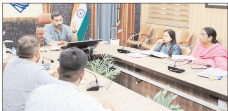
स्मार्ट सिटी परियोजनाओं की प्रगति, हैंडओवर की स्थिति एवं संचालन-अनुरक्षण कार्यों की जिलाधिकारी ने की समीक्षा

बैठक में जानकारी दी गई कि स्मार्ट सिटी के अंतर्गत स्वीकृत 22 परियोजनाओं में से 21 परियोजनाएं पूर्ण हो चुकी हैं तथा इनमें से 10 परियोजनाओं को संबंधित विभागों को हस्तांतरित किया जा चुका है। एक परियोजना, ग्रीन बिल्डिंग, वर्तमान में निर्माणाधीन है। इस पर जिलाधिकारी ने शेष 11 पूर्ण