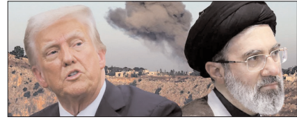
अमेरिका-ईरान फिर सैन्य टकराव के बेहद करीब