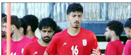
स्टाफ अभी भी वीजा का इंतजार कर रहे हैं। महासंघ का कहना है कि इससे टीम को बराबरी का मौका नहीं मिल रहा है और वह इस मामले को फीफा के सामने उठाएगा। वहीं, अमेरिकी अधिकारियों का कहना है कि सभी खिलाड़ियों, कोच, ट्रेनर और कुछ सपोर्ट स्टाफ को वीजा जारी कर दिया गया है, लेकिन कुछ आवेदनों

तेहरान। ईरान और इजरायल के बीच जारी जंग के बावजूद ईरानी फुटबॉल टीम के खिलाड़ियों को अमेरिका का वीजा मिला गया है। हालांकि टीम के कई सपोर्ट स्टाफ और अधिकारियों को अब तक अमेरिकी वीजा नहीं मिला है। इस पर ईरान ने अमेरिका पर भेदभाव करने का आरोप लगाया है। ईरानी सरकारी मीडिया के मुताबिक, फुटबॉल महासंघ के महासचिव हेदायत मोन्बेनी, उपाध्यक्ष मेहदी मोहम्मद नबी समेत 14 अधिकारी और सहयोगी