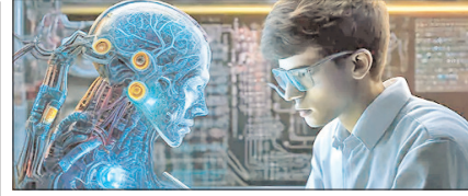
AI के सबसे अच्छे 5 कोर्स: नहीं होगी नौकरी की दिक्कत