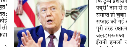
कुछ एसी चीजें हैं जिन्हें करने के बारे में उन्होंने कभी नहीं सोचा था, लेकिन अब उन्हें करना पड़ेगा: ट्रम्प

वाशिंगटन। अमेरिका के राष्ट्रपति डोनाल्ड ट्रम्प ने कहा है कि ईरान के साथ जारी युद्ध को समाप्त करने के लिए अभी तक कोई अंतिम समझौता नहीं हुआ है, क्योंकि ईरानी नेतृत्व 'मजबूत' और 'स्वाभिमान' है, लेकिन अंततः उसके पास समझौते के अलावा कोई विकल्प नहीं बचेगा। ट्रम्प ने एनबीसी न्यूज को दिए एक साक्षात्कार में कहा कि वे मजबूत हैं, वे गर्व से भरपूर हैं। कुछ एसी चीजें हैं जिन्हें करने के बारे में उन्होंने कभी नहीं सोचा था, लेकिन अब उन्हें करना पड़ेगा। उनके पास कोई विकल्प नहीं है, हालांकि इसमें थोड़ा समय लगेगा। ट्रम्प की यह टिप्पणी ऐसे समय आई है, जब अमेरिका और ईरान के बीच युद्ध समाप्त करने के लिए चल रही वार्ता चौथे महीने में प्रवेश कर चुकी है। अप्रैल में हुआ युद्धविराम अभी तक किसी तरह कायम है, लेकिन दोनों देशों के बीच कूटनीतिक गतिरोध बना हुआ है। हाल के दिनों में