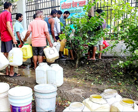
मोपाल। कोला जल आपूर्ति की मरम्मत पूरी न हो पाने के कारण आपूर्ति बाधित होने से पानी भरने के लिए कतार में खड़े लोग।

वाशिंगटन। अमेरिका ने शुक्रवार को ईरान के खिलाफ बड़ी आर्थिक कार्रवाई करते हुए उसके एक 'संगठित नेटवर्क' पर नए प्रतिबंधों का एलान किया है। अमेरिकी प्रशासन के अनुसार, यह नेटवर्क 'अवैध ऊर्जा व्यापार और वैश्विक वित्तीय धोखाधड़ी' में लिप्त था। इसके जरिए दक्षिण और पूर्वी एशिया के बाजारों में करोड़ों डॉलर मूल्य की ईरानी एलपीजी की तस्करी की जा रही थी। अमेरिकी विदेश और वित्त मंत्रालय के जारी बयानों के मुताबिक ईरान इसे ओमान जैसे तीसरे देशों का बताकर बेच रहा था। इस पूरे खेल को छिपाने के लिए संयुक्त अरब अमीरात (यूएई) और चीन में सक्रिय मुखौटा कंपनियों के साथ-साथ ईरान के जहाजों के लिए छद्म बेड़े का इस्तेमाल किया जा रहा था। ये जहाज अपनी पहचान और ईंधन के ईरानी मूल को छिपाकर परिवहन कर रहे थे।