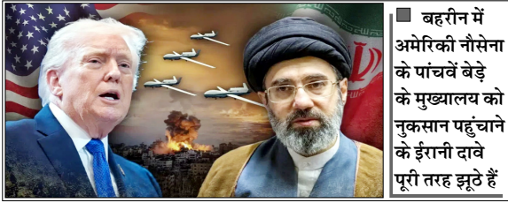
बहरैन में अमेरिकी नौसेना के पांचवें बेड़े के मुख्यालय को नुकसान पहुंचाने के ईरानी दावे पूरी तरह झूठे हैं

इसी दौरान एक अन्य मोर्चे पर इजरायल-लेबनान में संघर्ष विराम समझौता होने के बावजूद इजरायली सेना और हिजबुल्लाह के बीच झड़पें तेज हो गई हैं। हालांकि आधिकारिक तौर पर यह युद्धविराम लागू है, लेकिन जमीन पर इसका पालन बेहद कमजोर नजर आ रहा है। अमेरिकी केंद्रीय कमान (सेंटकॉम) ने एक बयान में कहा कि ईरानी बलों ने होर्मुज जलडमरूमध्य और पड़ोसी खाड़ी देशों की ओर कई बैलिस्टिक मिसाइलें और ड्रोन्स दागे। शुरुआती आकलन के अनुसार, अमेरिकी सेना ने कुवैत और बहरैन को निशाना बनाकर दागों गई सात मिसाइलों में से छह को हवा में ही नष्ट कर दिया, जबकि सातवीं मिसाइल लक्ष्य तक पहुंचने से पहले ही गिर गई। बयान में कहा गया है कि किसी भी अमेरिकी कर्मियों को कोई नुकसान नहीं पहुंचा है। सेंटकॉम ने कहा कि बहरैन में अमेरिकी नौसेना के पांचवें बेड़े के