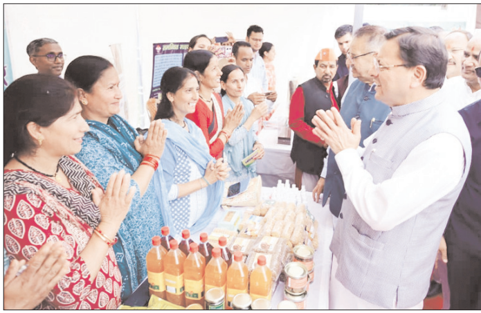
अल्मोड़ा के हवालबाग में हुआ भव्य कार्यक्रम, बड़ी संख्या में पहुंचे किसान

अल्मोड़ा। जलवायु परिवर्तन की चुनौतियों के बीच कृषि और किसानों के भविष्य को सुरक्षित बनाने के उद्देश्य से हवालबाग में राज्य स्तरीय खेत बचाओ अभियान कार्यक्रम का भव्य आयोजन किया गया। कार्यक्रम में जलवायु परिवर्तन के प्रभावों को देखते हुए कृषि संरक्षण, मिट्टी की उर्वरा शक्ति बनाए रखने तथा किसानों को भविष्य की चुनौतियों के प्रति जागरूक करने पर विशेष जोर दिया गया। मोटे अनाजों विशेषकर मांझुआ, झंगोरा, चोलाई एवं अन्य पारंपरिक फसलों के संरक्षण और उत्पादन बढ़ाने का आह्वान किया गया।