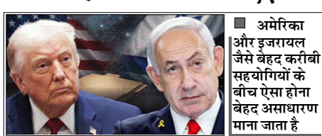
अमेरिका और इजरायल जैसे बेहद करीबी सहयोगियों के बीच ऐसा होना बेहद असाधारण माना जाता है

वाशिंगटन। अमेरिका और इजरायल के बीच ईरान को लेकर मतभेद बढ़ रहे हैं। इस बीच अमेरिकी रक्षा विभाग (पेंटागन) के भीतर यह चिंता बढ़ गई है कि इजरायल अमेरिकी अधिकारियों और ट्रम्प सरकार की अंदरूनी जानकारी जुटाने के लिए जासूसी की कोशिश कर रहा है। एक रिपोर्ट के मुताबिक दो मोज़ेदा और एक पूर्व अमेरिकी अधिकारी ने बताया कि पेंटागन की डिफेंस इंटेलिजेंस एजेंसी (डीआईए) ने हाल ही में इजरायल से जुड़े काउंटर-इंटेलिजेंस खतरे का स्तर बढ़ाकर 'क्रिटिकल' कर दिया है। यह एजेंसी का सबसे गंभीर अलर्ट माना जाता है। अमेरिका और इजरायल जैसे बेहद करीबी सहयोगियों के बीच ऐसा होना बेहद असाधारण माना जाता है। हालांकि इजरायल ने इन आरोपों