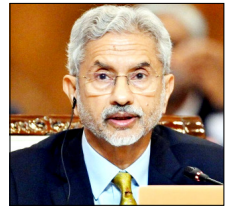
कहा: इससे अवैध कब्जा वैध नहीं होगा, 7 जून को 24 सीटों पर वोटिंग

नई दिल्ली। भारत ने पाकिस्तान के कब्जे वाले गिलगित-बाल्टिस्तान में 7 जून को होने वाले विधानसभा चुनावों का कड़ा विरोध किया है। विदेश मंत्रालय ने जारी बयान में कहा कि पाकिस्तान जिस क्षेत्र पर अवैध और जबरन कब्जा किए हुए है, वहां चुनाव कराने की उसकी योजना पूरी तरह अस्वीकार्य है। विदेश मंत्रालय ने कहा कि पूरा जम्मू-कश्मीर और लद्दाख, जिसमें गिलगित-बाल्टिस्तान भी शामिल है, भारत का अभिन्न और अविभाज्य हिस्सा है।