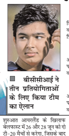
शुरुआत आयरलैंड के खिलाफ बेलफास्ट में 26 और 28 जून को टी-20 मैचों से करेगा, जिसके बाद

आयरलैंड के खिलाफ भारतीय टी-20 टीम: श्रेयस अय्यर (कप्तान), अभिषेक शर्मा, संजु सैमसन, ईशान किशन, शिवम दुबे, तिलक वर्मा, नितीश कुमार रेड्डी, अक्षर पटेल, वरुण चक्रवर्ती, वाशिंगटन सुंदर, रवि बिश्नोई, मोहम्मद सिराज, हर्षित राणा, अश्विनीप सिंह, प्रिंस यादव और वैभव सूर्यवंशी।