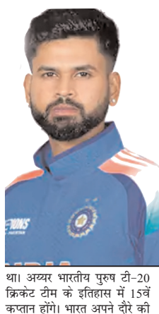
श. अय्यर भारतीय पुरुष टी-20 क्रिकेट टीम के इतिहास में 15वें कप्तान होंगे। भारत अपने दौरे की

यादव को टीम में जगह भी नहीं मिली है। वहीं, घरेलू मैदान पर विश्वकप के दौरान नौ पारियों में 136.72 के स्ट्राइक रेट से 242 रन बनाने वाले 35 साल के सूर्यकुमार को खराब फॉर्म के कारण टीम से बाहर कर दिया गया। आईपीएल 2026 में भी उन्होंने मुम्बई इंडियंस के लिए 13 पारियों में 270 रन बनाए थे। बीसीसीआई ने टीम के नेतृत्व में यह बदलाव लॉस एंजेलिस 2028 ओलंपिक और उसी साल ऑस्ट्रेलिया और न्यूजीलैंड में होने वाले टी-20 वर्ल्ड कप को ध्यान में रखते हुए एक नई टी-20 टीम तैयार करने को लिए किया है। इस सीजन में पंजाब किंग्स के साथ प्लेऑफ में जगह बनाने से मामूली अंतर से चुकने के बावजूद, अय्यर ने 14 मैचों में शानदार 498 रन बनाए। इसमें उनका पहला आईपीएल शतक भी शामिल