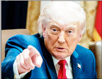
हम एक बहुत अच्छे समझौते के करीब हैं अगर हम इसे कर लेते हैं, तो अच्छा है: ट्रम्प

कहा: अमेरिका ईरान से बहुत अच्छे समझौते के करीब, नहीं बनी बात, तो अपनाएंगे दूसरा रास्ता