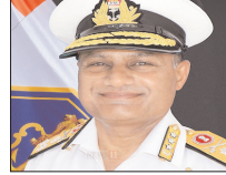
एडमिरल त्रिपाठी 31 मई को अपनी सेवा से हो गए थे रिटायर

पद संभालने के बाद उन्हें साउथ ब्लॉक परिसर में औपचारिक गार्ड ऑफ ऑनर दिया गया। इसके साथ ही वे भारतीय नौसेना के 27वें नौसेना प्रमुख बन गए हैं। दूसरी तरफ, निवृत्त नौसेना प्रमुख एडमिरल दिनेश कुमार त्रिपाठी ने राष्ट्रीय युद्ध स्मारक जाकर देश के लिए बलिदान देने वाले वीर सैनिकों को श्रद्धांजलि दी। एडमिरल दिनेश