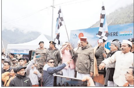
सीमांत नीति घाटी में, देशभर से पहुंचे 933 प्रतिभागी, फिट इंडिया और सीमांत पर्यटन को नई उड़ान देने की पहल

शाह टाइम्स ब्यूरो चमोली। जनपद चमोली की सुर्य एवं सामरिक दृष्टि से महत्वपूर्ण नीति घाटी में रविवार को 'नीति एक्सट्रीम अल्ट्रा रन' का भव्य शुभारंभ हुआ। पर्यटन विभाग द्वारा भारतीय सेना एवं आईटीबीपी के सहयोग से आयोजित इस अनूठे आयोजन में देश के 28 राज्यों से आए 933 प्रतिभागी हिस्सा ले रहे हैं। तीन दिवसीय इस आयोजन का उद्देश्य सीमांत क्षेत्रों में पर्यटन गतिविधियों को बढ़ावा देना, स्थानीय संस्कृति को राष्ट्रीय पहचान दिलाना तथा युवाओं में फिटनेस के प्रति जागरूकता बढ़ाना है।