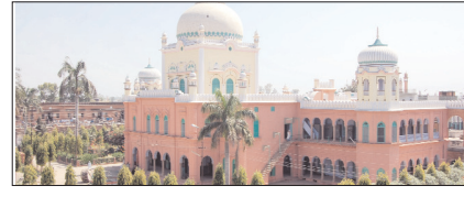
छोटे से मदरसे से विश्व विख्यात संस्था बनना मामूली बात नहीं