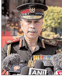
कहा: उनका मुख्य ध्यान सशस्त्र बलों के संगठनात्मक सुधारों पर होगा

नई दिल्ली। जनरल एनएस राजा सुब्रमणि ने रविवार को भारत के नए चीफ ऑफ डिफेंस स्टाफ (सीडीएस) के रूप में कार्यभार संभाल लिया। उन्हें पाकिस्तान और चीन के मामलों का बड़ा विशेषज्ञ माना जाता है। उनका मुख्य उद्देश्य महत्वकांक्षी मिलिट्री थिएटरेशन (सैन्य थिएटराइजेशन) योजना को लागू करना और तीनों सेनाओं के बीच तालमेल को मजबूत करना है। उन्होंने जनरल अमिल चौहान को जगह ली है। जनरल सुब्रमणि ने अपने पूर्ववर्तियों, दिवंगत जनरल बिपिन रावत और जनरल अमिल चौहान के शानदार नेतृत्व और योगदान के प्रति आभार जताया। जनरल चौहान शनिवार को देश के सबसे वरिष्ठ सैन्य कमांडर के रूप में अपना कार्यकाल पूरा करके सेवानिवृत्त हुए। जनरल सुब्रमणि इससे पहले राष्ट्रीय सुरक्षा परिषद सचिवालय (एनएससीएस) में सैन्य सलाहकार के रूप में काम कर रहे थे। वह पिछले साल 31 जुलाई को