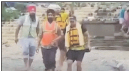
लोगों को सुरक्षित बचा लिया गया। उन्होंने बताया कि घटना के समय क्षेत्र में तीन से चार हजार श्रद्धालु मौजूद थे। उफानाई नदी का पानी पाकिंग क्षेत्र तक पहुंच गया, जिससे वहां खड़े तक वाहन दुबने के खतरे में आ गए। रेस्क्यू टीमों और ग्रामीणों ने समय रहते वाहनों को भी सुरक्षित निकाल लिया। इस दौरान श्रद्धालुओं की सुविधा के लिए बनाया गया पैदल पुल भी तेज बहाव में बह गया। घटना के दौरान गुरुद्वारा रीठा साहिब क्षेत्र में कुछ समय के लिए भगवद्