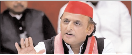
हुगली में टीएमसी सांसद कल्याण बनर्जी पर हमले की अखिलेश यादव ने की निंदा

नई दिल्ली, मुजफ्फरनगर, देहरादून, हल्द्वानी, मुगदाबाद, बरेली, मेरठ व लखनऊ से प्रकाशित