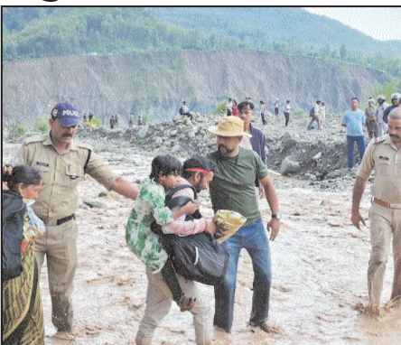
को टीम मौके पर पहुंची। पुलिस कर्मियों ने तत्परता, सूझबूझ और मानवीय संवेदनशीलता का परिचय देते हुए श्रद्धालुओं को सुरक्षित रूप से जलभराव वाले क्षेत्र से पार कराया तथा उनकी सकुशल आवाजाही सुनिश्चित की। पुलिस को