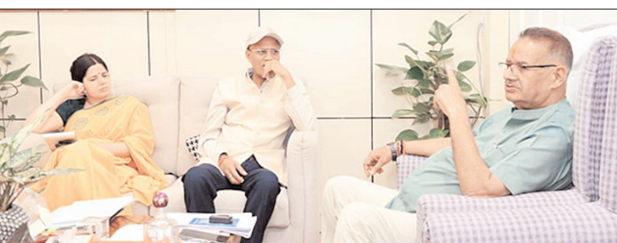
■ कृषि मंत्री ने किसानों को अधिकतम लाभ पहुंचाने पर दिया जोर ■ घेरबाड़ के लिए 90 करोड़ की राशि में से प्रथम किशत के रूप में 25 करोड़ की राशि राज्य को हुई प्राप्त