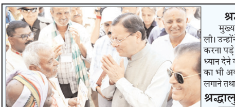
■ चारधाम यात्रा एवं रजिस्ट्रेशन प्रक्रिया से संबंधित व्यवस्थाओं का जायजा लिया, यात्रियों के पंजीकरण, स्वास्थ्य जांच, ठहरने की व्यवस्थाओं का देखा

शाह टाइम्स ब्यूरो ऋषिकेश। मुख्यमंत्री पुष्कर सिंह धामी ने बुधवार को ऋषिकेश स्थित ट्रांजिट कैंप का औचक निरीक्षण कर चारधाम यात्रा एवं रजिस्ट्रेशन प्रक्रिया से संबंधित व्यवस्थाओं का जायजा लिया। इस दौरान उन्होंने यात्रियों के पंजीकरण, स्वास्थ्य जांच, ठहरने की व्यवस्थाओं का निरीक्षण किया। सीएम ने बड़ी संख्या में राज्यों से आए श्रद्धालुओं से यात्रा का फीडबैक भी लिया। इस अवसर पर विधायक प्रेमचंद्र अग्रवाल मौजूद रहे।