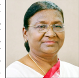
-द्रौपदी मुर्मू, राष्ट्रपति

जनजातियों के समग्र विकास और सरकार की योजनाएँ उन तक सुचारु रूप से पहुंचाने के लिए अधिकारियों को उनके पास जाकर उनकी समस्याओं को समझना होगा, अधिकारी गांव-गांव जाकर आदिवासियों से मिलें और उनके साथ घुल-मिलकर उनकी समस्याओं को समझें, तभी वे वास्तविकताओं से अवगत हो सकेंगे, इसके बाद ही आदिवासियों के समग्र विकास की योजनाएँ शासन स्तर पर बनाई जा सकेंगी, आदिवासी खुलकर अपनी दिक्कतों और समस्याओं लोगों से बताते नहीं हैं, उनके साथ घुल-मिलकर ही उनकी दुश्वारियों समझी जा सकती हैं आदिवासी बहुत आत्मसम्मान से जीते हैं, उनके पास धन नहीं होगा, उनके पास खाने को कुछ नहीं होगा, लेकिन वे आत्मसम्मान से समझौता नहीं करेंगे।