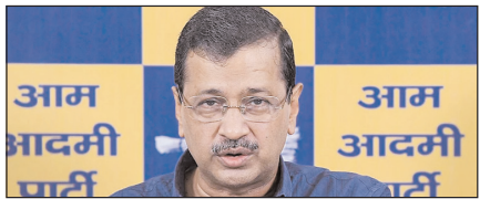
देश में कभी सोना नहीं बेचा गया : केजरीवाल पेज 2

नई दिल्ली, मुजफ्फरनगर, देहरादून, हल्द्वानी, मुगदाबाद, बरेली, मेरठ व लखनऊ से प्रकाशित