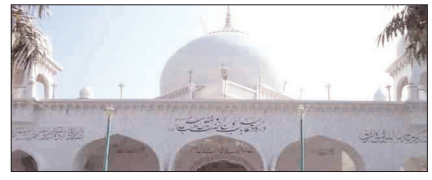
दरगाह बधरा एकता की प्रतीक सम्पादकीय