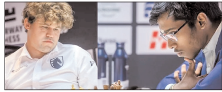
प्रज्ञानंद ने कार्लसन पर दूसरी जीत के साथ इतिहास रचा खेल टाइम्स