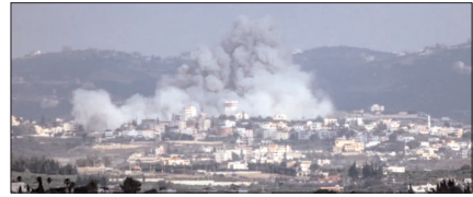
ईरान के केशम द्वीप पर अमेरिकी हमला, ईरान ने भी किया पलटवार पेज 12