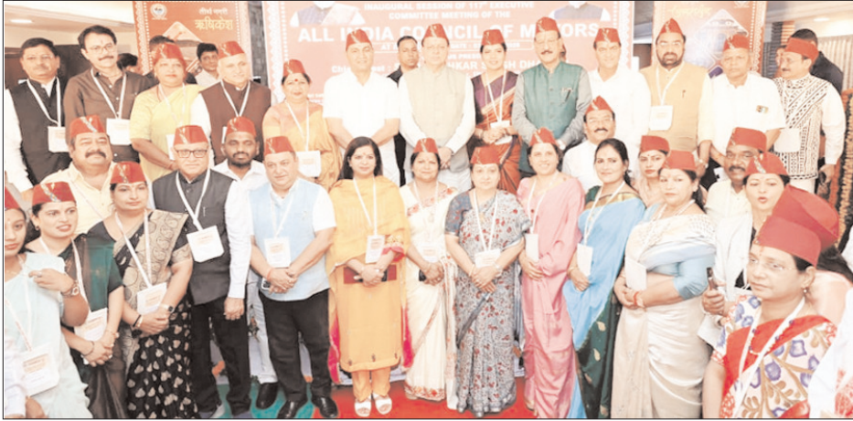
■ ऋषिकेश में अखिल भारतीय महापौर परिषद की 117वीं कार्यकारी समिति बैठक आयोजित ■ मुख्यमंत्री ने 29.78 करोड़ की 3 योजनाओं का लोकार्पण एवं शिलान्यास किया

शाह टाइम्स ब्यूरो ऋषिकेश। मुख्यमंत्री पुष्कर सिंह धामी ने अखिल भारतीय महापौर परिषद की 117वीं कार्यकारी समिति बैठक में विभिन्न शहरों के मेयर का स्वागत करते हुए कहा कि सभी मेयर अपने शहर के प्रथम नागरिक और शहरवासियों की आशाओं, अपेक्षाओं और विश्वास के भी प्रतिनिधि हैं। आपके निर्णय का प्रभाव आने वाली पीढ़ियों के भविष्य पर भी पड़ता है। उन्होंने कहा हमारे देश को आत्मा गीतों में बसती है, तो हमारे नागरिकों के सपने, उनकी आकांक्षाएँ और उनके भविष्य की संभावनाएँ शहरों में आकार लेती हैं।