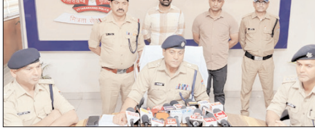
■ लाखों रुपये की कीमती कोकीनी हुई बरामद, हाई-प्रोफाइल पार्टियों में कोकीनी की होती थी सप्लाई

शाह टाइम्स संवाददाता देहरादून। उत्तराखंड के मुख्यमंत्री के इंड्रस फ्री देवभूमि के विजन को साकार करने के लिए देहरादून पुलिस द्वारा चलाए जा रहे शॉपरेशन प्रहार के तहत राजपुर पुलिस ने एक बड़ी सफलता हासिल की है। पुलिस ने कोबरा गैंग से जुड़े दो विदेशी नागरिकों सहित तीन शक्ति नशा तस्करों को गिरफ्तार किया है। इन तस्करों के पास से 20 लाख रुपये अनुमानित मूल्य की 20.92 इतम अवैध कोक। इन बरामद की गई है।