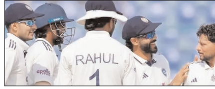
मुल्लापुर टेस्ट: भारत ने कसा अफगानिस्तान पर शिकंजा खेल टाइम्स