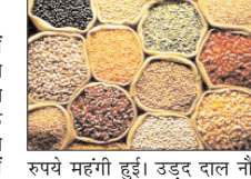
रुपये महंगे हुईं। उड़द दाल नी 10 रुपये की नरमी रही। मूंग दाल के दाम में कोई साप्ताहिक बदलाव नहीं देखा गया। बीते सप्ताह सरसों तेल की कीमत 109 रुपये और पाम ऑयल की 102 रुपये प्रति क्विंटल बढ़ गई। सूरजमुखी तेल 94 रुपये और सोया तेल 39 रुपये प्रति क्विंटल हुआ। वनस्पति भी 29 रुपये मजबूत हुआ।

घरेलू थोक जिन बाजारों में बीते सप्ताह चावल का औसत भाव बढ़ गया। चावल के साथ चीनी में भी तेजी देखी गई जबकि गेहूं के भाव लगभग अपरिवर्तित रहे। खाद्य तेलों और दालों में उतार-चढ़ाव का रुख रहा। सप्ताह के दौरान चावल की औसत कीमत 14 रुपये बढ़कर सप्ताहात पर 3,851 रुपये प्रति क्विंटल पर पहुंच गई। गेहूं 2,794 रुपये प्रति क्विंटल पर लगभग स्थिर रहा। आटे का भाव चार रुपये बढ़कर 3,282 रुपये प्रति क्विंटल हो गया। सप्ताह के दौरान चना दाल की औसत कीमत 15 रुपये प्रति क्विंटल बढ़ गई। मसूर दाल नी 10 रुपये और तुअर दाल आठ