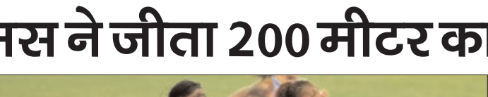
चैंपियन जूलियन अल्फ्रेड द्वारा अप्रैल में ऑस्टिन, टेक्सास में बनाए गए 21-86 सेकंड के 2026 के पिछले वर्ल्ड बेस्ट समय को पीछे छोड़ दिया। उन्होंने इस साल की शुरुआत में नैरोबी डकेंन्याऊ और अदीस अबाबा डइथियोपियाऊ में भी 200 मीटर

रहा है। मैं इस 'ऑफ' ईयर (बिना बड़े टूर्नामेंट वाले साल) का आनंद ले रही हूँ क्योंकि इसमें ओलंपिक या वर्ल्ड चैंपियनशिप का कोई दबाव नहीं है, इसलिए मैं बस इस सीजन का मजा ले रही हूँ। थॉमस ने सेंट लूसिया की मौजूदा ओलंपिक 100 मीटर