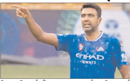
दिलचस्प मिसाल है। मैं एक पल के लिए खुद को सूर्यकुमार यादव के लिए रखकर सोचता हूँ कि इस समय वह कैसा महसूस कर रहे होंगे। मुझे यकीन है कि किसी भी खिलाड़ी को टीम से बाहर किए जाने पर दुखी होने का पूरा हक है और अगर वह बुरा महसूस कर रहे हैं, तो वह पूरी तरह जायज है। उन्होंने कहा, 'प्लेडिअर जिस तरह यह फैसला लिया गया है, उसे लेकर मुझे थोड़ी झिझक है क्योंकि मैं अपने मन में सोच रहा हूँ--- अगर मैं खुद को सूर्यकुमार की जगह रखूँ तो? ठीक है, मेरी बल्लेबाजी का फॉर्म पिछले 18 महीनों या 15 महीनों में मेरा साथ नहीं दे पाया। मैं उस स्तर पर नहीं खेल पाया, जैसा खेल सकता था। लेकिन फिर भी मैं देश के लिए टी

नई दिल्ली। पूर्व भारतीय स्पिनर आर अश्विन का मानना है कि सूर्यकुमार यादव को बल्लेबाज के रूप में खूद को साबित करने के लिए थोड़ा और समय दिया जा सकता था, बजाय इसके कि टी 20 विश्व कप खिताब जिताने के सिर्फ दो महीने बाद ही उन्हें भारत की टी20 टीम से पूरी तरह बाहर कर दिया जाए। बल्लेबाज के तौर पर सूर्यकुमार का टी-20 विश्व कप साधारण रहा था। उन्होंने 136-72 के स्ट्राइक रेट से 242 रन बनाए थे। इसके बाद आईपीएल में भी वह लय हासिल नहीं कर सके और 147-54 के स्ट्राइक रेट से 270 रन ही बना पाए। आईपीएल क्रिकेट को वीडियो शो में अश्विन ने कहा, 'प्लेडिअर, मुझे लगता है कि यह एक बहुत