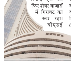
सप्ताह एक बार फिर शेयर बाजारों में गिरावट का रुख रहा। बीएसई

घरेलू शेयर बाजारों में बीते सप्ताह रही गिरावट के बाद आने वाले सप्ताह में सकल घरेलू उत्पाद (जीडीपी) के आंकड़ों का असर दिखेगा। जीडीपी के आंकड़े शुरुआत को बाजार बंद होने के बाद जारी किए गए थे, इसलिए इनका असर सोमवार को बाजार खुलने पर दिखेगा। वित्त वर्ष 2026.27 में जीडीपी की वृद्धि दर 7.7 प्रतिशत रही, जबकि चौथी तिमाही में यह 7.8 प्रतिशत दर्ज की गई। इसके अलावा निवेशकों की नजर मानसून की प्रगति पर भी रहेगी। तीन दिन की देरी से मानसून 4 जून को केरल पहुंचा था। गत