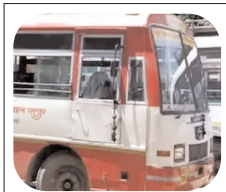
28 लाख अभ्यर्थियों के शामिल होने की संभावना

लखनऊ। उत्तर प्रदेश पुलिस में आरक्षी नागरिक पुलिस भर्ती की लिखित परीक्षा आठ, नौ और 10 जून को प्रदेशभर में कराई जा रही है। इसमें 28 लाख से अधिक अभ्यर्थी शामिल होने की उम्मीद है। ऐसे में अभ्यर्थियों की सुविधा के लिए परिवहन निगम ने अतिरिक्त बसों की व्यवस्था की है।