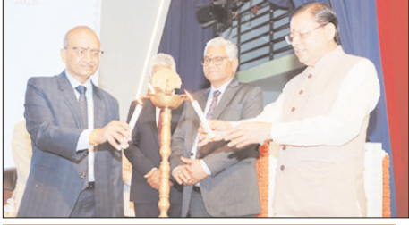
यू. पी. ई. एस. विधोली में उत्तराखंड न्यायाधीश संघ के वार्षिक सम्मेलन जूडिशियम 2.0 : इंकलूजन, एक्सेस एंड स्ट्रेथनिंग आयोजित, मुख्यमंत्री धामी हुए शामिल

शाह टाइम्स ब्यूरो देहरादून। मुख्यमंत्री पुष्कर सिंह धामी ने यू. पी. ई. एस. विधोली में उत्तराखंड न्यायाधीश संघ के वार्षिक सम्मेलन जूडिशियम 2.0 : इंकलूजन, एक्सेस एंड स्ट्रेथनिंग में प्रतिभाग किया। उन्होंने कहा कि न्याय व्यवस्था को अधिक समावेशी, सुलभ, पारदर्शी एवं प्रभावी बनाना सुशासन की मूल भावना है। उन्होंने कहा कि समाज के प्रत्येक वर्ग तक त्वरित एवं निष्पक्ष न्याय की पहुंच सुनिश्चित करना राज्य सरकार की सर्वोच्च प्राथमिकताओं में शामिल है। मुख्यमंत्री ने कहा कि सम्मेलन की थीम समावेशिता, न्याय तक आसान पहुंच तथा न्यायिक संस्थाओं के सुदृढ़ीकरण जैसे अत्यंत महत्वपूर्ण विषयों पर केंद्रित है, जो विकसित भारत के निर्माण के संकल्प से भी जुड़ी हुई हैं। उन्होंने कहा कि न्याय व्यवस्था में समाज के प्रत्येक वर्ग को समान अवसर एवं सम्मान मिलना चाहिए तथा न्याय तक पहुंच में भौगोलिक अथवा आर्थिक परिस्थितियां बाधक नहीं बननी चाहिए। विशेष रूप से उत्तराखंड