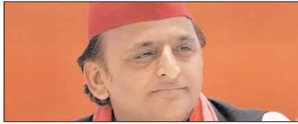
अखिलेश यादव ने राम मंदिर में चढ़ावे की रकम को लेकर उठाए गंभीर सवाल पेज 2

नई दिल्ली, मुजफ्फरनगर, देहरादून, हल्द्वानी, मुगदाबाद, बरेली, मेरठ व लखनऊ से प्रकाशित