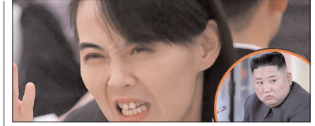
उत्तर कोरिया ने अमेरिका को दी खुली चुनौती, परमाणु हथियार नहीं छोड़ेगे पेज 12