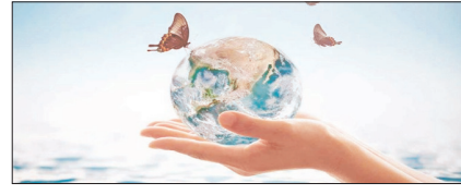
गंभीर प्रदूषण की चपेट में हैं सभी महासागर सम्पादकीय