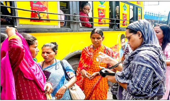
कोलकाता। राज्यव्यापी महिला गुप्त बस यात्रा योजना लागू होने के बाद यात्रियों का टिकट देखती महिला कंडक्टर।