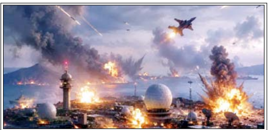
अमेरिकी लड़ाकू विमानों ने ईरान की हवाई रक्षा प्रणालियों, एक ग्राउंड कंट्रोल स्टेशन और दो हमलावर ड्रोन को नष्ट कर दिया

वाशिंगटन/तेहरान। अमेरिका-ईरान के बीच जारी संघर्षविषयों को आगे बढ़ाने और होर्मुज जलडमरूमध्य को फिर से खोलने के उद्देश्य से किए गए प्रस्तावित समझौते में अमेरिकी राष्ट्रपति डोनाल्ड ट्रम्प की ओर से कुछ बदलाव सुझाकर उसे वापस भेजने के बावजूद ईरान और अमेरिका के बीच हमलों और जवाबी हमलों का सिलसिला जारी है।