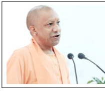
अनावश्यक विलंब होने पर संबंधित अधिकारियों की जवाबदेही भी तय की जाए: मुख्यमंत्री

लखनऊ। उत्तर प्रदेश के मुख्यमंत्री योगी आदित्यनाथ ने सोमवार को आयोजित जनता दर्शन में प्रदेश के विभिन्न जिलों से आए लोगों की समस्याएं सुनीं और संबंधित अधिकारियों को त्वरित एवं प्रभावी कार्रवाई के निर्देश दिए। उन्होंने कहा कि आमजन की समस्याओं का समयबद्ध निस्तारण सुनिश्चित किया जाए तथा अनावश्यक विलंब होने पर संबंधित अधिकारियों की जवाबदेही भी तय की जाए। जनता दर्शन के दौरान मुख्यमंत्री के समक्ष राजस्व और पुलिस विभाग से जुड़े कई प्रकरण प्रस्तुत किए गए। मुख्यमंत्री ने अधिकारियों को निर्देशित किया कि लंबित राजस्व वादों का निर्धारित समय सीमा के भीतर निस्तारण किया जाए। छह