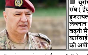
यूरोपीय संघ (ईयू) ने इजरायल से लेबनान में बढ़ती सैन्य कार्रवाई रोकने की अपील की

बेरूत। लेबनान के राष्ट्रपति जोसेफ आउन ने कहा है कि इजरायल और हिजबुल्लाह के बीच संघर्ष खत्म करने के लिए बातचीत जारी है। उन्होंने कहा कि युद्ध की तुलना में बातचीत ज्यादा सुरक्षित रास्ता है और फिलहाल इसके अलावा कोई दूसरा विकल्प नहीं है। जोसेफ आउन ने कहा, बातचीत से समस्या तुरंत हल नहीं होगी, लेकिन यही एक रास्ता है। बातचीत में देरी हो सकती है या कुछ रुकावटें आ सकती हैं, फिर भी यह आगे बढ़ रही है। यूरोपीय संघ (ईयू) ने इजरायल से लेबनान में बढ़ती सैन्य कार्रवाई रोकने की अपील की है। यह बयान ऐसे समय आया है जब इजरायली