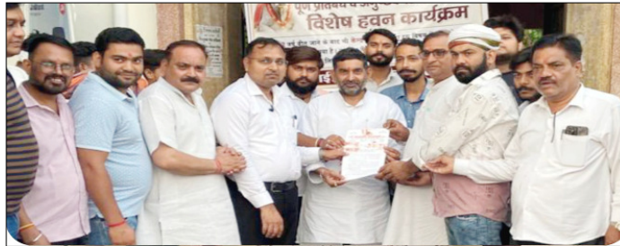
अलग-अलग राज्यों में गौ संरक्षण संबंधी कानूनों में भिन्नता होने के कारण प्रभावी नियंत्रण नहीं हो पाता। इसलिए पूरे देश में एक समान और कठोर कानून बनाया जाना आवश्यक है, जिससे गौवंश की सुरक्षा सुनिश्चित की जा सके।

हवन यज्ञ वैदिक रीति-रिवाजों और मंत्रोच्चारण के साथ संपन्न हुआ, जिसमें देश में गौ संरक्षण को मजबूत करने और शासन-प्रशासन को इस दिशा में प्रभावी कदम उठाने की प्रेरणा मिलने की कामना की गई।