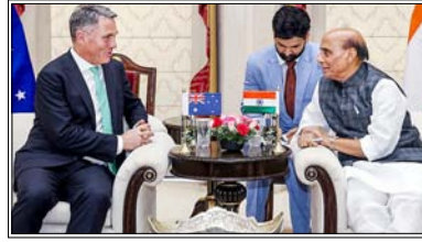
रक्षा मंत्री राजनाथ सिंह और ऑस्ट्रेलिया के रक्षा मंत्री रिचर्ड मार्ल्स ने सोमवार को यहाँ दूसरे भारत व ऑस्ट्रेलिया रक्षा मंत्री संवाद की सह अध्यक्षता की

नई दिल्ली। भारत और ऑस्ट्रेलिया ने अपनी रणनीतिक रक्षा साझेदारी को मजबूती से आगे बढ़ाते हुए समुद्री सुरक्षा, रक्षा उद्योग, परस्पर सैन्य संचालन क्षमता और उभरती प्रौद्योगिकियों के क्षेत्रों में सहयोग बढ़ाने पर सहमति व्यक्त की है। दोनों देशों ने हिन्द-प्रशांत क्षेत्र में सुरक्षा और स्थिरता को मजबूत करने की अपनी प्रतिबद्धता दोहराई।