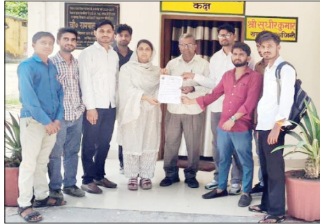
पर काम करना अत्यंत कठिन है, जिसे बढ़ाकर न्यूनतम 20,000 रुपये करने की मांग की जा रही है। दूसरा संसाधनों का अभाव जैसे

मिलने, ऑनलाइन हाजिरी के विरा. ध और स्थायी करने की मांग को लेकर पंचायत सहायकों ने विरोध प्रदर्शन शुरू किया है। पंचायत सहायकों ने चेतावनी दी कि यदि दो सप्ताह के भीतर उनकी मांगों पर कोई सकारात्मक निर्णय नहीं लिया गया, तो प्रदेशभर के पंचायत सहायक 15 जून को लखनऊ स्थित इको गार्डन में धरना-प्रदर्शन करने के लिए बाध्य होगा। उन्होंने इसकी पूरी जिम्मेदारी शासन-प्रशासन पर डाली। पंचायत सहायकों की मांगों में अल्प मानदेय (वेतन वृद्धि) यानि मात्र 6,000 रुपये मासिक मानदेय