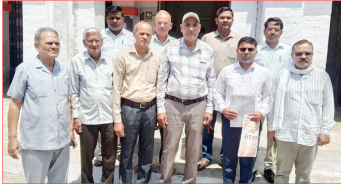
जानि है। अधिशासी अभियंता निरंतर सींचपाल एवं सीच