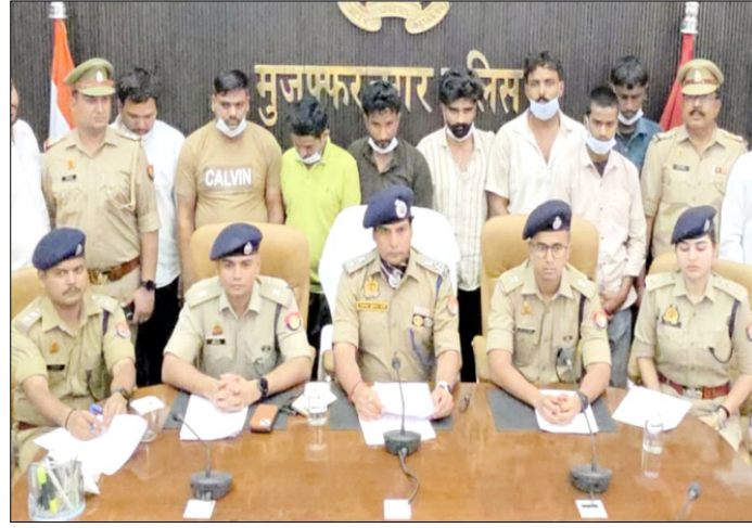
मुजफ्फरनगर: किसानों की खाद्य को बेचने वाले गिरोह की जानकारी देते एसएसपी।

हुए बताया कि एक जून को संभावली कट के निकट महिला के कुंडल लूटने वाला पुलिस मुठभेड़ में घायल हो गया है। आरोपी ने 27 मई को महिला के उस वक्त स्टैंडियम के निकट से गुजर रही थी। आरोपी ने छिने गए कुंडल को 20 हजार में बेच दिया था और कुछ रूपया उसने खर्च कर दिया था आरोपी शाहपुर थाने का हिस्ट्रीशीटर है और बरामद बाइक को उसने गाजियाबाद ने चोरी की थी। पुलिस ने घायल को अस्पताल भर्ती कराने के बाद जेल भेजा।