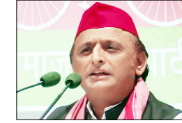
उत्तर प्रदेश की कानून व्यवस्था ठप, रोज हरो रही हैं हत्याएं: सपा

बसपा चीफ मायावती ने इस मामले को लेकर अपने सोशल मीडिया हैंडल एक्स पर पोस्ट कर इसे अत्यंत दुःख और चिंताजनक बताया। वहीं यूपी के पूर्व सीएम अखिलेश ने इस मामले में सीएम योगी आदित्यनाथ को घेरा। बसपा प्रमुख मायावती ने कहा कि यह वारदात समाज को झकझोर देने वाली है। उन्होंने इस मामले के सभी दोषियों के खिलाफ कठोर कार्रवाई की मांग की है। मायावती ने लिखा, यूपी के जिला मेरठ की सरभन्धा विधानसभा क्षेत्र के ग्राम चिरोड़ी की लगभग 17 वर्षीय बेटे एवं राष्ट्रीय