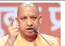
समाजवादी पार्टी पर बोला जमकर हमला, मच्छर बीमारी लाता है, तो माफिया बेरोजगारी

सीएम योगी आदित्यनाथ ने कुशीनगर में समाजवादी पार्टी पर बड़ा हमला बोलते हुए पिछली सरकारों की सत्ता को जंगल राज बताया और कहा कि पहले यहां न बिजली थी और न पानी। हमने मच्छर और माफिया दोनों को खत्म किया। सीएम योगी ने कहा कि डबल इंजन की सरकार ने यूपी की तस्वीर बदली। इस दौरान उन्होंने फाजिलनगर का नाम भगवान महावीर के नाम पर होगा।