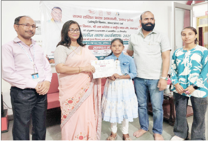
मुजफ्फरनगर: श्रीराम कॉलेज कला प्रदर्शनी में बच्चों को सम्मानित करते अतिथि।