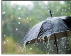
बारिश में भीग गए नौतपा, फर्रुखाबाद सबसे गर्म जिला रहा, गरज चमक के साथ तेज हवाएं भी चलेंगी, तापमान में होगी गिरावट

लखनऊ। पिछले दिनों सक्रिय पश्चिमी विक्षोभ अब धीरे-धीरे कमजोर पड़ रहा है, जिसकी वजह से उत्तर प्रदेश में आंधी पानी और ओले गिरने का सिलसिला कम होगा। प्रदेश के पश्चिमी इलाकों में आज और आने वाले 5-6 दिनों तक कुछ स्थानों पर गरज चमक के साथ बारिश और तेज रफ्तार हवा चल सकती है। वहीं पूर्वी उत्तर प्रदेश में मौसम ड्राई रहेगा। पूर्वी उत्तर प्रदेश में भी दो-तीन दिन बाद कुछ स्थान पर गरज चमक के साथ बारिश और आंधी चलने की संभावना है।