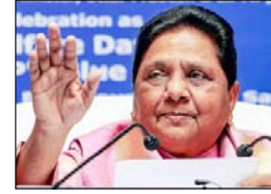
कबड्डी खिलाड़ी की हत्या समाज को झकझोर देने वाली है: बसपा