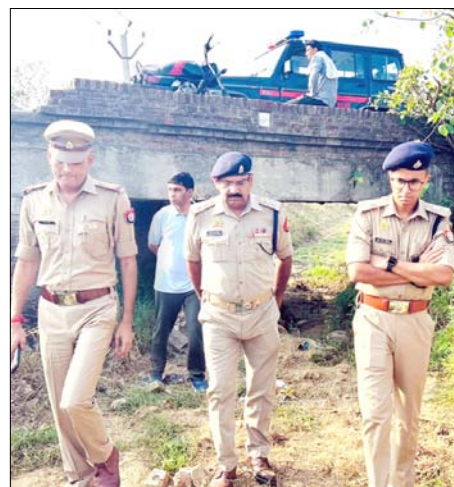
बुढ़ाना: घटना स्थल का निरीक्षण करते एसपी देहात व सीओ।