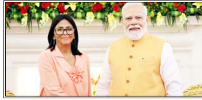
पीएम ने वैश्विक और क्षेत्रीय मुद्दों पर चर्चा के साथ-साथ विकासशील देशों के हितों को बढ़ावा देने पर बात की

नई दिल्ली। भारत और वेनेजुएला ने विशेष रूप से ऊर्जा और उसके साथ-साथ, महत्वपूर्ण खनिज, व्यापार, निवेश, फार्मास्यूटिकल, स्वास्थ्य सेवा तथा ऑटोमोबाइल जैसे क्षेत्रों में सहयोग बढ़ाने पर सहमति व्यक्त करते हुए द्विपक्षीय साझेदारी को और अधिक मजबूत बनाने की प्रतिबद्धता दोहराई है।