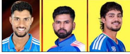
सूर्यकुमार की कप्तानी लेने की दौड़ में श्रेयस अय्यर, ईशान किशन व तिलक वर्मा