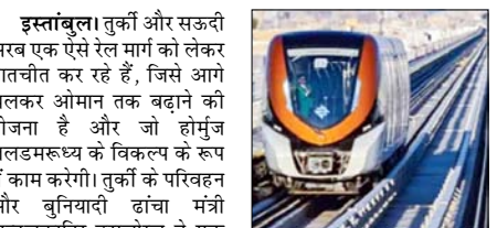
इस्तांबुल। तुर्की और सऊदी अरब एक ऐसे रेल मार्ग को लेकर बातचीत कर रहे हैं, जिससे आगे चलकर ओमान तक बढ़ाने की योजना है और जो होमूज जलडमरूमध्य के विकल्प के रूप में काम करेगी। तुर्की के परिवहन और बुनियादी ढांचा मंत्री अब्दुलकादिर उरालोग्लू ने एक समाचार एजेंसी को बताया कि यह रेल मार्ग काली हद तक हिजाज रेलवे के रास्ते पर आधारित है।

उन्होंने कहा कि पहले चरण में तुर्की की सीमा से सीरिया के अलेप्पो तक रेल पट्टी का निर्माण करना जरूरी है। वहां से दक्षिण तक का एक हिस्सा पहले से ही बना हुआ है-जॉर्डन और सऊदी अरब की सीमा काली हिस्से पर कोई रेलवे नहीं है, हम अभी सऊदी अरब के साथ इसके रास्ते पर चर्चा कर रहे हैं कि यह रास्ता रियाद की ओर मुड़ेगा या इसे हिजाज तक लाया जाएगा। हमारा अंतिम लक्ष्य ओमान तक रेल मार्ग बनाना है। वास्तव में, हम होमूज जलडमरूमध्य से बचे रहकर निकलने वाले रास्ते की बात कर रहे हैं। गौरतलब है कि सऊदी अरब के हिजाज क्षेत्र में मक्का और मदीना के बीच पहले से ही एक तेज गति वाली रेल लाइन मौजूद है। उरालोग्लू ने मार्च में कहा था कि तुर्की ऐतिहासिक हिजाज रेलवे के उस हिस्से को फिर से खोलने के लिए दक्षिण सीरिया के साथ बातचीत कर रहा था जो कभी इन देशों को आपस में जोड़ता था।