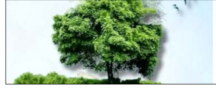
प्रकृति से समझौते का नहीं, संकल्प का समय सम्पादकीय