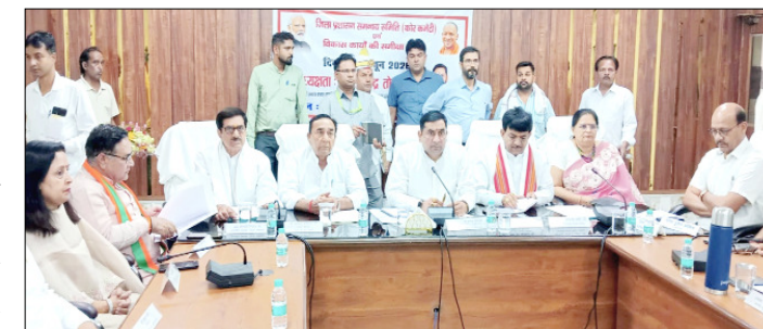
विकास भवन सभागार में उन्होंने विभागवार समीक्षा करते हुए अधिकारियों को शासन की प्राथमिकता वाली योजनाओं को समयबद्ध, पारदर्शी और गुणवत्तापूर्ण ढंग से पूर्ण कराने के निर्देश दिए। समीक्षा के दौरान