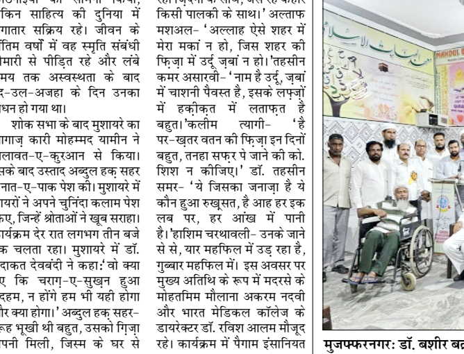
मुजफ्फरनगर: डॉ. बशीर बद्र की याद में मुशायरा व शोकसभा के दौरान मौजूद शायर।

अपने-अपने विभागों की प्रगति रिपोर्ट प्रस्तुत की। इस दौरान जिला अधिकारी सहित अन्य वरिष्ठ प्रशास. निक अधिकारी मौजूद रहे। प्रभारी मंत्री ने सभी विभागों के बीच बेहतर समन्वय स्थापित कर विकास कार्यों को गति देने और जनहित से जुड़े