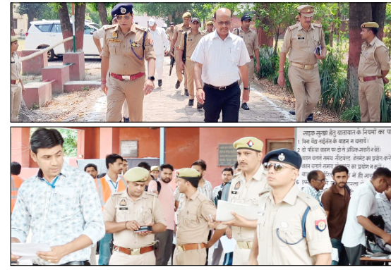
टीजीटी परीक्षा व्यवस्था का जायजा लेते डीएम-एसएसपी व एसपी सिटी।

की असुविधा न होने पाए। उन्होंने ड्यूटी पर तैनात पुलिस अधिकारियों और कर्मचारियों को परीक्षा अवधि के दौरान पूरी सतर्कता बरतने के निर्देश दिए। साथ ही किसी भी संदिग्ध गतिविधि या परीक्षा में व्यवधान डालने के प्रयास पर तत्काल और सख्त कार्रवाई करने को कहा। यातायात व्यवस्था को सुचारु बनाए रखने पर भी विशेष जोर दिया गया। इस दौरान एसपी सिटी ने ट्रेजरी का भी निरीक्षण किया और प्रश्नपत्रों की सुरक्षा, सीसीटीवी निगरानी तथा अन्य सुरक्षा मानकों की समीक्षा की। संबंधित अधिकारियों को सुरक्षा व्यवस्था में किसी प्रकार की लापरवाही न बरतने और निर्धारित प्रोटोकॉल का पूरी तरह पालन सुनिश्चित करने के निर्देश दिए।