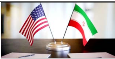
डोनाल्ड ट्रम्प और उनका प्रशासन ईरान को कोई बड़ी रियायत दिए बिना बड़े पैमाने पर धन जारी करने को मंजूरी देने में आनाकानी कर रहा है

ईरान की दो टूक अरबों डॉलर की जब्त की गई उसकी धनराशि को तुरंत जारी किया जाए