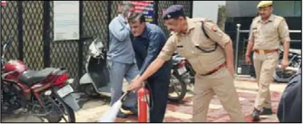
दिल्ली में होटल अग्निकांड के बाद यूपी में अलर्ट जारी

नई दिल्ली, मुजफ्फरनगर, देहरादून, हल्द्वानी, मुरादाबाद, बरेली, मेरठ व लखनऊ से प्रकाशित