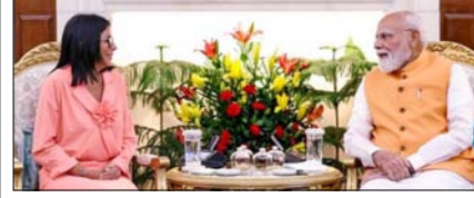
भारत और वेनेजुएला द्विपक्षीय साझेदारी को मजबूत बनाएंगे