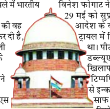
डब्ल्यूएफआई के खिलाफ दिल्ली हाईकोर्ट की टिप्पणियों को हटाने से किया इन्कार

नई दिल्ली। सुप्रीम कोर्ट ने विनेश फोगाट मामले में भारतीय कुश्ती महासंघ (डब्ल्यूएफआई) की वह याचिका खारिज कर दी है, जिसमें उसने दिल्ली हाईकोर्ट द्वारा उनके खिलाफ की गई टिप्पणियों को हटाने की मांग की थी। न्यायमूर्ति पीएस नरसिम्हा और अरविंद कुमार की पीठ ने कहा कि डब्ल्यूएफआई द्वारा दिल्ली हाईकोर्ट के फैसले के खिलाफ दायर याचिका अब हवाला देते हुए कहा कि सार्वजनिक रोजगार सभी योग्य उम्मीदवारों को तय नियमों के तहत ही मिलना चाहिए। सिर्फ इसलिए कि कोई