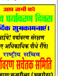
आज सभी को विश्व पर्यावरण दिवस हार्दिक शुभकामनाएं। आईईवी पर्यावरण संरक्षण के लिए अधिकाधिक पौधे रोएं। राष्ट्रीय स्वच्छ पर्यावरण सचेतक समिति आवास:गजरावा (अमरोहा)

जिनेवा। विश्व स्वास्थ्य संगठन (डब्ल्यूएचओ) के महा-निदेशक टेड्रोस आधानोम घेबरेएसस ने कई देशों से अपील की है कि वे कागो लोकात्मक गणराज्य में फैली इबोला महामारी के कारण लगाए गए यात्रा प्रतिबंधों को हटाएं।