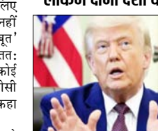
कुछ ऐसी चीजें हैं जिन्हें करने के बारे में उन्होंने कभी नहीं सोचा था, लेकिन अब उन्हें करना पड़ेगा: ट्रम्प

होर्मुज जलडमरूमध्य के आसपास दोनों पक्षों द्वारा की गई सैन्य कार्रवाइयों के कारण तनाव फिर बढ़ गया है, जिससे युद्धविराम पर भी खतरा मंडराने लगा है। अमेरिका के विदेश मंत्री मार्को रूबियो ने बुधवार को कांग्रेस के सदस्यों से कहा कि ट्रम्प प्रशासन द्वारा 'ऑपरेशन एपिक प्युरी' नाम से संचालित सैन्य अभियान समाप्त हो चुका है। उन्होंने कहा कि इस सप्ताह की गई अमेरिकी सैन्य कार्रवाई पूरी तरह रक्षात्मक थी और यह होर्मुज जलडमरूमध्य के निकट जहाजों पर ईरानी हमलों के जवाब में की गई। रूबियो ने कहा कि अपनी सेनाओं की सुरक्षा के लिए हम केवल ड्रोन्स को नहीं, बल्कि उन्हें लॉन्च करने वालों को भी निशाना बनाते हैं। यदि वे जहाजों पर हमला नहीं करेंगे तो हम भी कार्रवाई नहीं करेंगे, लेकिन जवाब देना हमारी मजबूरी है। ट्रम्प और उनकी रिपब्लिकन सरकार लगातार यह दावा करती रही है कि इजरायल के साथ मिलकर ईरान पर की गई सैन्य कार्रवाई उसके परमाणु और बैलिस्टिक मिसाइल कार्यक्रम को रोकने के लिए आवश्यक थी।