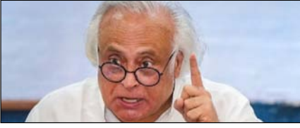
सीबीएसई में अनियमितताएं धर्मप्रधान की अक्षमता का प्रमाण: कांग्रेस

नई दिल्ली, मुजफ्फरनगर, देहरादून, हल्द्वानी, मुगदाबाद, बरेली, मेरठ व लखनऊ से प्रकाशित