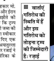
वार्ताएं गतिरोध की स्थिति में हैं और इस गतिरोध को तोड़ना ट्रम्प की जिम्मेदारी है: रेजाई

तेहरान। ईरान के वरिष्ठ सलाहकार मोहसिन रेजाई ने कहा है कि अमेरिका और ईरान के बीच किसी भी संभावित समझौते की सफलता इस बात पर निर्भर करेगी कि ट्रम्प प्रशासन ईरान की 24 अरब डॉलर की जल्द की हुई संपत्तियों को जारी करने की मांग स्वीकार करता है या नहीं। सीएनएन को दिए एक साक्षात्कार में ईरान के सर्वोच्च नेता अयातुल्ला मोजतबा खामेनेई के सैन्य सलाहकार रेजाई ने कहा कि अब अगला कदम अमेरिका के राष्ट्रपति डोनाल्ड ट्रम्प को उठाना है। उन्होंने कहा कि वार्ताएं गतिरोध की स्थिति में हैं और इस गतिरोध को तोड़ना ट्रम्प की जिम्मेदारी है। गंदे अब ट्रम्प के पाले में हैं। उन्होंने चेतावनी दी कि यदि सैन्य टकराव फिर शुरू हुआ तो संघर्ष का दायरा फारस की खाड़ी से कहीं आगे तक फैल सकता है। रेजाई के अनुसार ईरान चाहता है कि अंतरिम समझौते पर हस्ताक्षर होते ही 12 अरब डॉलर जारी किए जाएं, जबकि शेष 12 अरब डॉलर बाद में दिए जाएं। उन्होंने कहा कि यह राशि जारी करना विश्वास बहाली का महत्वपूर्ण कदम होगा और युद्ध समाप्त करने के लिए समझौते तक पहुंचने में मदद करेगा। उन्होंने कहा कि यदि ट्रम्प वास्तव में ईरान के साथ समझौता करना चाहते हैं तो यह 24 अरब डॉलर विश्वास की परीक्षा है। अमेरिका को यह परीक्षा पास करनी होगी,