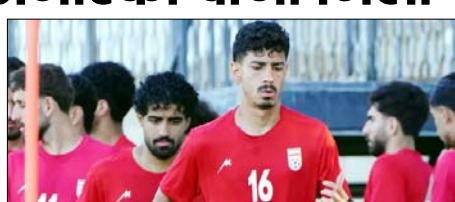
स्टाफ अभी भी वीजा का इंतजार कर रहे हैं। महासंघ का कहना है कि इससे टीम को बराबरी का मौका नहीं मिल रहा है और वह इस मामले को फीफा के सामने उठाएगा। वहीं, अमेरिकी अधिकारियों का कहना है कि सभी खिलाड़ियों, कोच, ट्रेनर और कुछ सपोर्ट स्टाफ को वीजा जारी कर दिया गया है, लेकिन कुछ आवेदनों

तेहरान। ईरान और इजरायल के बीच जारी जंग के बावजूद ईरानी फुटबॉल टीम के खिलाड़ियों को अमेरिका का वीजा मिला गया है। हालांकि टीम के कई सपोर्ट स्टाफ और अधिकारियों को अब तक अमेरिकी वीजा नहीं मिला है। इस पर ईरान ने अमेरिका पर भेदभाव करने का आरोप लगाया है। ईरानी सरकारी मीडिया के मुताबिक, फुटबॉल महासंघ के महासचिव हेदायत मोन्बेनी, उपाध्यक्ष मेहदी मोहम्मद नबी समेत 14 अधिकारी और सहयोगी