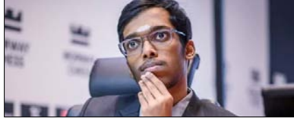
प्रज्ञानंद ने आखिरी राउंड में नॉर्वे चेस 2026 का खिताब जीता