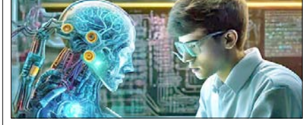
AI के सबसे अच्छे 5 कोर्स: नहीं होगी नौकरी की दिक्कत