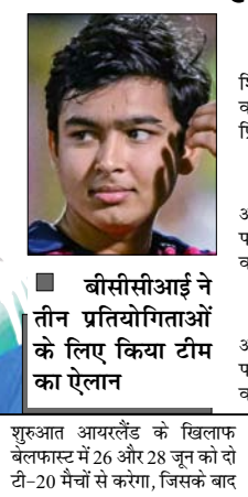
शुरुआत आयरलैंड के खिलाफ बेलफास्ट में 26 और 28 जून को दो टी-20 मैचों से करेगा, जिसके बाद

आयरलैंड के खिलाफ भारतीय टी-20 टीम: श्रेयस अय्यर (कप्तान), अभिषेक शर्मा, संजु सैमसन, ईशान किशन, शिवम दुबे, तिलक वर्मा, नितीश कुमार रेड्डी, अक्षर पटेल, वरुण चक्रवर्ती, वाशिंगटन सुंदर, रवि बिर्नोई, मोहम्मद सिराज, हरित राणा, अशदीप सिंह, प्रिंस यादव और वैभव सूर्यवंशी।