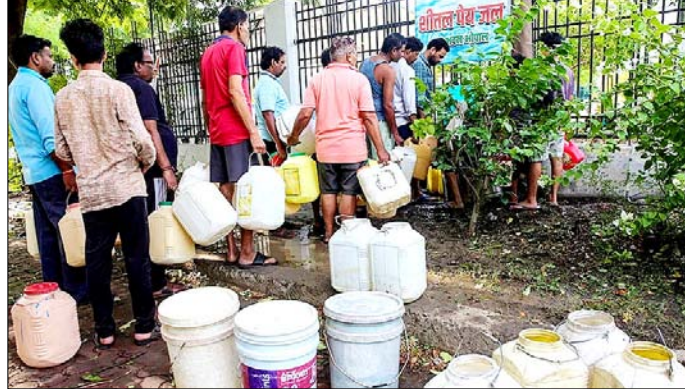
मोपाल। कोला जल आपूर्ति की नगमन पूरी न हो जाने के कारण आपूर्ति बाधित होने से पानी भरने के लिए कतार में खड़े लोग।

वाशिंगटन। अमेरिका ने शुक्रवार को ईरान के खिलाफ बड़ी आर्थिक कार्रवाई करते हुए उसके एक 'संगठित नेटवर्क' पर नए प्रतिबंधों का एलान किया है। अमेरिकी प्रशासन के अनुसार, यह नेटवर्क 'अवैध ऊर्जा व्यापार और वैश्विक वित्तीय धोखाधड़ी' में लिप्त था। इसके जरिए दक्षिण और पूर्वी एशिया के बाजारों में करोड़ों डॉलर मूल्य की ईरानी एलपीजी की तस्करी की जा रही थी। अमेरिकी विदेश और वित्त मंत्रालय के जारी बयानों के मुताबिक ईरान इसे ओमान जैसे तीसरे देशों का बताकर बेच रहा था। इस पूरे खेल को छिपाने के लिए संयुक्त अरब अमीरात (यूएई) और चीन में सक्रिय मुछोटा कंपनियों के साथ-साथ ईरान के जहाजों के लिए छद्म बेड़े का इस्तेमाल किया जा रहा था। ये जहाज अपनी पहचान और ईंधन के ईरानी मूल को छिपाकर परिवहन कर रहे थे।