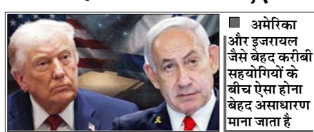
अमेरिका और इजरायल जैसे बेहद करीबी सहयोगियों के बीच ऐसा होना बेहद असाधारण माना जाता है

वाशिंगटन। अमेरिका और इजरायल के बीच ईरान को लेकर मतभेद बढ़ रहे हैं। इस बीच अमेरिकी रक्षा विभाग (पेंटागन) के भीतर यह चिंता बढ़ गई है कि इजरायल अमेरिकी अधिकारियों और ट्रम्प सरकार की अंदरूनी जानकारी जुटाने के लिए जासूसी की कोशिश कर रहा है। एक रिपोर्ट के मुताबिक दो मोज़ेदा और एक पूर्व अमेरिकी अधिकारी ने बताया कि पेंटागन की डिफेंस इंटेलिजेंस एजेंसी (डीआईए) ने हाल ही में इजरायल से जुड़े काउंटर-इंटेलिजेंस खतरे का स्तर बढ़ाकर 'क्रिटिकल' कर दिया है। यह एजेंसी का सबसे गंभीर अलर्ट माना जाता है। अमेरिका और इजरायल जैसे बेहद करीबी सहयोगियों के बीच ऐसा होना बेहद असाधारण माना जाता है। हालांकि इजरायल ने इन आरोपों