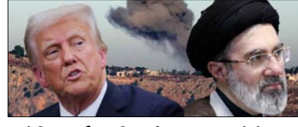
अमेरिका-ईरान फिर सैन्य टकराव के बेहद करीब